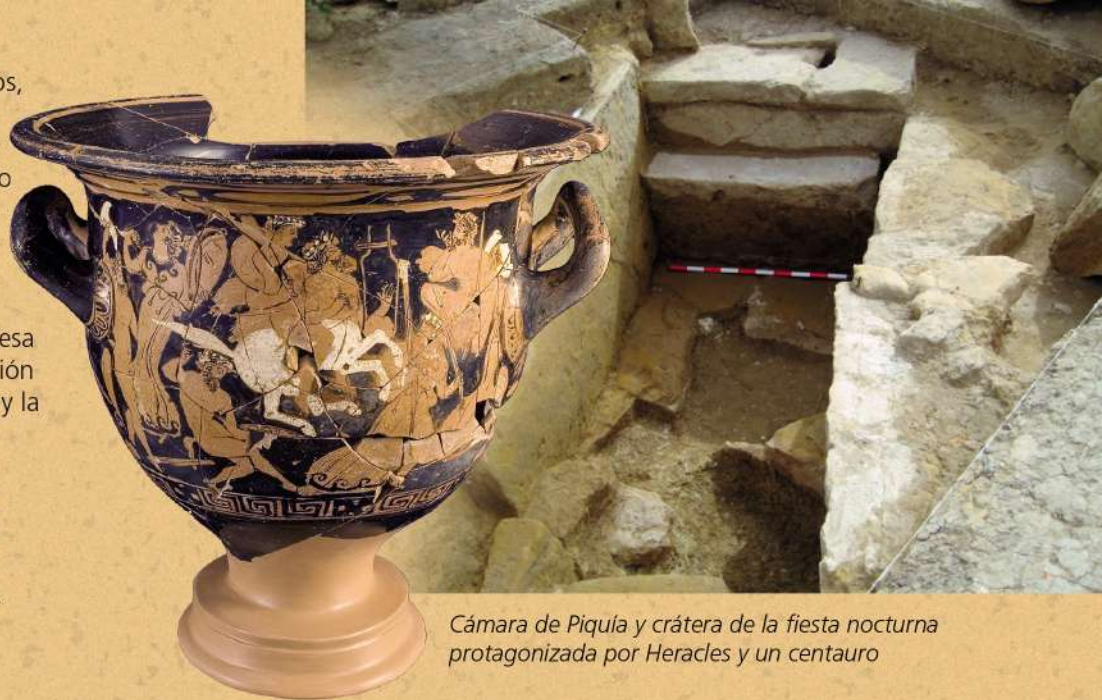
Cámara de Piquía y crátera de la fiesta nocturna protagonizada por Heracles y un centauro

De uno de los nuevos príncipes íberos, Itirtiiltir, era la cámara funeraria de Piquía , Arjona, y su lujoso ajuar, que contenía un excepcional conjunto de cráteras griegas fabricadas en Atenas tres siglos antes. Las pinturas de los vasos griegos muestran escenas mitológicas de Heracles (Hércules latino) y de Helena (la princesa de Troya) que componen una narración única sobre los ritos del matrimonio y la heroización (por la que el héroe era divinizado). Se trata de dos temas esenciales para el ideal aristocrático íbero, pues con uno se aseguraba el futuro del linaje gobernante y con otro se justificaba su antiguo origen.