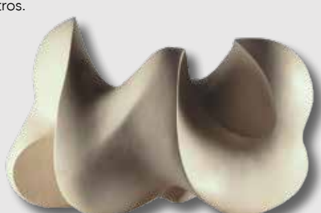
) Equipo 57, sin título