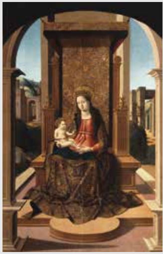
) Pedro Romana, Virgen con el Niño