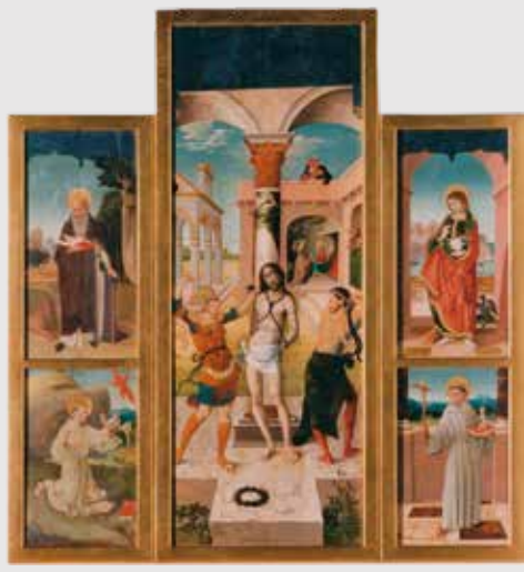
) Maestro del Retablo de la Flagelación, Retablo de la Flagelación