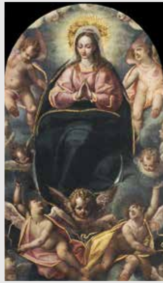
) Pablo de Céspedes, Virgen con ángeles

Entre sus discípulos más notables figuran Juan de Alfaro y Gámez, del que han ingresado en los últimos años algunas obras interesantes y con el que prácticamente queda cerrado el capítulo del Barroco naturalista cordobés hasta la aparición de Antonio Palomino y Velasco, también representado con varias obras. Además, debido a sus especiales vinculaciones con la ciudad, el museo cuenta con diversas