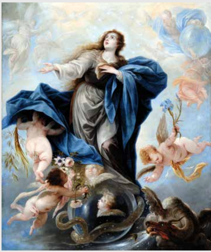
) Juan Antonio de Frías y Escalante, Inmaculada Concepción

obras de Juan Antonio Escalante y Juan de Valdés Leal, que se exponen junto a las de los artistas locales coetáneos.