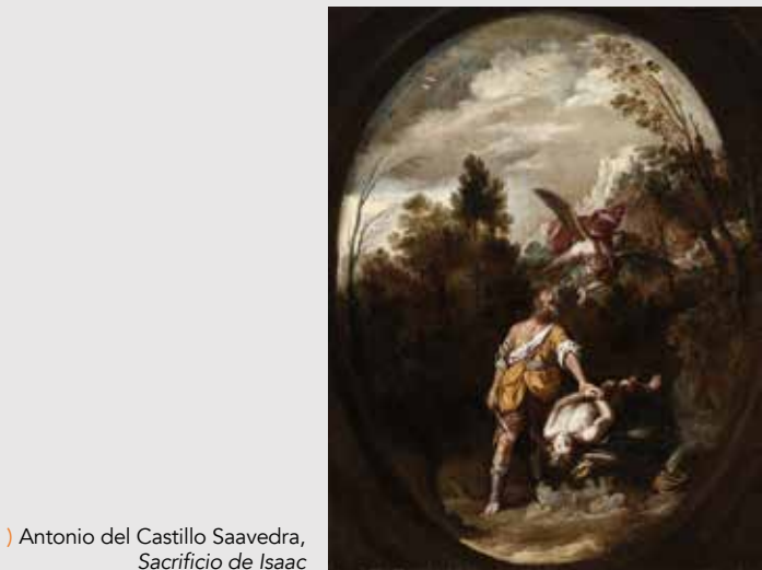
) Antonio del Castillo Saavedra, Sacrificio de Isaac