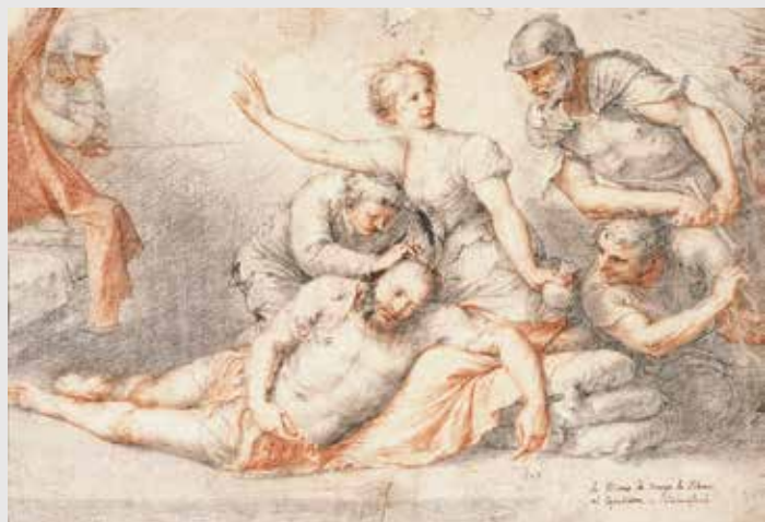
) José de Ribera, Sansón y Dalila