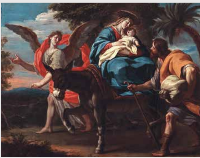
) Antonio Acisclo Palomino, Huida a Egipto

Desde su origen, y a causa de los criterios desamortizadores, este museo fue deficitario en fondos de escultura, a pesar de lo cual se ha visto enriquecido en los últimos tiempos con alguna del maestro barroco Juan de Mesa, nacido en la ciudad.