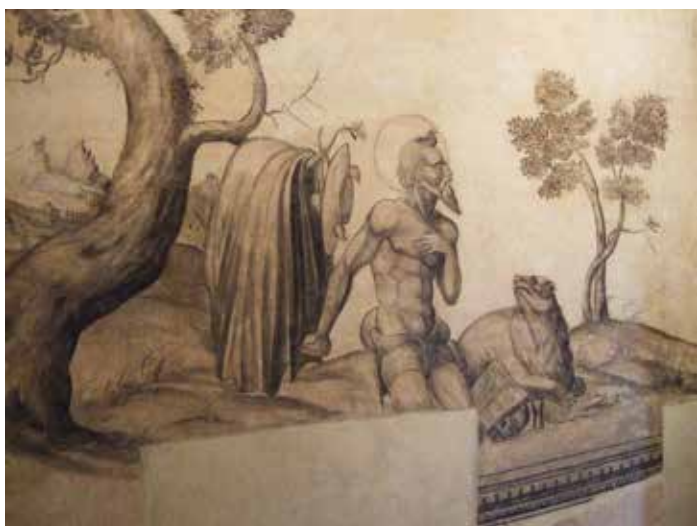
) Pinturas murales de la escalera del antiguo hospital de la Caridad (detalle)