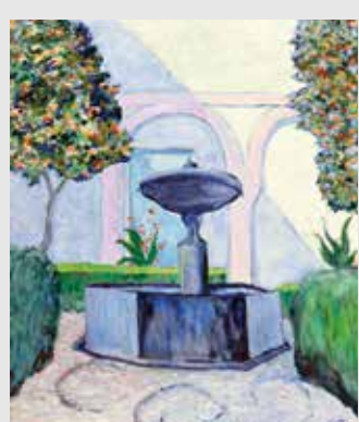
) Rafael Botí Gaitán, La fuente del patio del museo