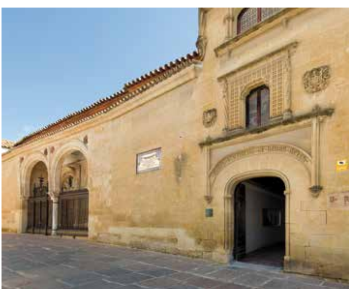
) Fachada del museo a la plaza del Potro

En mayor o menor grado, todo ello ha contribuido a acrecentar y definir la composición general de las colecciones que actualmente con-