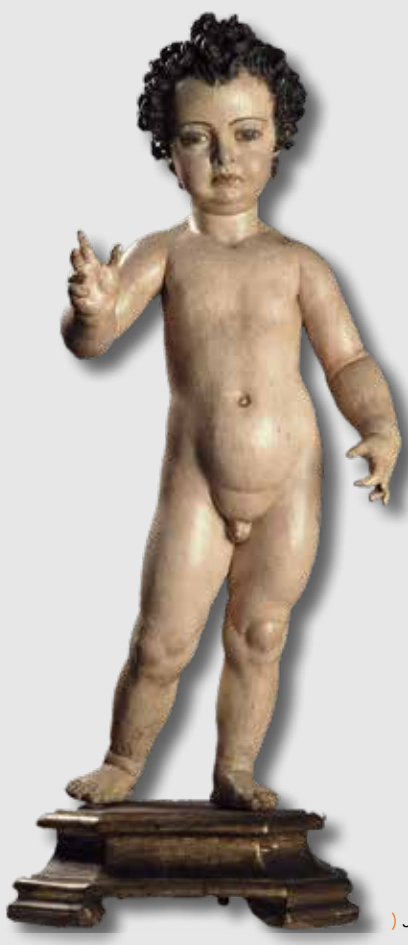
) Juan de Mesa Velasco, Niño Jesús

En esta línea destacamos a los pintores Mariano Fortuny, Francisco Pradilla, Joaquín Agrassot, Ignacio Pinazo, Carlos de Haes, Jaime Morera, Aureliano de Beruete, Santiago Rusiñol, Ramón Casas, Eliseo Meifrén, Dario de Regoyos, Ricardo Baroja, Ignacio Zuloaga, José Gutiérrez Solana, Valentín y Ramón de Zubiaurre o Gonzalo Bilbao; y a los escultores Jerónimo Suñol, Mariano Benlliure, Lorenzo Coullaut Valera, Miguel Blay, Sebastián Miranda, Julio Antonio, Quintín de Torre, Juan Cristóbal o Juan Bautista Adsuara.