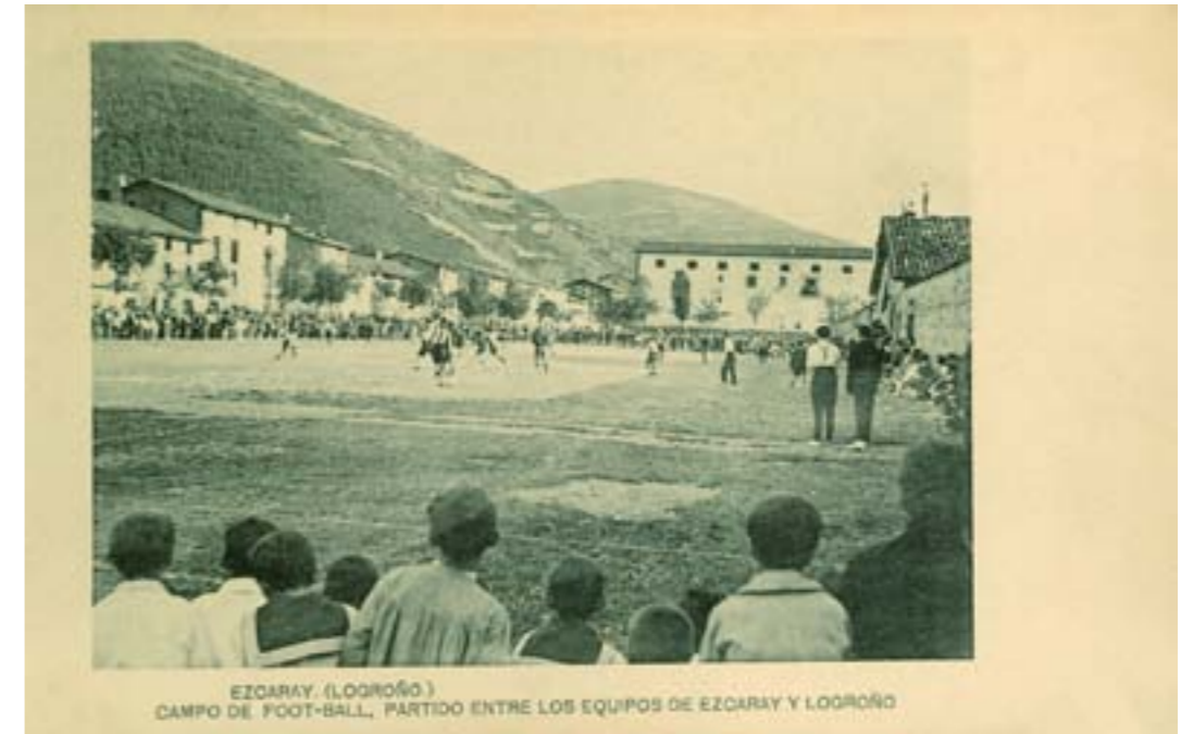
Dj12293. Ezcaray (Logroño). Campo de futbol, partido entre los equipos de Ezcaray y Logroño. Impresión de Hauser y Menet, Madrid. 1918.