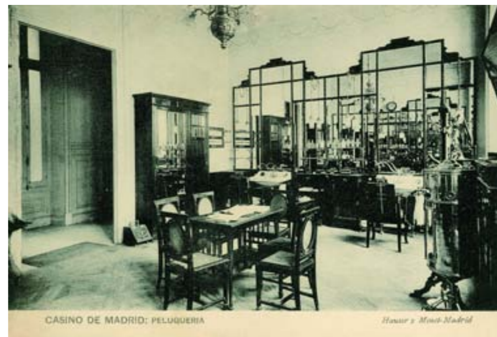
Dj10988. Casino de Madrid: Peluquería . Edición e impresión de Hauser y Menet, Madrid. 1913.