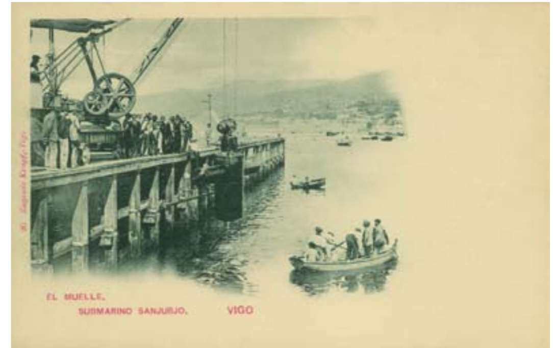
Dj10721. El Muelle. Submarino Sanjurjo. Vigo (Pontevedra). Número 20 de la edición de Eugenio Krapf, Vigo. Impresión de Hauser y Menet. 1898.