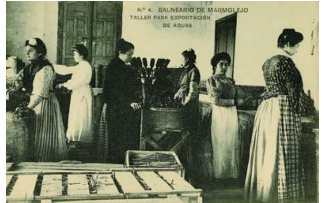
Dj7134. Balneario de Marmolejo. Taller para exportación de aguas . N.º 4 de la edición del balneario. Impresión de Hauser y Menet, Madrid. 1907.