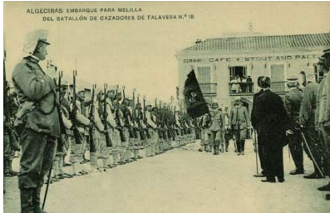
Dj7579. Algeciras: Embarque para Melilla del batallón de cazadores de Talavera nº 18. Impresión de Hauser y Menet, Madrid. 1908.