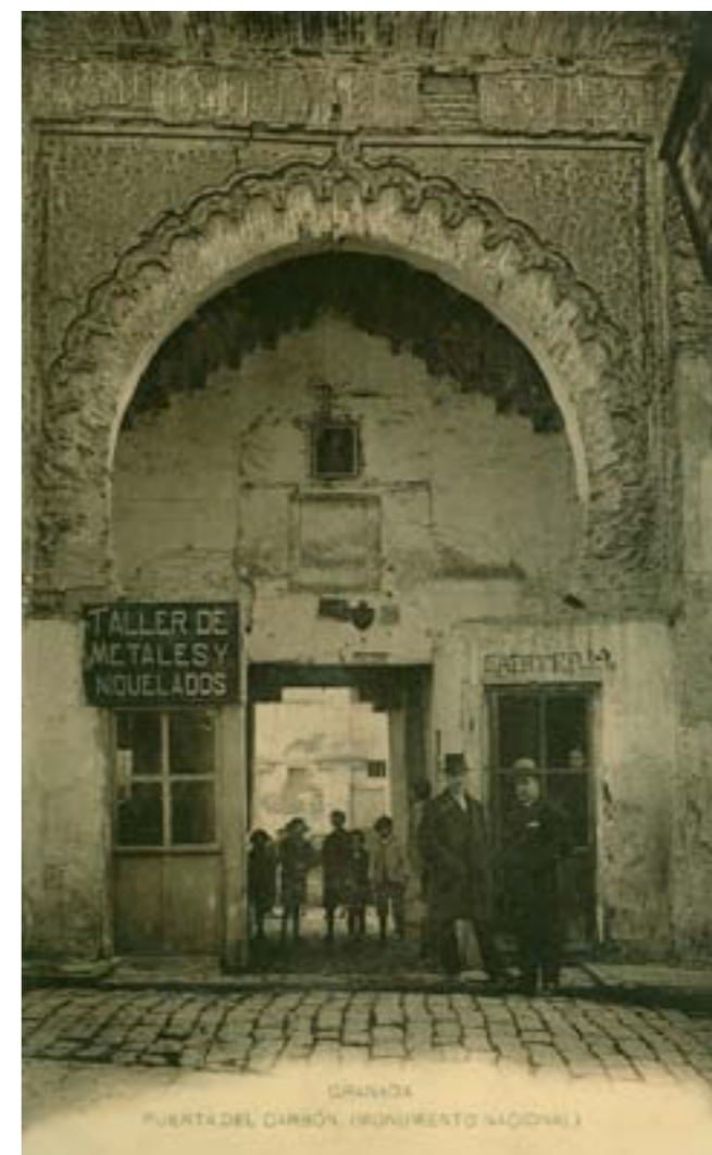
GRANADA PUERTA DEL CARBÓN. (MONUMENTO NACIONAL)