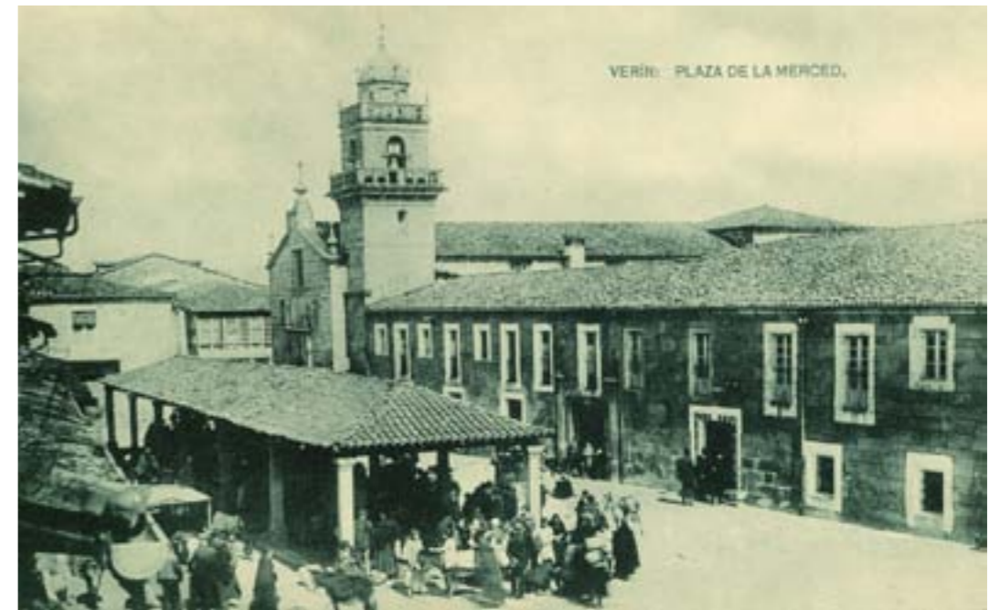
Dj10590. Verín: Plaza de la Merced . Editor desconocido. Impresión de Hauser y Menet, Madrid. 1913.