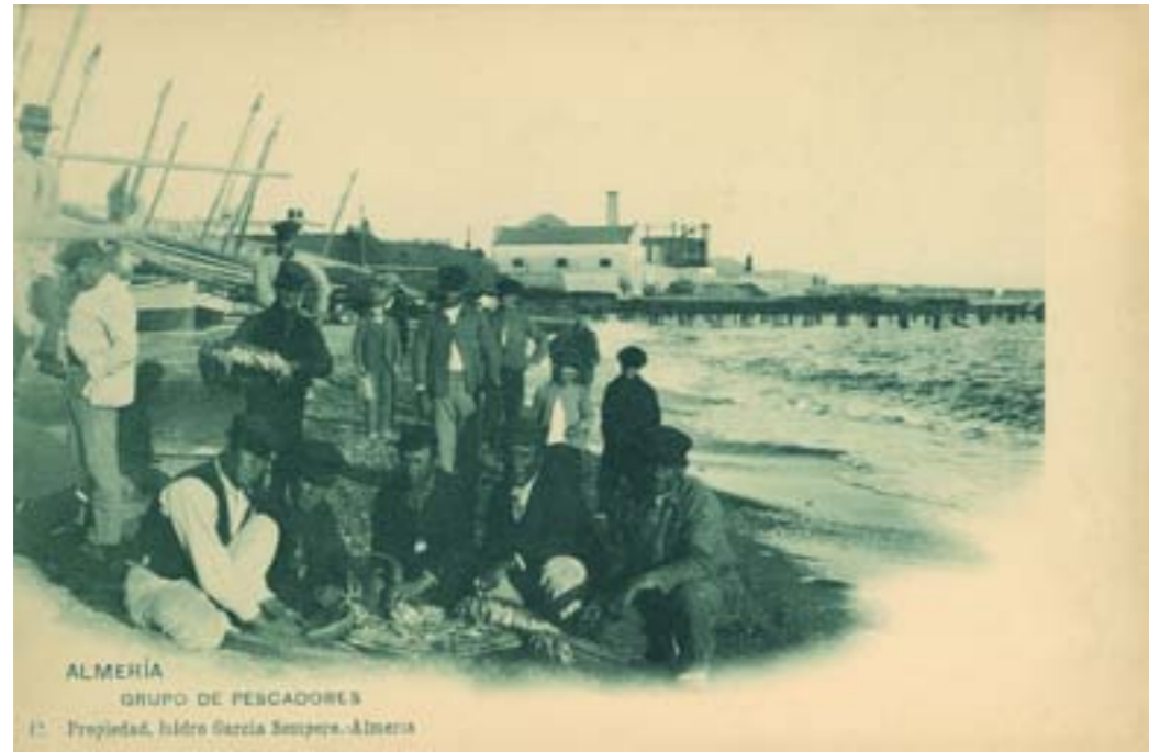
Dj6880. Almería. Grupo de pescadores. Nº 12 de la edición de Isidro García Sempere, Almería. Impresión de Hauser y Menet, Madrid. 1902.