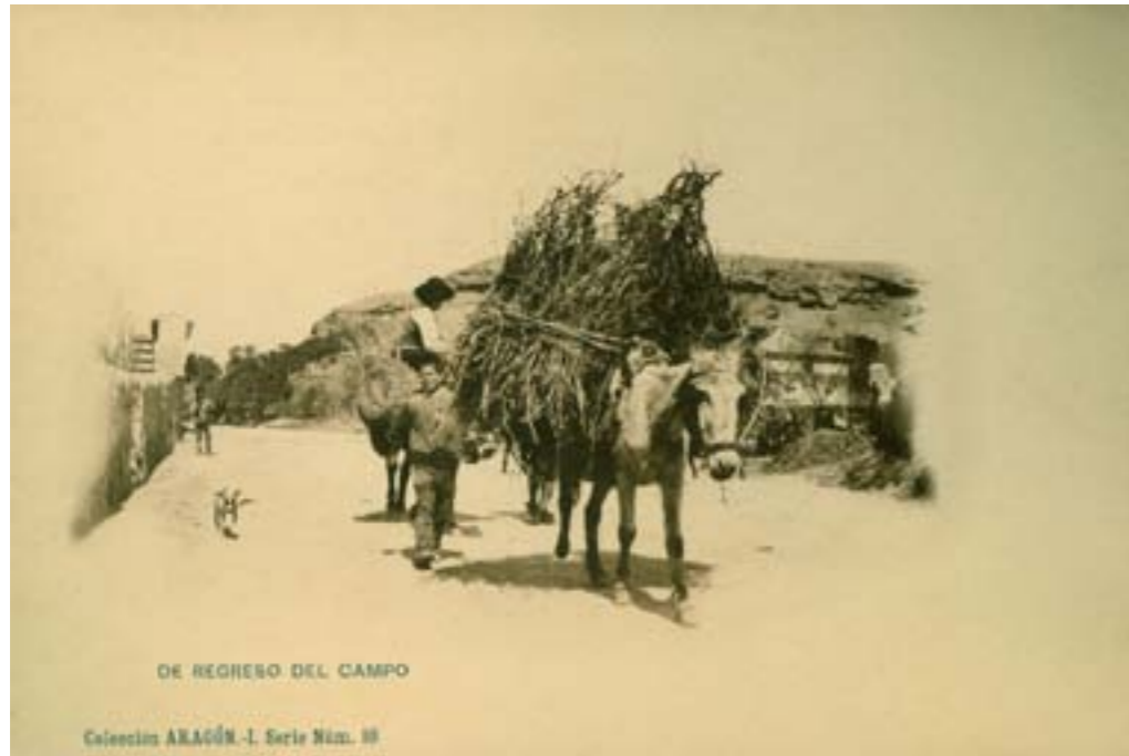
DE REGRESO DEL CAMPO