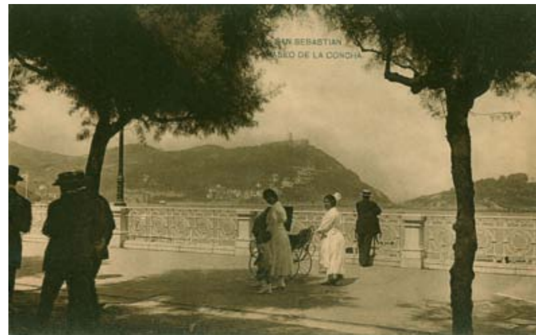
Dj11583. San Sebastián. Paseo de la Concha. Impresión de Hauser y Menet, Madrid. 1918.