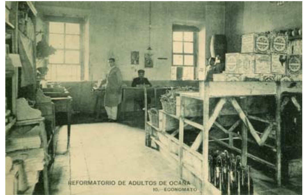
Dj10318. Reformatorio de adultos de Ocaña. Economato. Nº 10 de la edición del Reformatorio. Impresión de Hauser y Menet, Madrid, 1917.