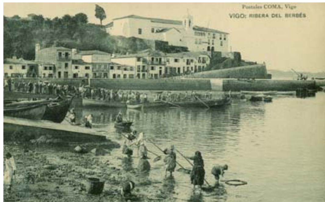
Dj10795. Vigo: Ribera del Berbés . Edición de Postales Comas, Vigo. Impresión de Hauser y Menet, Madrid. 1905.