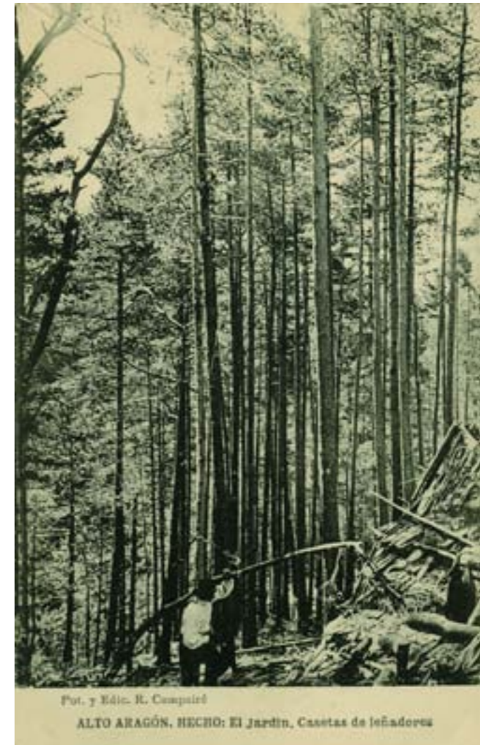
Dj7948. Hecho (Alto-Aragón): El jardín. Casetas de leñadores. Fotografía y edición de R. Comparé. Impresión de Hauser y Menet, Madrid. H. 1920.