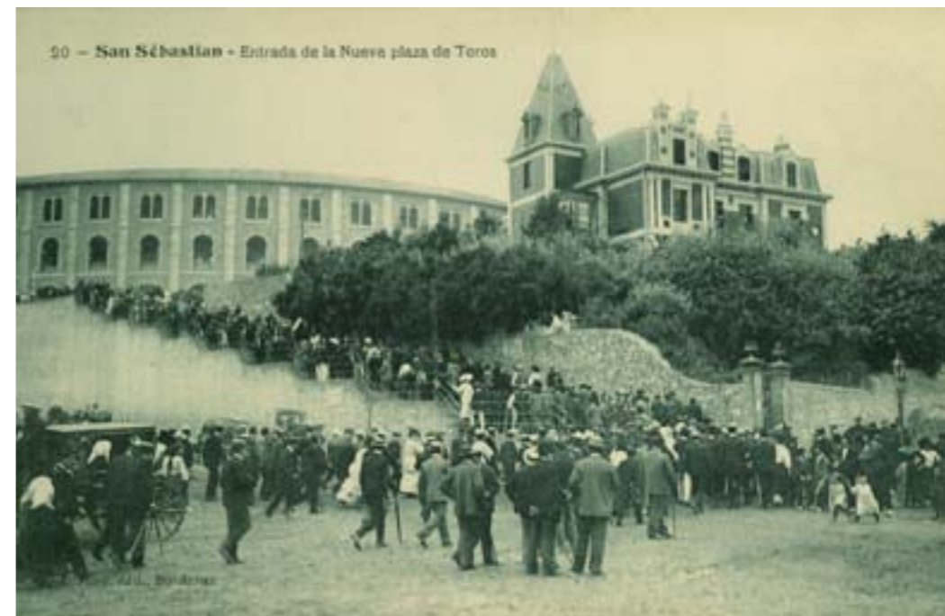
Dj11633. San Sebastián- Entrada de la nueva Plaza de Toros. N.º 20 de la edición de L. Bosq. Bordeaux. H. 1905.