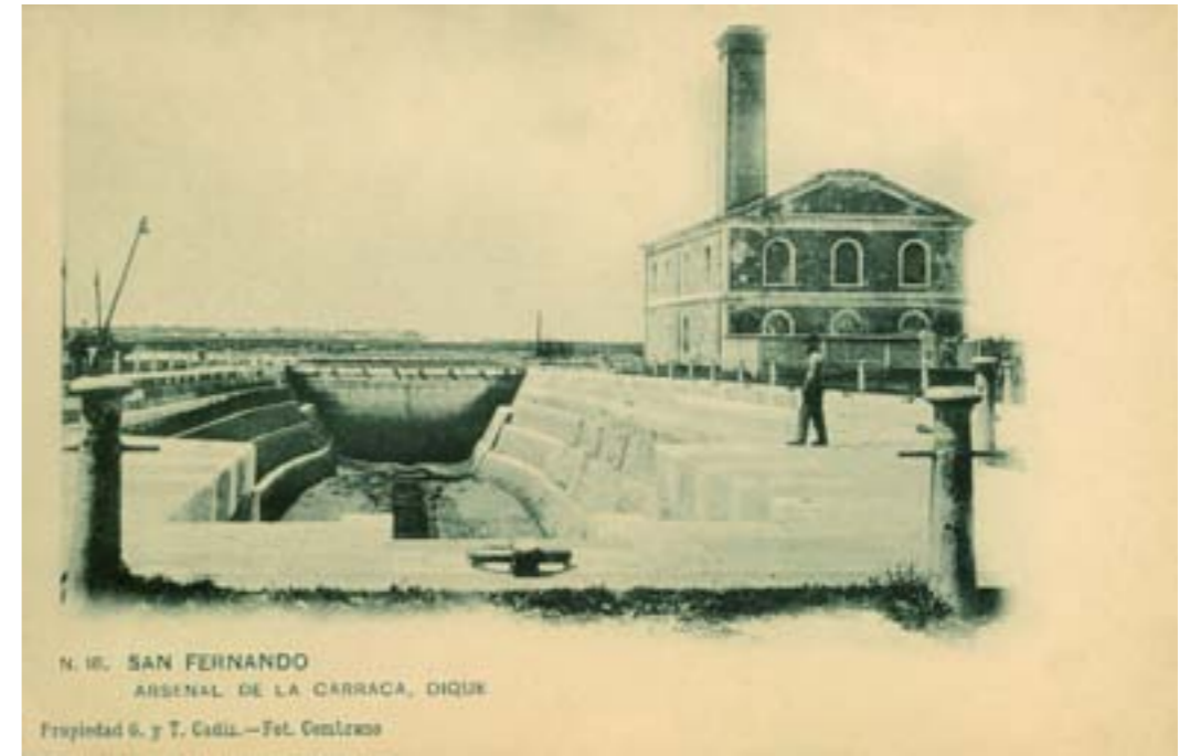
N. 18. SAN FERNANDO ARSENAL DE LA CARRACA, DIQUE Propiedad S. y T. Cádiz.—Fot. Cembrano