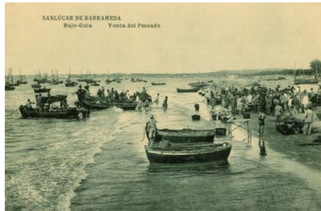
Dj7817. Sanlúcar de Barrameda. Bajo-Guía. Venta del pescado. Impresor desconocido. H. 1920.