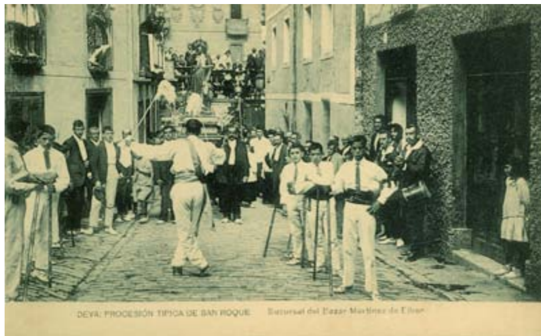
Dj11863. Deva: Procesoión típica de San Roque . Edición de la Sucursal del bazar Martínez de Eibar. Impresión de Hauser y Menet, Madrid. 1913.