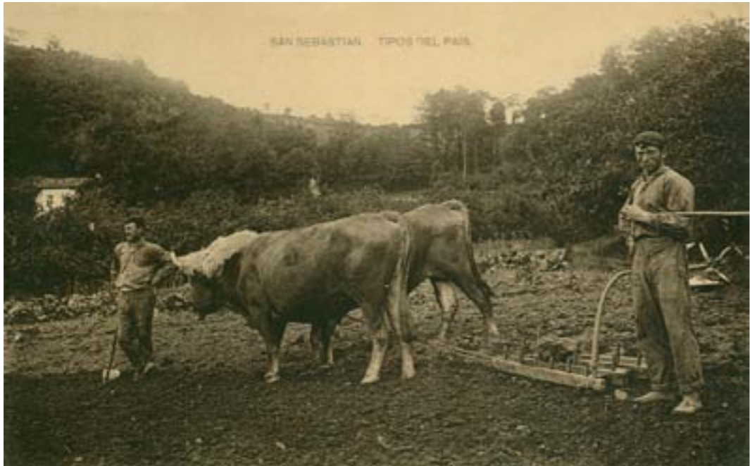
Dj11599. San Sebastián. Tipos del país. Impresión de Hauser y Menet, Madrid. 1918.