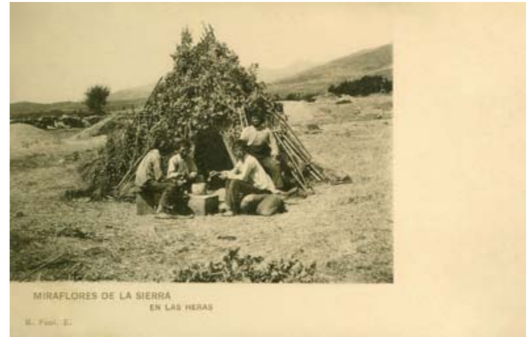
Dj11295. Miraflores de la Sierra. En las heras. Edición de R. Font. Impresión de Hauser y Menet, Madrid. 1917.