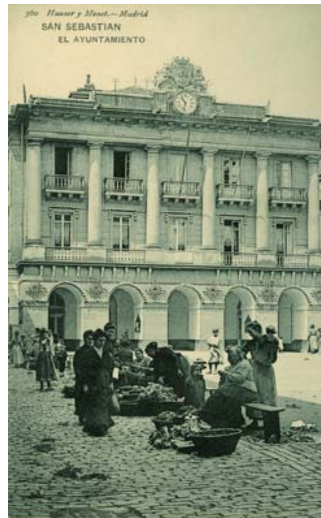
Dj11638. San Sebastián. El Ayuntamiento . Nº 360 del catálogo general de Hauser y Menet, Madrid.