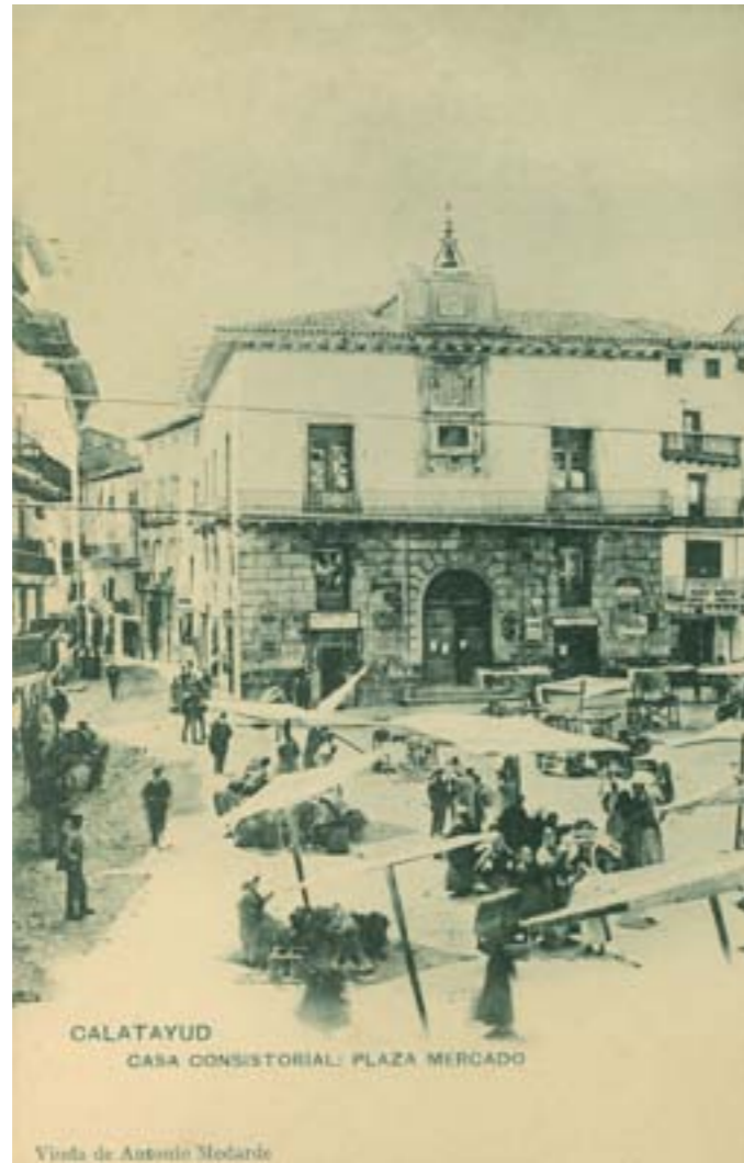
Dj8134. Calatayud. Casa Consistorial: Plaza Mercado. Edición de Viuda de Medarde. Impresión de Hauser y Menet, Madrid. 1904.