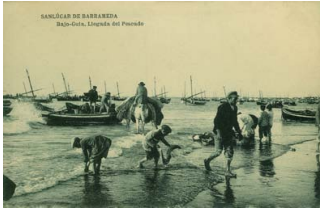
Dj7816. Sanlúcar de Barrameda. Bajo-Guía. Llegada del pescado. Edición de Manuel Barreiro, Sevilla. Impresor desconocido. H. 1920.