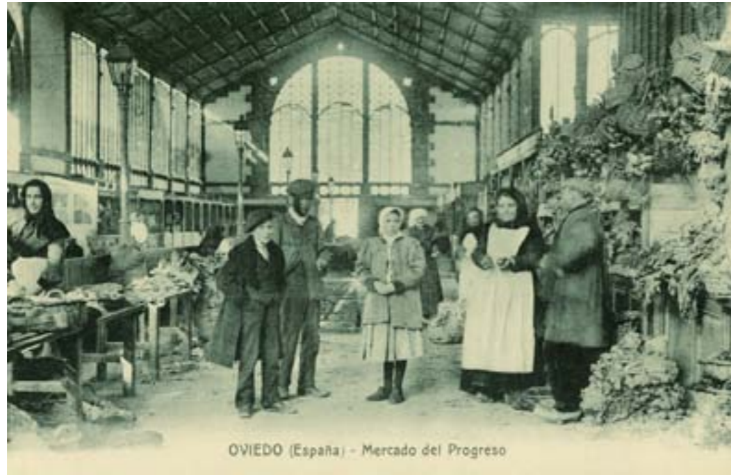
OVIEDO (España) - Mercado del Progreso

Dj8382. Oviedo (Asturias) - Mercado del Progreso . Editor e impresor desconocido. H. 1920.