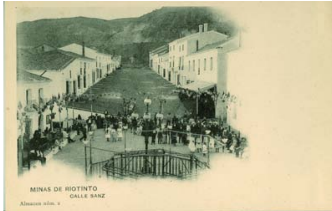
Dj7190. Calle Sanz. Minas de Riotinto (Huelva). Edición de la compañía minera. Impresión Hauser y Menet, Madrid. 1905.