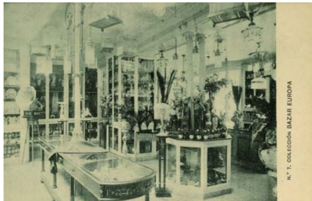
Dj7509. Colección Bazar Europa n.º 7. Cádiz. Edición e impresión de Hauser y Menet, Madrid. 1912.