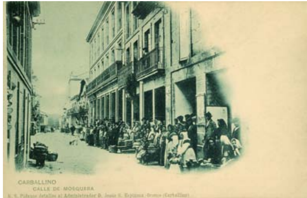
CARBALLINO CALLE DE MOSQUERA