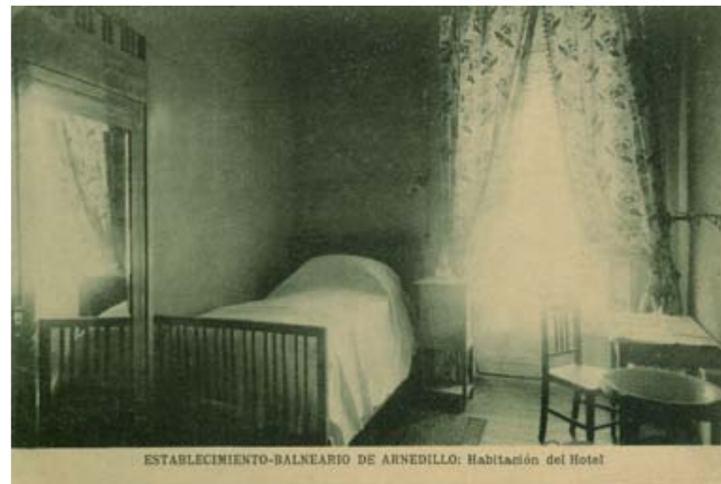
Dj12260. Establecimiento-Balneario de Arnedillo: Habitación del Hotel. Edición del balneario. Impresión de Hauser y Menet, Madrid. 1913.