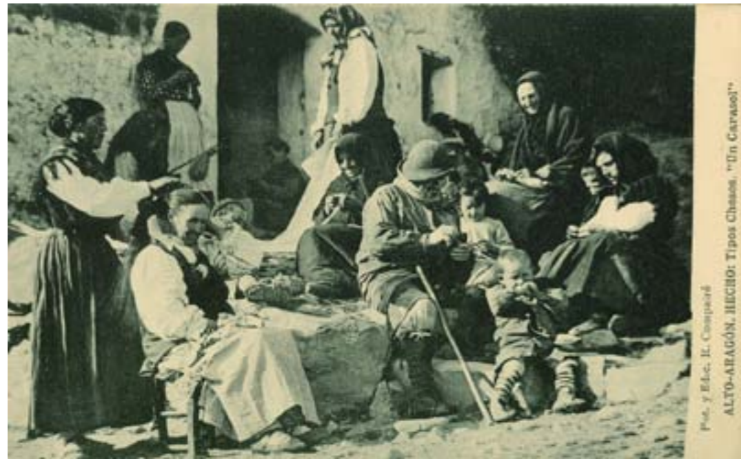
Pro. y Edic. R. Comparé ALTO-ARAGÓN. HECHO: Tipos Chesos. «Un caraso!»