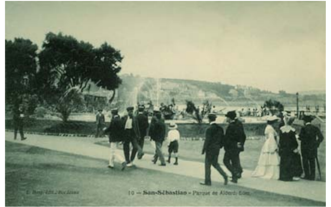
Dj11630. San Sebastián- Parque de Alberdi-Eder . Nº 10 de la edición de L. Bosq. Bordeaux. H. 1905.