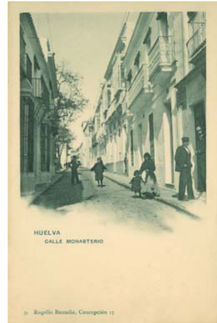
Dj7149. Calle Monasterio. Huelva. Número 9 de la edición de Rogelio Buendía, Huelva. Impresión de Hauser y Menet, Madrid. 1904.