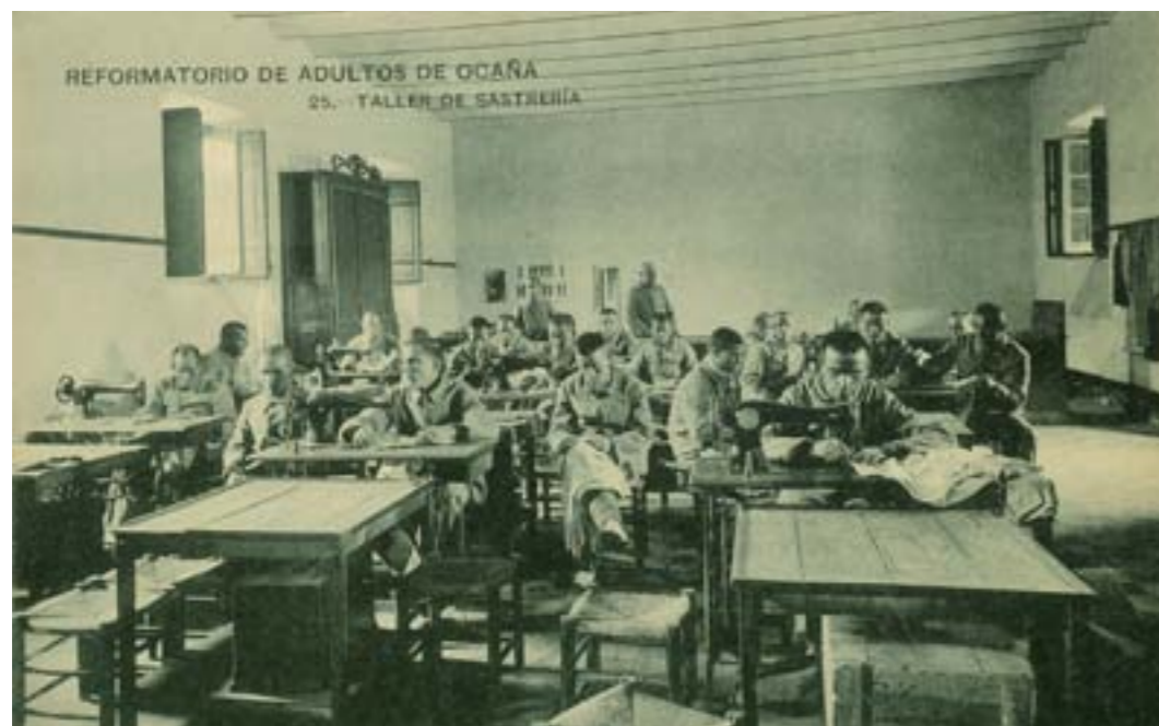
Dj10329. Reformatorio de adultos de Ocaña - Taller de sastrería. Nº 25 de ña edición del Reformatorio. Impresión de Hauser y Menet, Madrid. 1917.