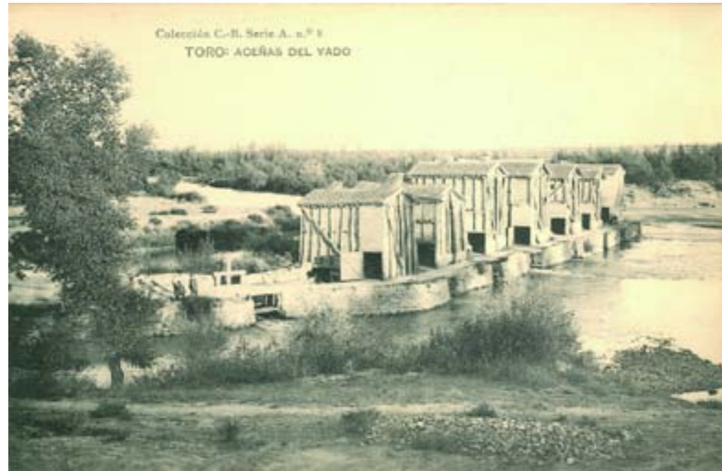
Dj10121. Toro: Aceñas del Vado . Colección C.-B. Serie A. Nº 8. Impresión de Hauser y Menet, Madrid. 1918.