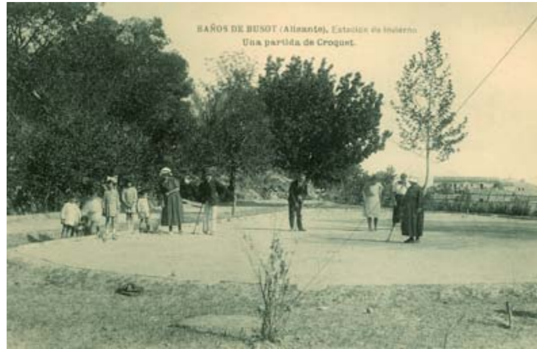
Dj12385. Baños de Bussot (Alicante). Estación de invierno. Una partida de croquet. Impresión de Hauser y Menet, Madrid. 1917.