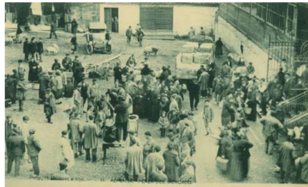
Dj11835. Azpeitia: Plaza del Mercado. Nº 11 de la edición de H. Gulbert e Hijo. Impresión de Hauser y Menet, Madrid. 1918.