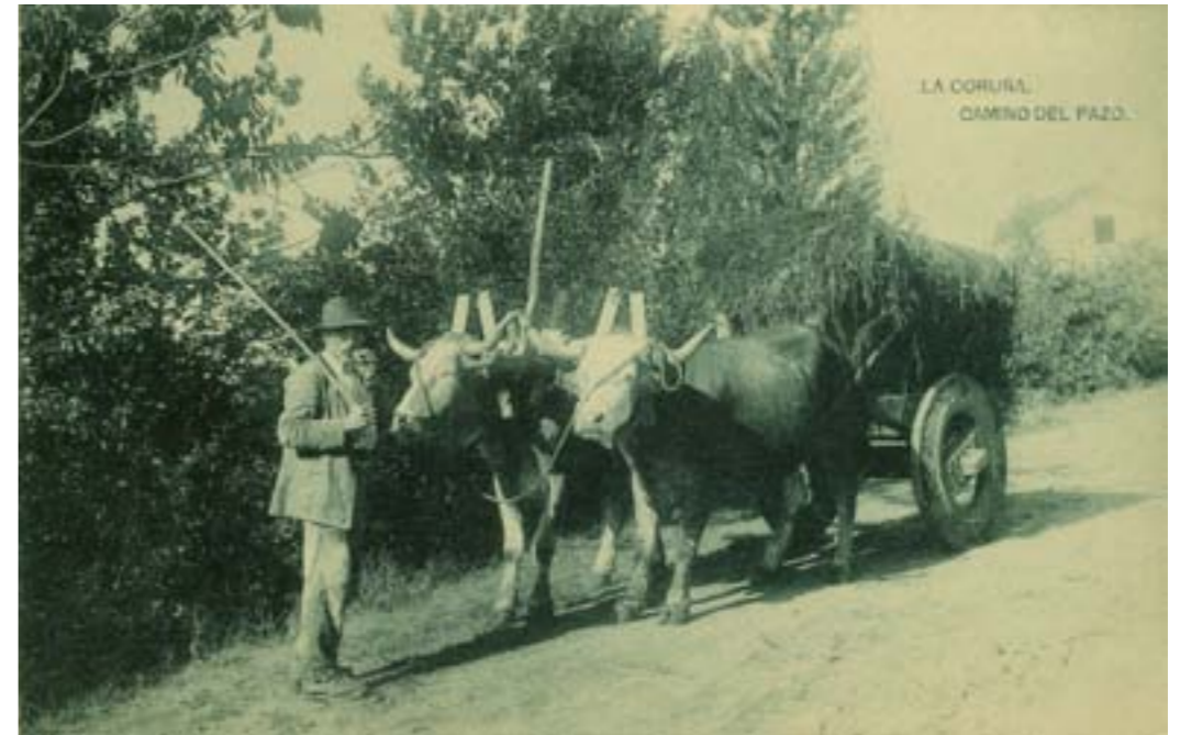
Dj12671. La Coruña. Camino del pazo. Edición e impresión de Hauser y Menet, Madrid. 1918.