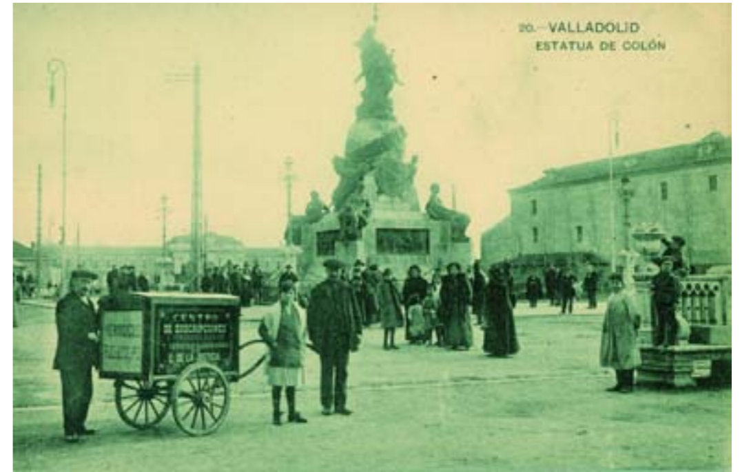
Dj10009. Valladolid. Estatu de Colón . Nº 20 de la edición de L.J., Valladolid. Impresor desconocido. H. 1920.