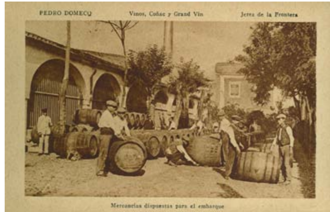
Dj7696. Mercancías dispuestas para el embarque . Editada por Pedro Domecq. Vinos, coñac y grand vin. Jerez de la Frontera. Impresión de Mateu, Madrid. H. 1910.