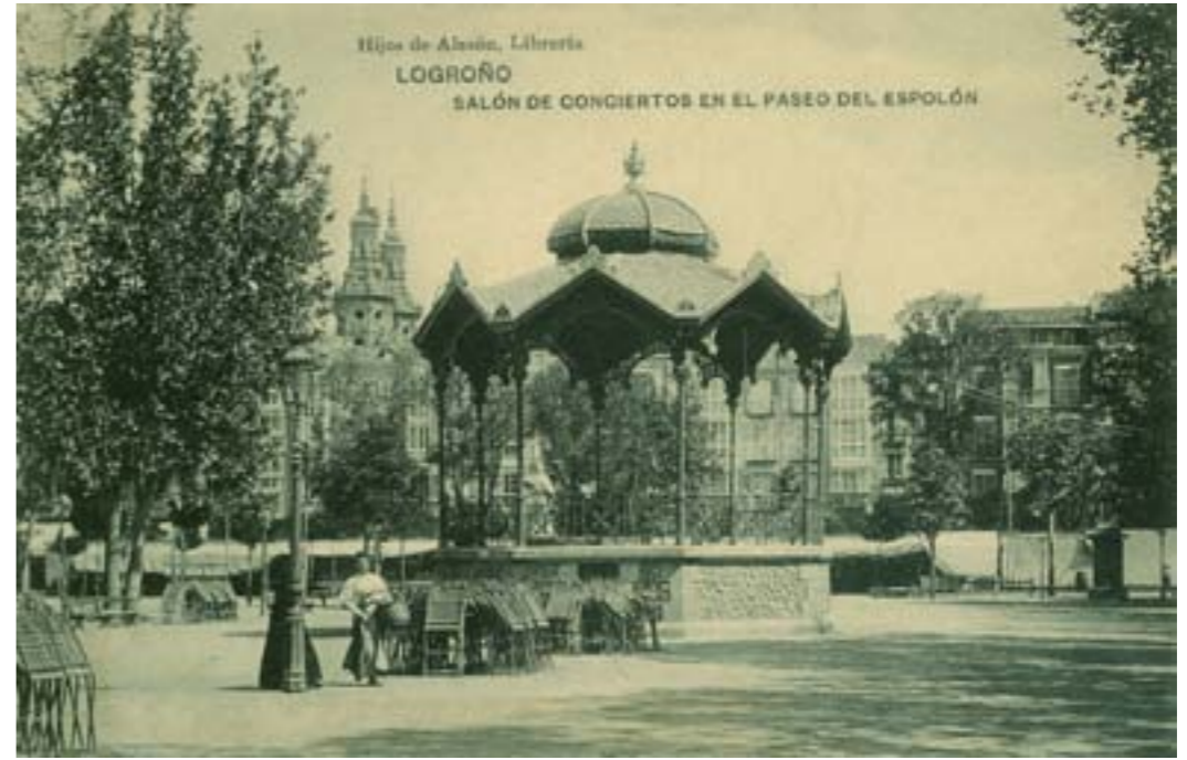
Dj12188. Logroño. Salón de conciertos en el Paseo del Espolón. Edición de Hijos de Alerón, Librería. Impresión de Hauser y Menet, Madrid 1918.