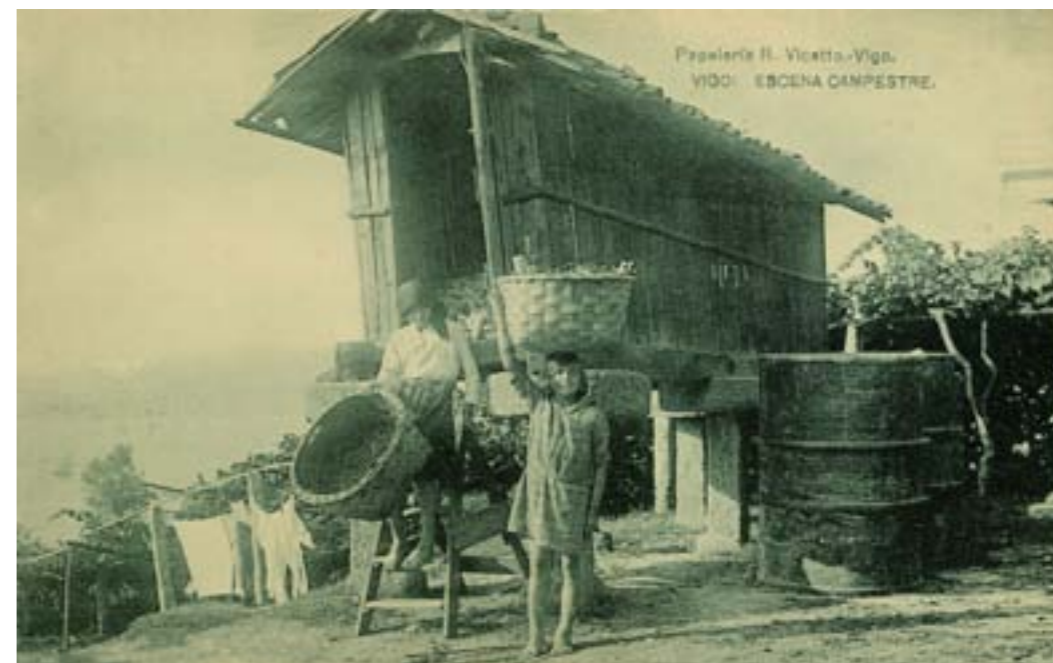
Papelería R. Vicetto-Vigo. VIGO: ESCENA CAMPESTRE.