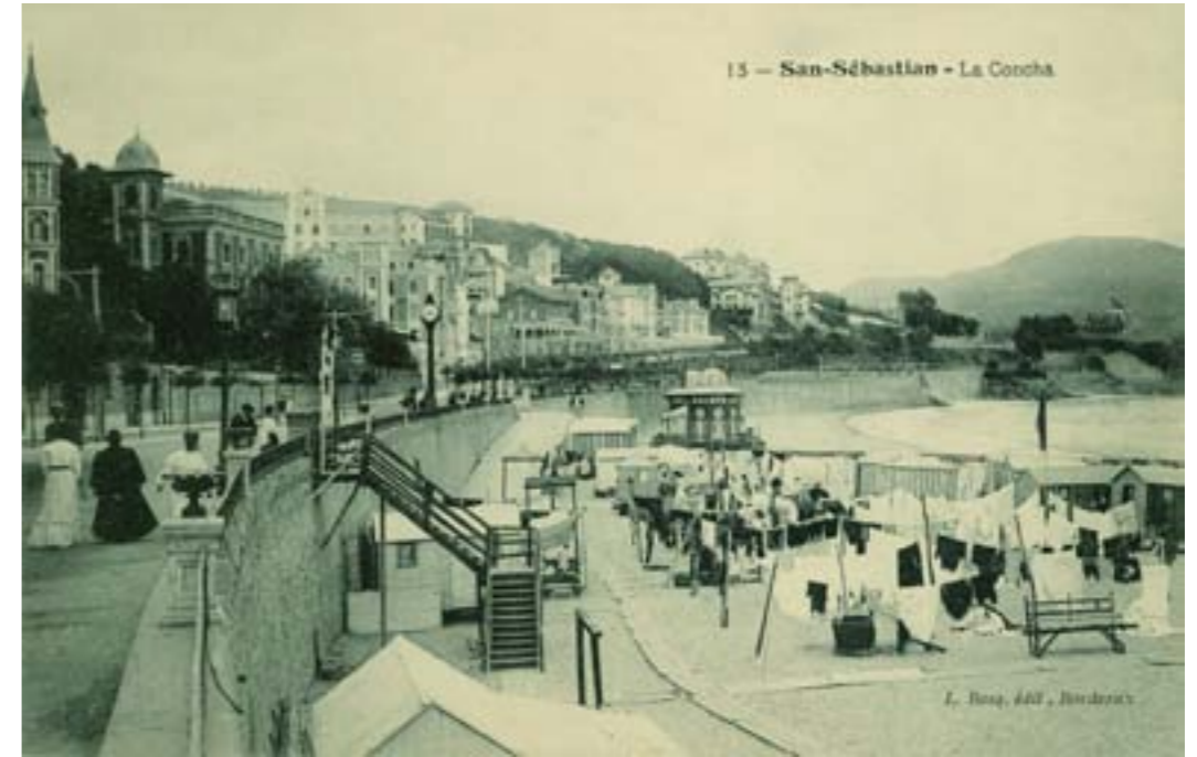
Dj11631. San Sebastián.-La Concha. Nº 13 de la Edición de L. Bosq. Bordeaux. H. 1905.