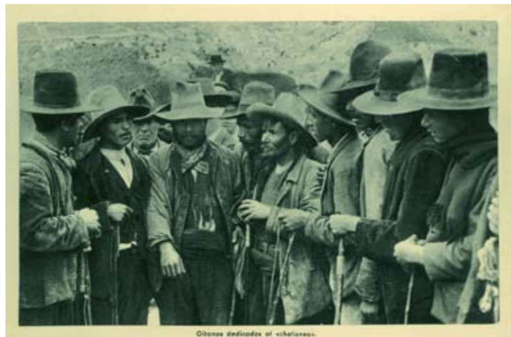
Gitanos dedicados al «chalaneo».

Dj6956. Gitanos dedicados al «chalaneo» . Edición e impresión de Hecograbado Fournier, Vitoria. H. 1925.