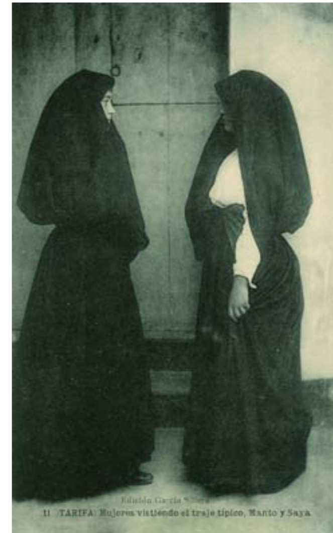
Dj7876. Tarifa: Mujeres vistiéndose el traje típico. Manto y Saya . Nº 11 de la edición de García Sillero. Impresión de Hauser y Menet, Madrid. 1913.