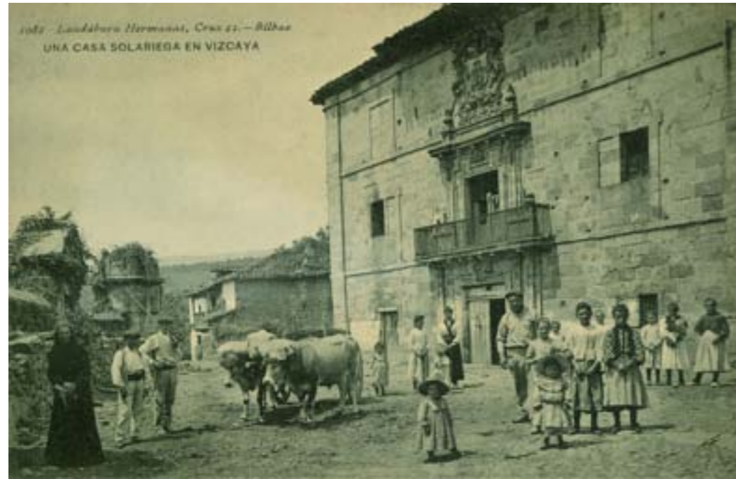
1082 - Landáburu Hermanas, Crux 21. - Bilbao UNA CASA SOLARIEGA EN VIZCAYA