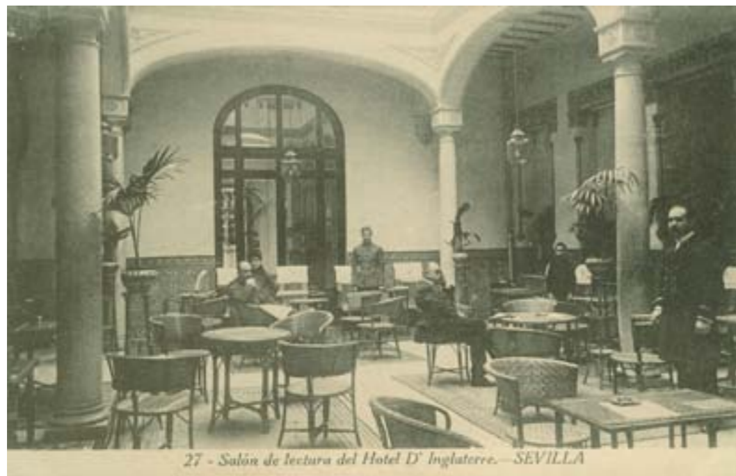
Dj6652. Sala de lectura del Hotel D'Inglaterra, Sevilla. Nº 27 de la edición de Galmes. Impresor desconocido. H. 1913.