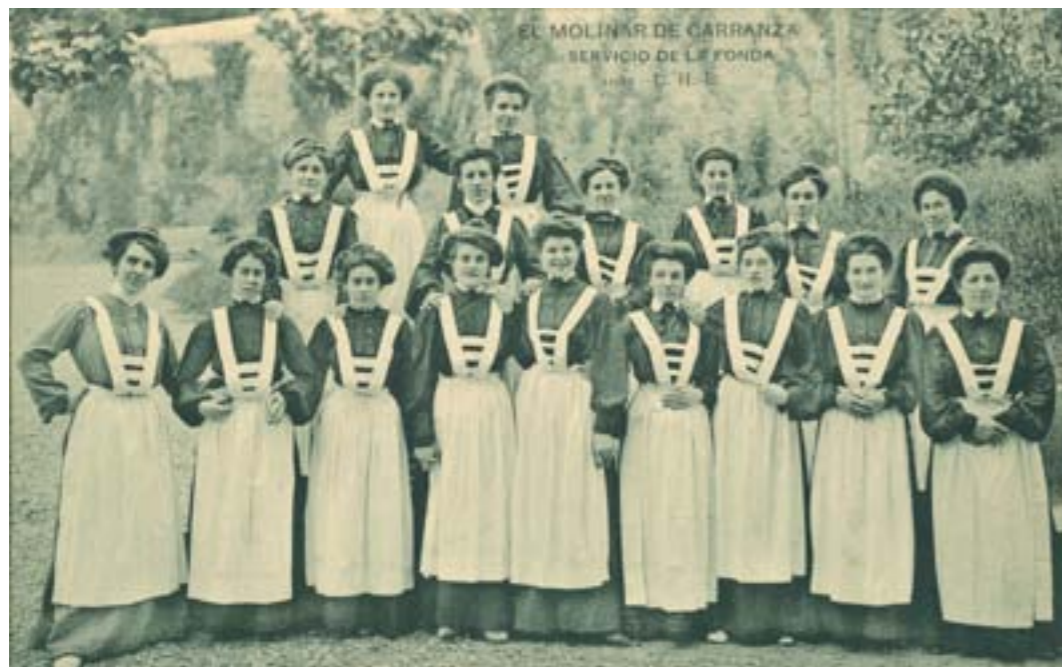
Dj12096. El Molinar de Carranza. Servicio de la fonda. Nº 1085 de la edición de Landáburu Hermanas, Bilbao. Impresión de Hauser y Menet, Madrid. 1905.