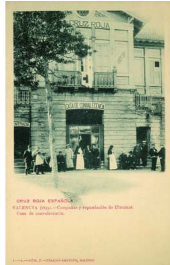
Dj12683. Campañas y repatriación de ultramar. Casa de convalecencia. Cruz Roja Española. Valencia (1899) . I, A, número 7 de la edición de Criado-Sarrión de Madrid. Impresión de Hauser y Menet, Madrid. 1903.