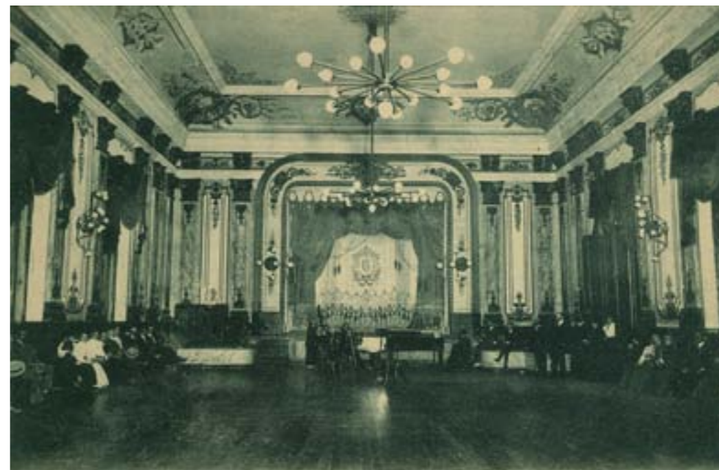
Dj11839. Cestona. Salón de fiestas del Gran Hotel. Edición de Blasa de Querejeta, Guipúzcoa. Impresión de Hauser y Menet, Madrid. 1913.