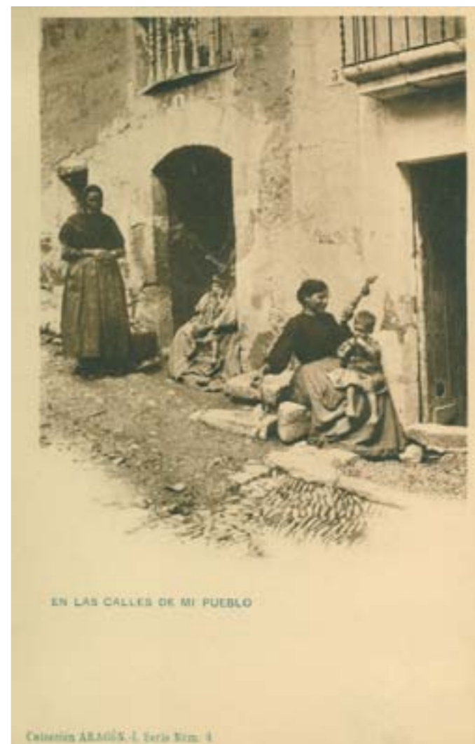
EN LAS CALLES DE MI PUEBLO