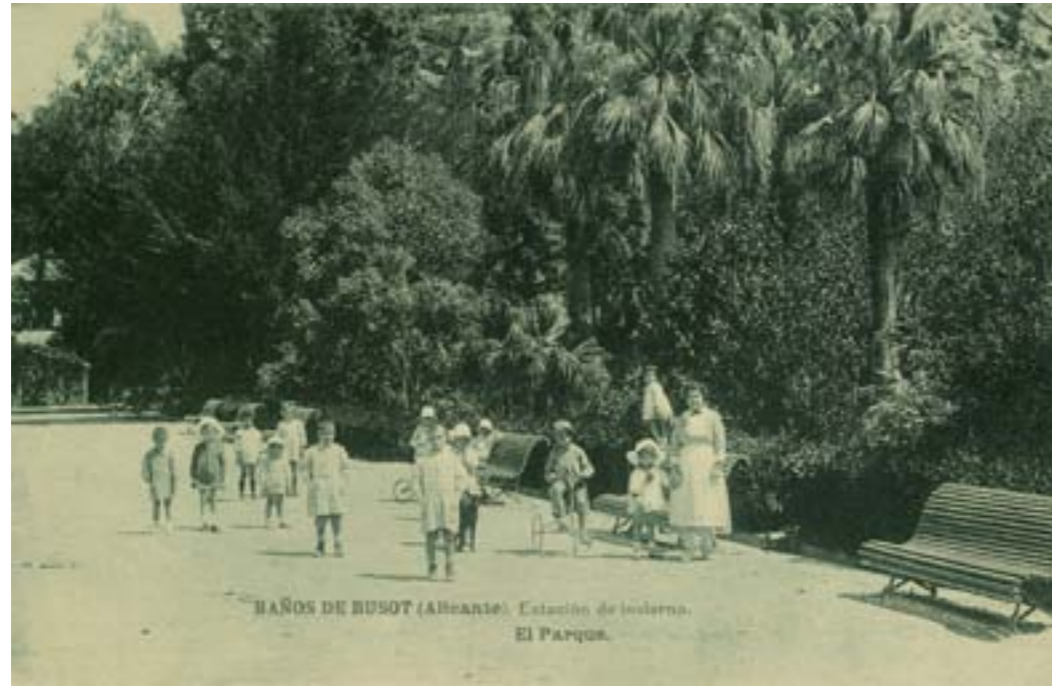
Dj12384. Baños de Bussot (Alicante). Estación de invierno. El parque. Edición del establecimiento. Impresión de Hauser y Menet, Madrid. 1917.