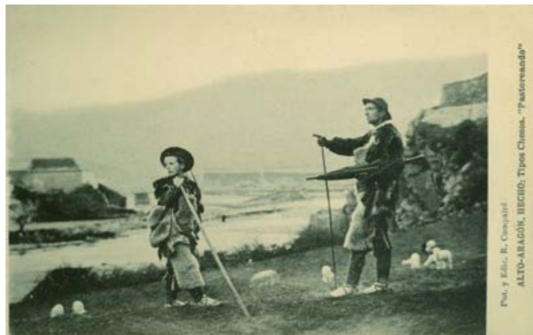
ALTO-ARAGÓN, HECIBO; Tipos Chesos. "Pastoreando"

Dj7958. Hecho (Alto-Aragón): Tipos chesos. «Pastoreando» . Impresión de Hauser y Menet, Madrid. H. 1920.