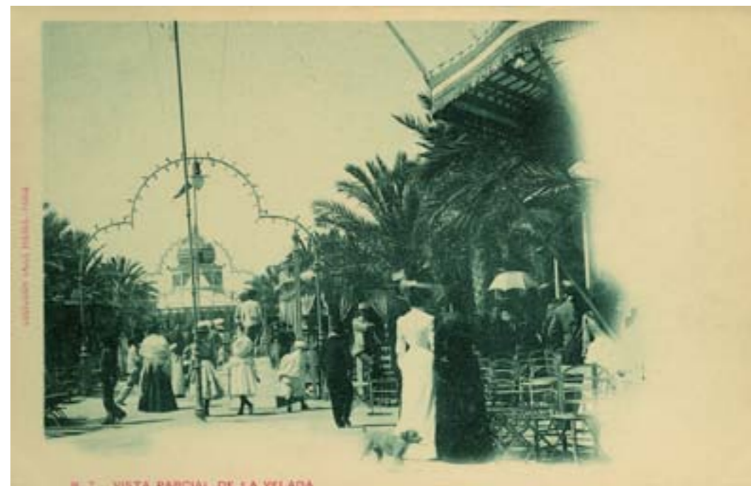
Dj12466. Vista parcial de la Velada. N.º 7 de la Colección Valls Frères, París. 1901.