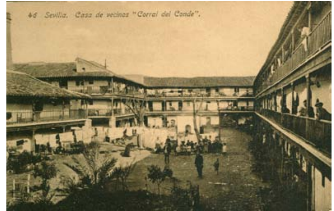
E5034. Sevilla. Casa de vecinos «Corral del Conde» . Nº 46 de la edición e impresión de Abelardo Linares. H. 1910.