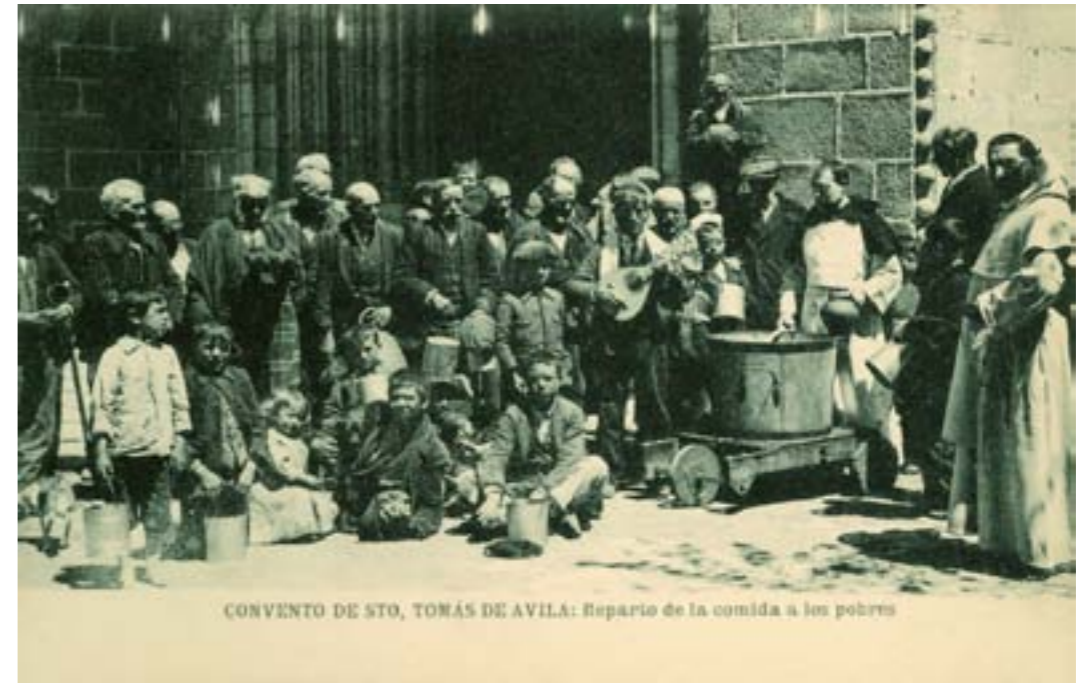
Dj9342. Convento de Santo Tomás de Ávila: Reparto de comida a los pobres . Posible edición del Convento. Impresión de Hauser y Menet, Madrid. 1913.