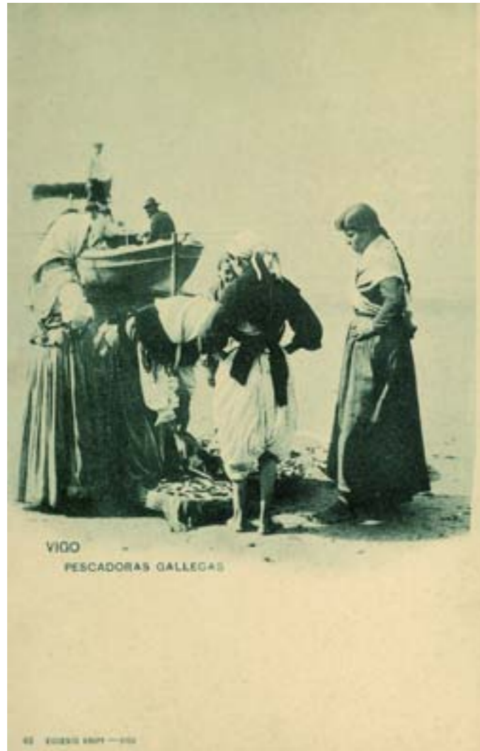
Dj10736. Vigo. Pescadoras gallegas . N° 49 de la edición de Eugenio Krapf, Vigo. Impresión de Hauser y Menet, Madrid. 1900.