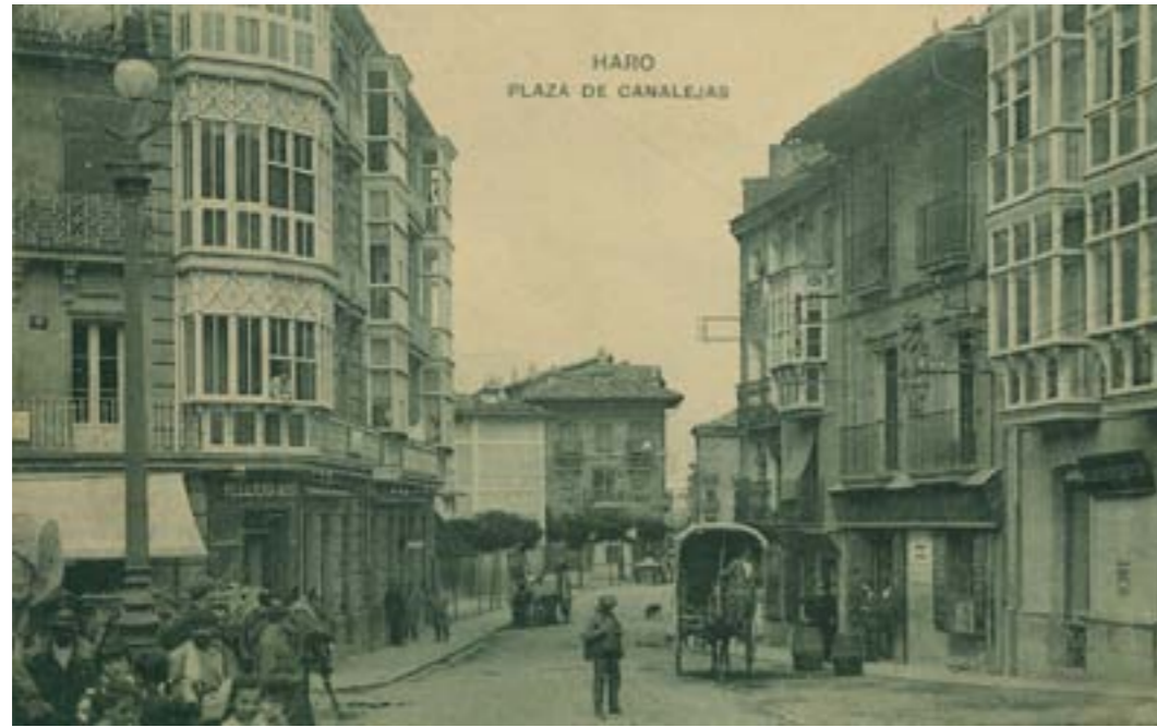
Dj12310. Haro. Plaza de Canalejas . Edición de Imprenta y Librería de Viela e Iturbe, Haro. Impresión de Hauser y Menet, Madrid. 1918.