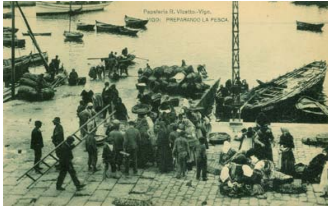
Dj10772. Vigo: Preparando la pesca. Edición de Papelería R. Vicetto, Vigo. Impresión de Hauser y Menet, Madrid. 1918.