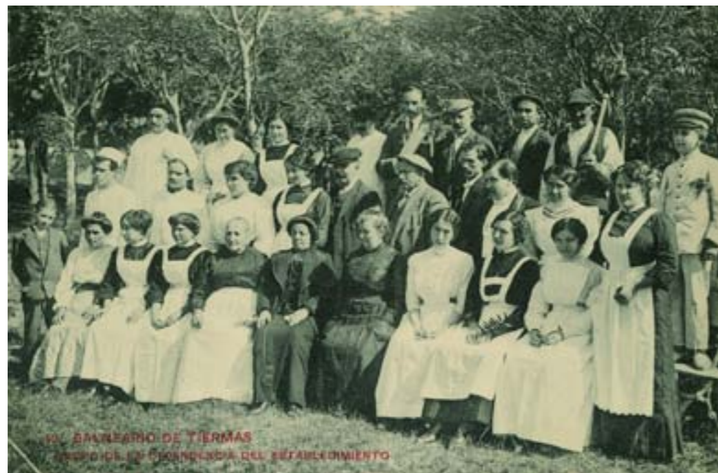
Dj8164. Balneario de Tiermas. Grupo de la dependencia del establecimiento. Nº 40 de la edición de F. H., Jaca. Impresor desconocido. H. 1910.