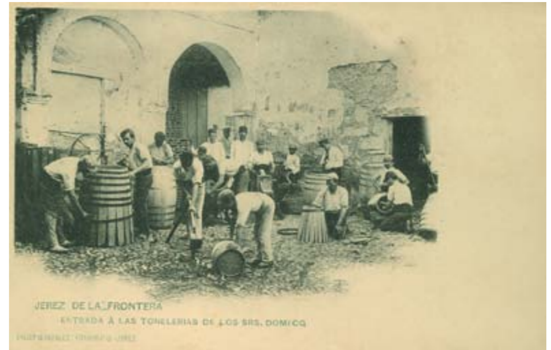
Dj7657. Entrada a las tonelerías del los Sres. Domecq. Impresor desconocido. 1901-1903.