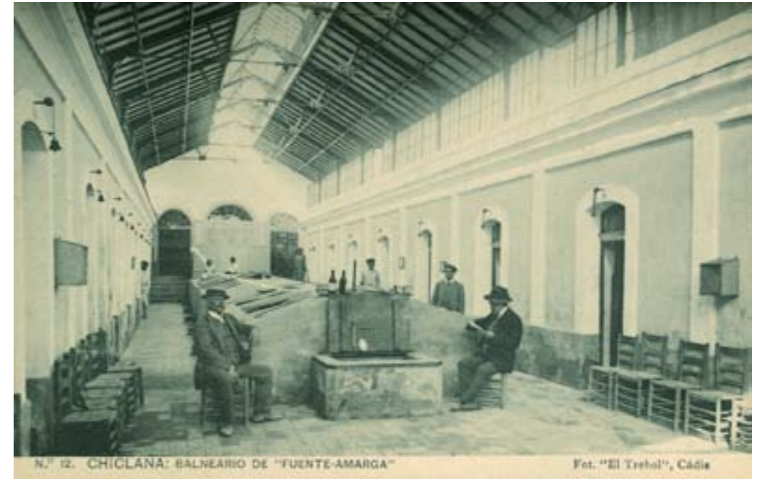
N.º 12. CHICLANA: BALNEARIO DE "FUENTE-AMARGA"

Dj12577. La Salud, Onteniente. Cocina del Gran Hotel . Serie I. Número 8. Edición del Hotel. Impresión de Hauser y Menet, Madrid, 1904.