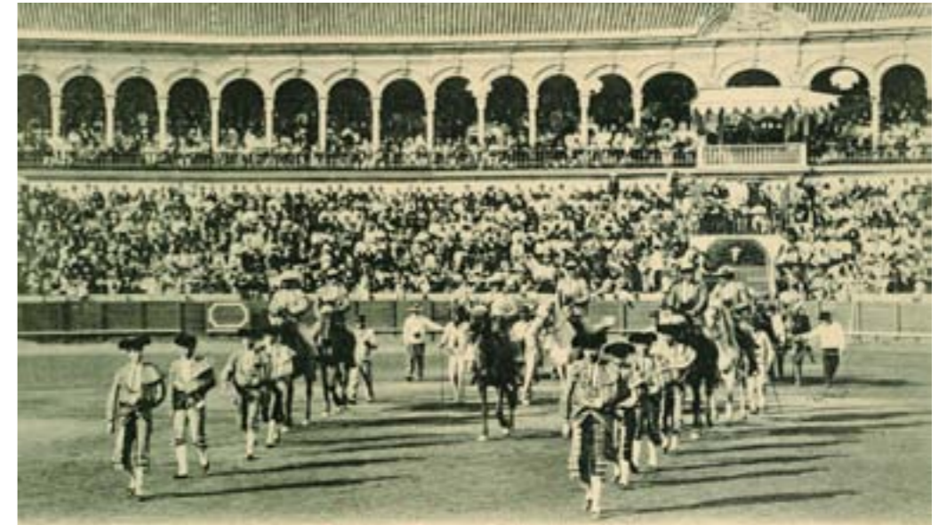
Corrida de Toros - Salida de cuadrilla

Dj11673. La Cuaresma arrebatando al Carnaval. San Sebastián, Carnaval de 1908. Cliché de Miguel Aguirre, San Sebastián. Impresión de Hauser y Menet, Madrid, 1908.