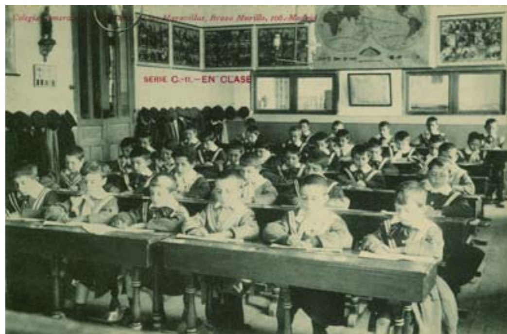
Dj10948. Colegio comercial Ntra. Sra. de las Maravillas , Madrid. Serie C – 11.- En clase . Editado por el colegio. Impresor desconocido. H. 1913.