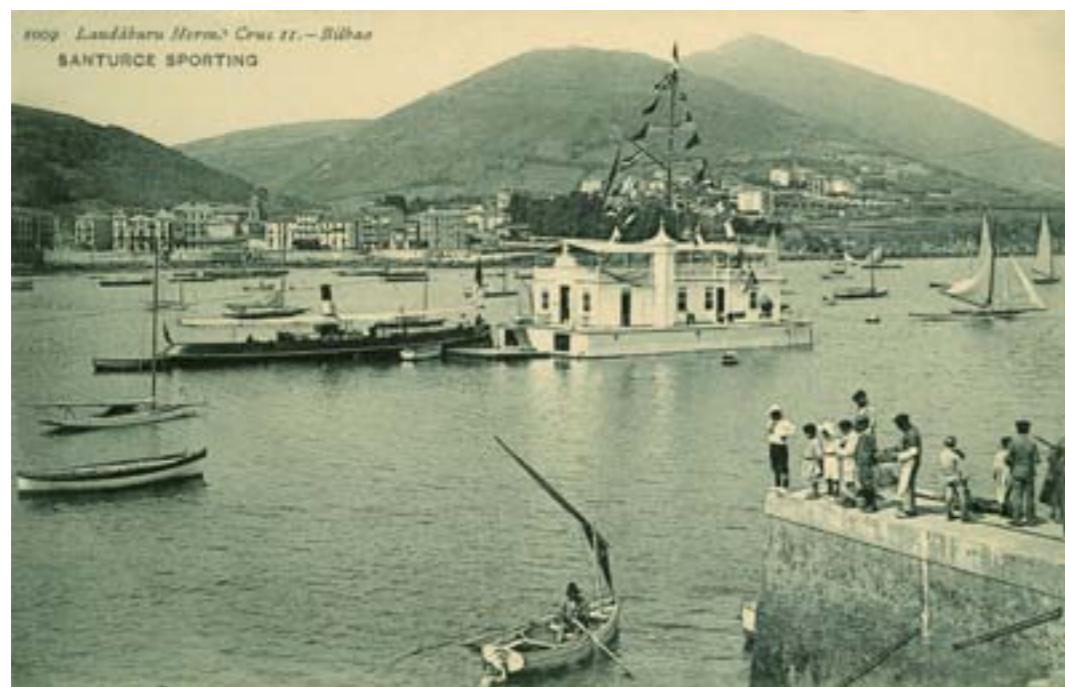
Dj12162. Santurce Sporting . N° 1009 de la edición de Landáburu Hermanas, Bilbao. Impresión de Hauser y Menet, Madrid. 1907.