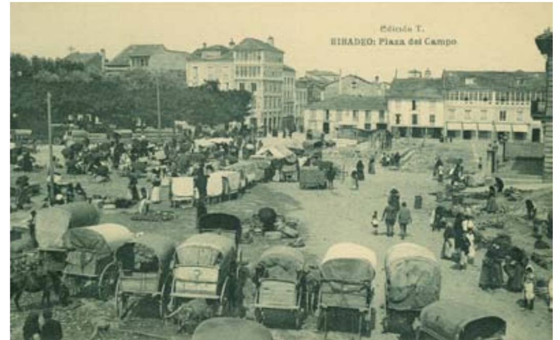
Dj8452. Ribadeo: Plaza del Campo. Edición T. Impresión de Hauser y Menet, Madrid. 1913.