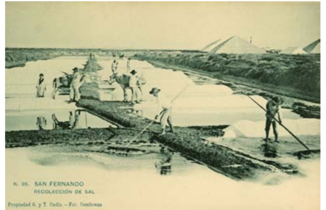
Dj7770. San Fernando. Recolección de sal. N.º 28 de la edición de Giraldi y Torre, Cádiz. Fotografía de Cembrano. Impresión de Hauser y Menet, Madrid. 1904.