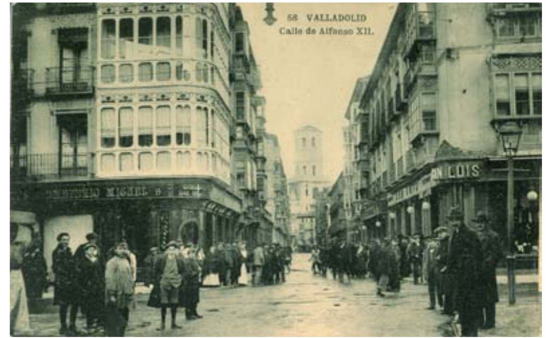
Dj10042. Valladolid. Calle de Alfonso XII. N.º 58 de la edición de L.J., Valladolid. Impresión de Hauser y Menet, Madrid. 1918.