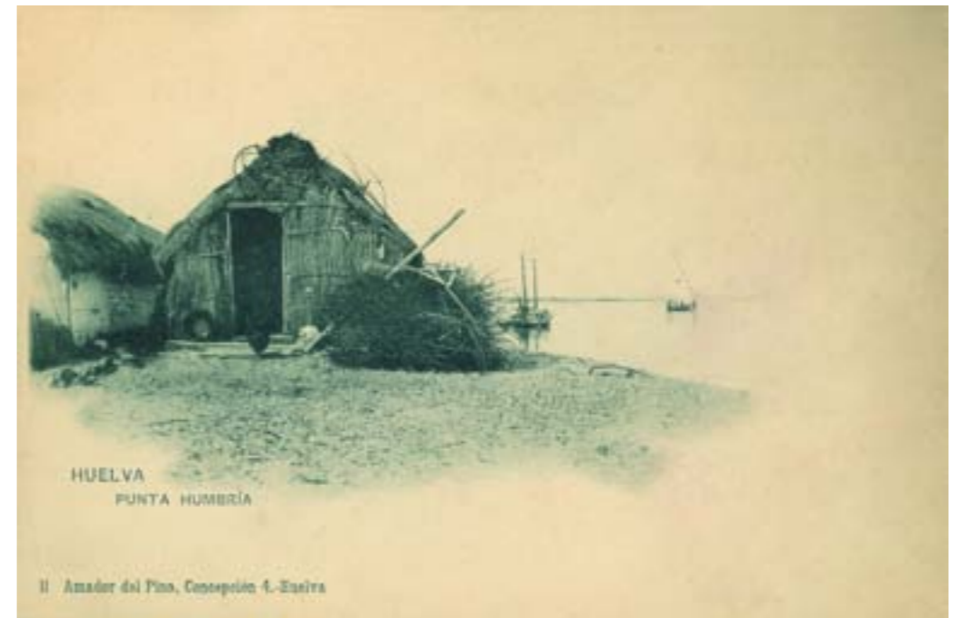
HUELVA PUNTA UMBRÍA