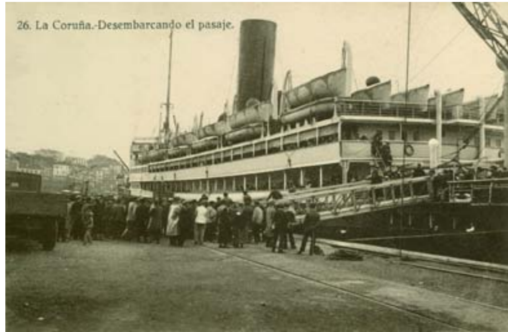
Dj10416. La Coruña. Desembarcando el pasaje. Nº 26 de la edición de Heliotipia de Kallmeyer y Gautier, Madrid. Impresión ídem. H. 1920.