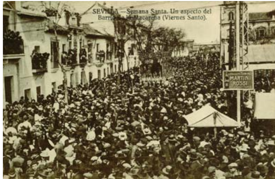
Dj6777. Sevilla-Semana Santa. Un aspecto del barrio de la Macarena (Viernes Santo). Edición de J. B.. Impresor desconocido. H. 1915.