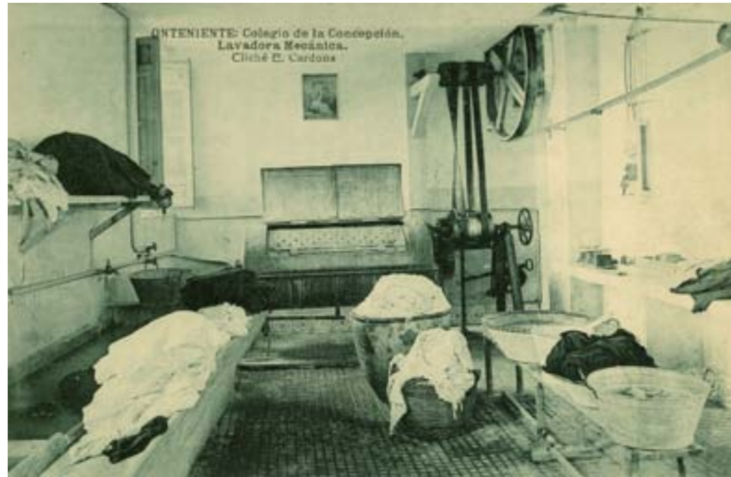
Dj12570. Onteniente: Colegio de la Concepción. Lavadora mecánica. Edición del colegio. Impresión de Hauser y Menet, Madrid, 1918.