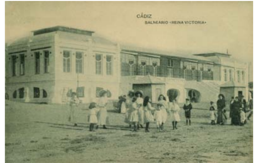
Dj7470. Cádiz. Balneario «Reina Victoria». Edición de Guillermo Uhl. Cádiz. Impresión de Hauser y Menet, Madrid. 1913.