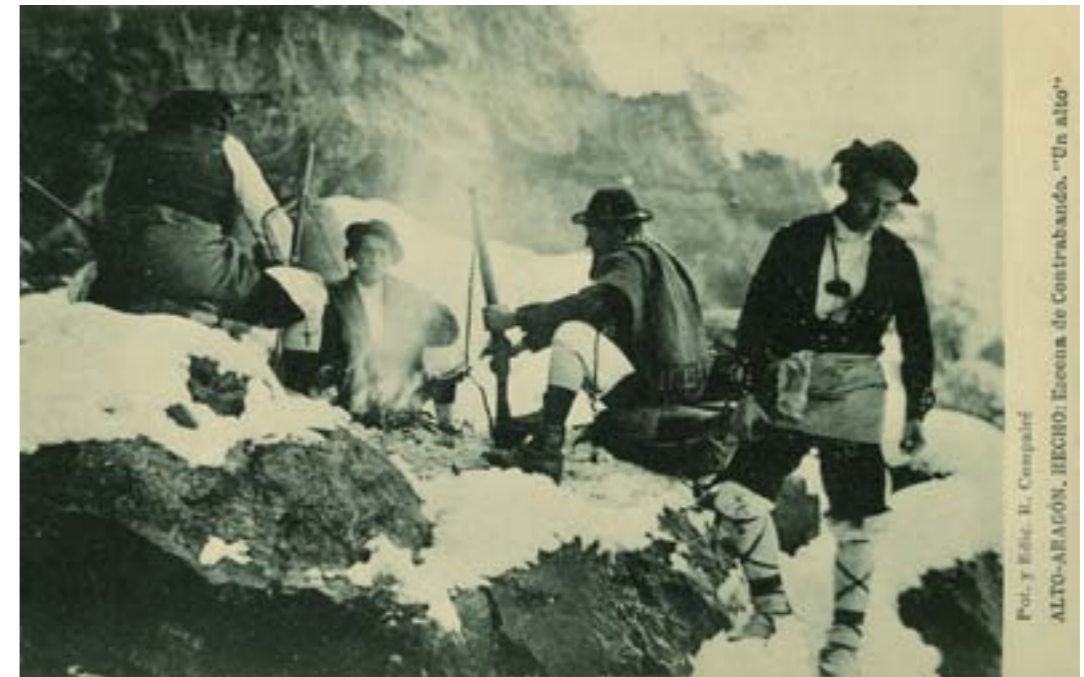
Pub. y Edic. R. Compairé ALTO-ARAGÓN. HECHO: Escena de contrabando. "Un alto"

En las tarjetas postales de esa época encontramos casi una radiografía del país, de cómo fuimos y de como nos quisimos mostrar a los demás. Ninguna temática ni asunto es ajeno a la tarjetografía postal y por ello nos ha resultado difícil elegir unos frente a otros y seleccionar la muestra que ahora les ofrecemos en la que podrán encontrar desde celebraciones públicas a monumentos y edificios singulares, pasando por actividades laborales de todo tipo, indumentaria tradicional, equipamientos domésticos y urbanos o medios de transporte.