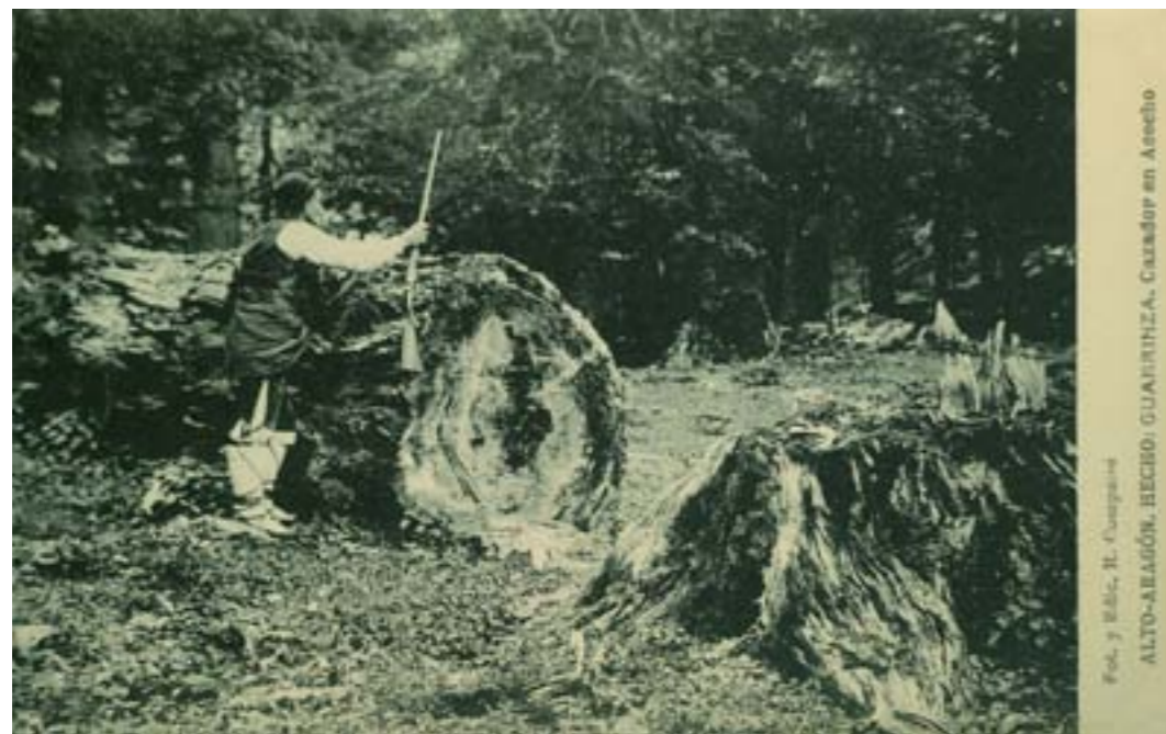
Dj7954. Alto-Aragón. Hecho: Guarrinza . Cazador al acecho . Fotografía y edición de R. Compairé. Impresión de Hauser y Menet, Madrid. H. 1920.