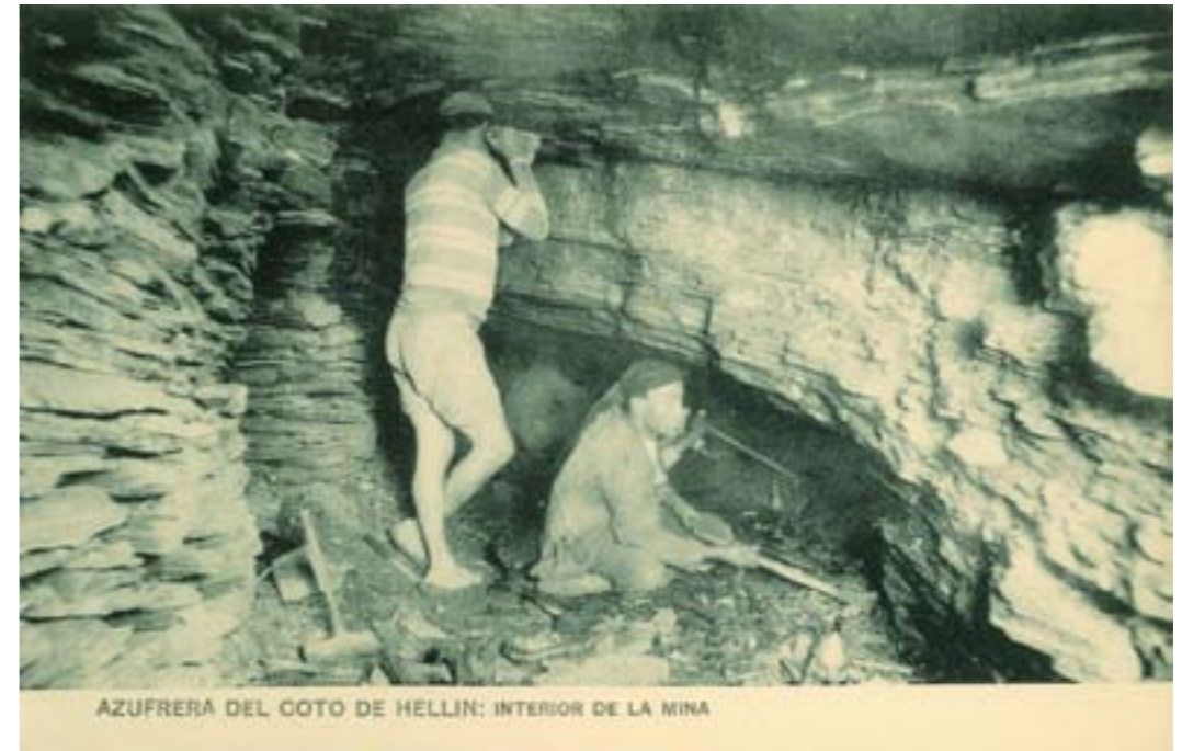
Dj10168. Azufretera del Coto de Hellín: interior de la mina. Edición de la empresa azufretera. Impresor desconocido. H. 1915.