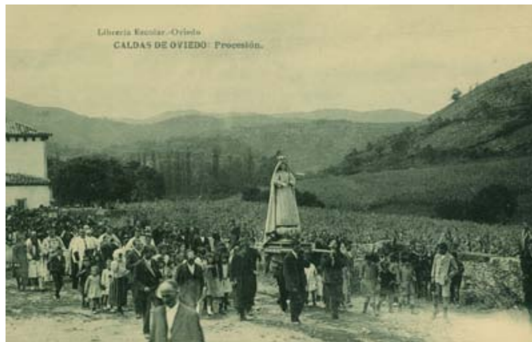
Dj8204. Caldas de Oviedo: Procesión. Edición de la Librería Escolar, Oviedo. Impresión de Hauser y Menet, Madrid. 1913.