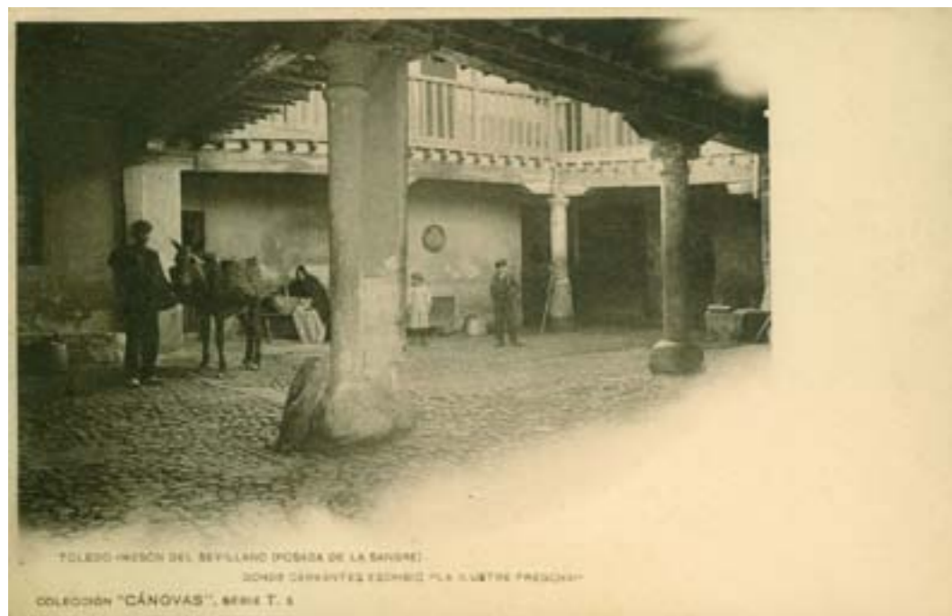
Dj10263. Toledo. Mesón del sevillano (Posada de la sangre) donde Cervantes escribió «La ilustre fregona». Serie T. 5 de la Colección «Cánovas», Impresión de Hauser y Menet, Madrid. 1902.