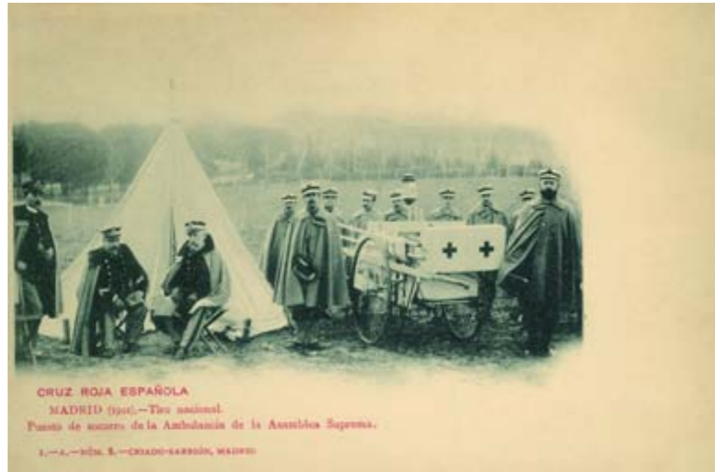
CRUZ ROJA ESPAÑOLA MADRID (1901).—Tiro nacional. Puesto de socorro de la Ambulancia de la Asamblea Suprema. 1.-A.—Núm. 8.