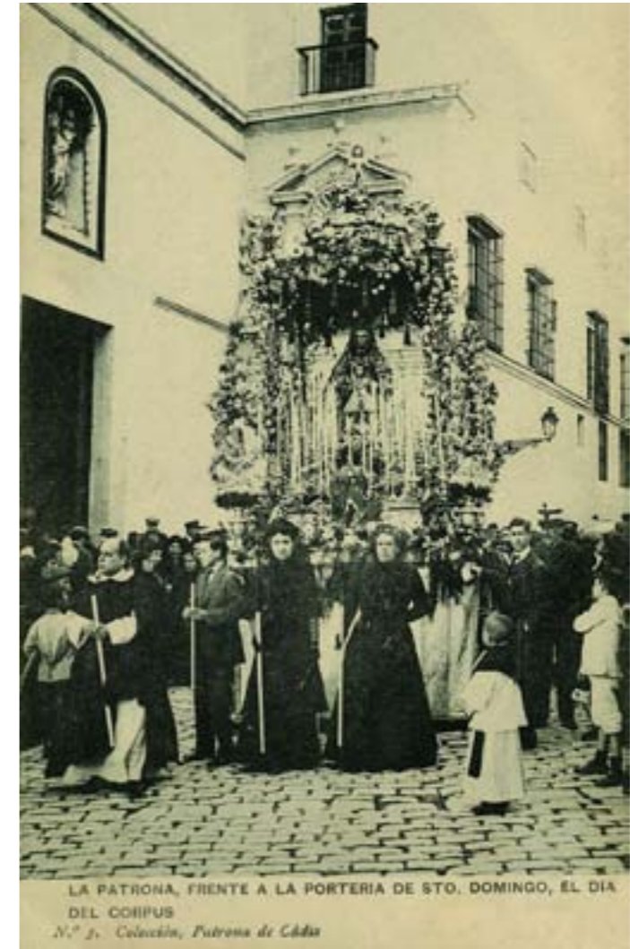
Dj7477. La Patrona, frente a la portería de Santo Domingo, el día del Corpus . Nº 3 de la colección Patrona de Cádiz. Edición e impresión de Hauser y Menet, Madrid. 1912.