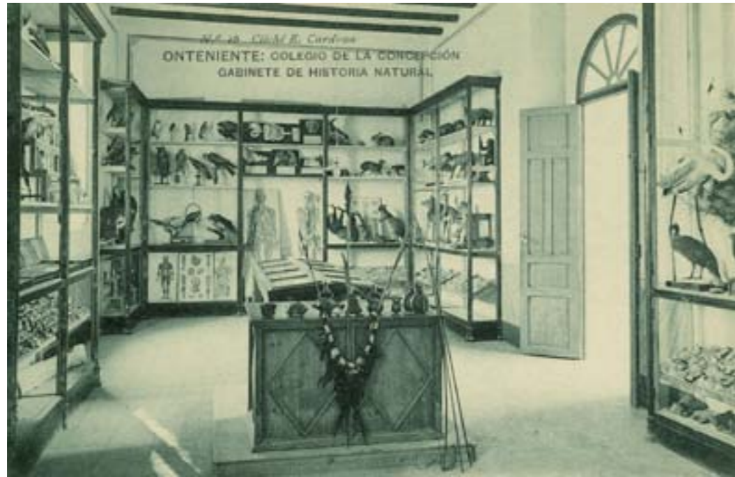
Dj12554. Onteniente: Colegio de la Concepción. Gabinete de Historia Natural. Nº 16 de la edición del colegio. Impresión de Hauser y Menet, Madrid. 1918.