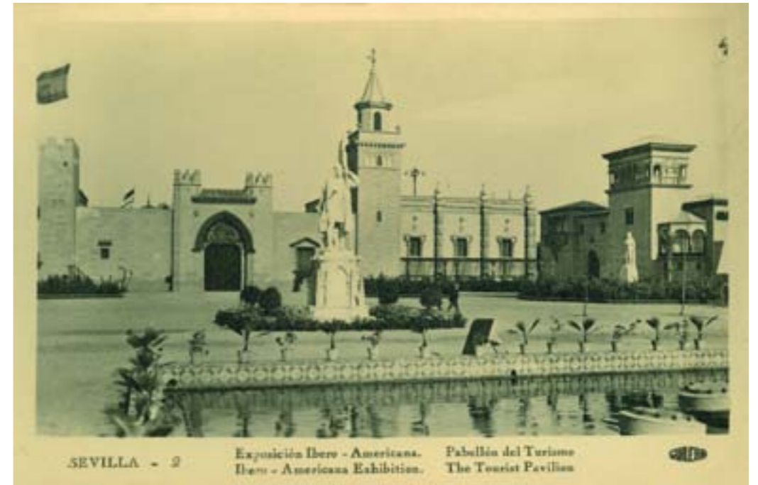
SEVILLA - 2

Dj8654. Mahón: noria . Fotografía de M. de Hernández. N.º 10 de la edición de Remigio Alejandro, Mahón. Impresión de Hauser y Menet, Madrid. 1904.