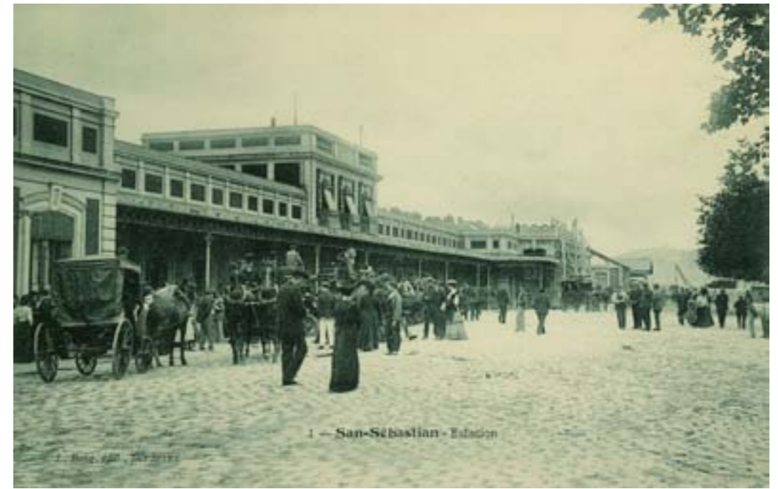
Dj11629. San Sebastián. Estación. Nº 1 de la edición de L. Bosq. Bordeaux (Francia). Impresión del editor. H. 1906.