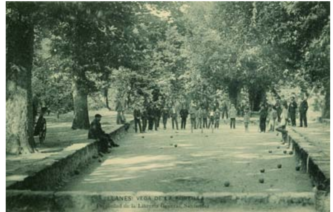
Dj8350. Llanes: Vega de la Portilla. Edición de la Librería General, Santander. Impresión de Hauser y Menet. 1908.