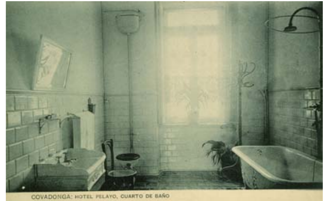
Dj8287. Covadonga: Hotel Pelayo, cuarto de baño. Edición del Hotel. Impresión de Hauser y Menet, Madrid. 1908.