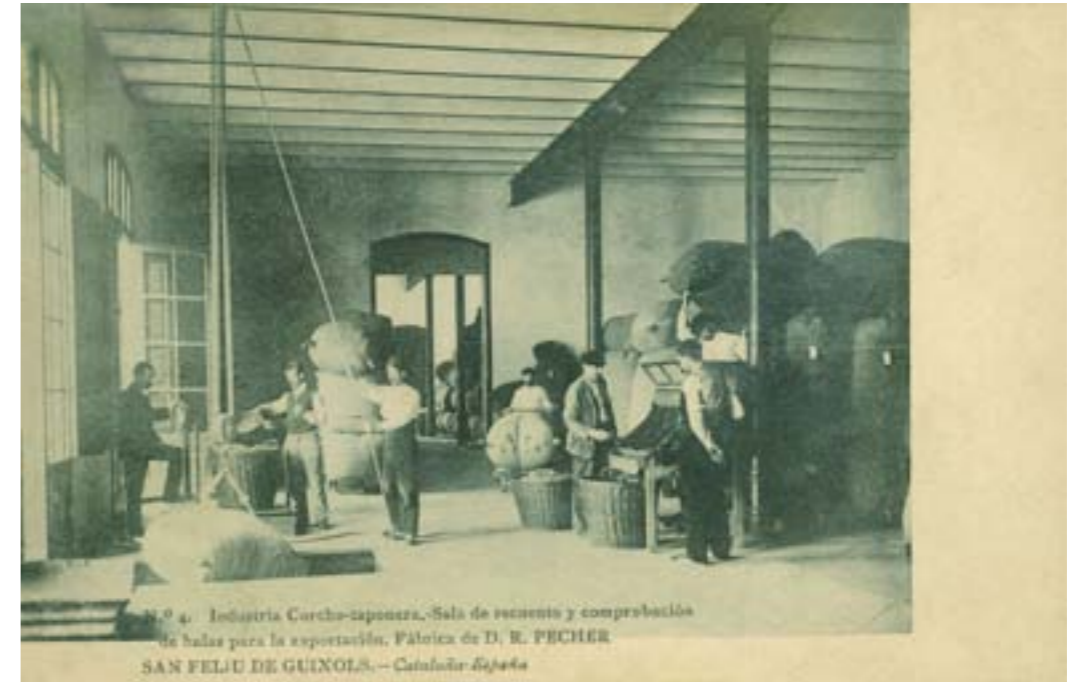
Dj9138. Sala de recuento y comprobación de balas para la exportación. Fábrica de D. R. Pecher. San Feliú de Guixols (Girona). N.º 4 de la edición de la Industria corcho-taponera. Impresión de Hauser y Menet, Madrid. 1906.