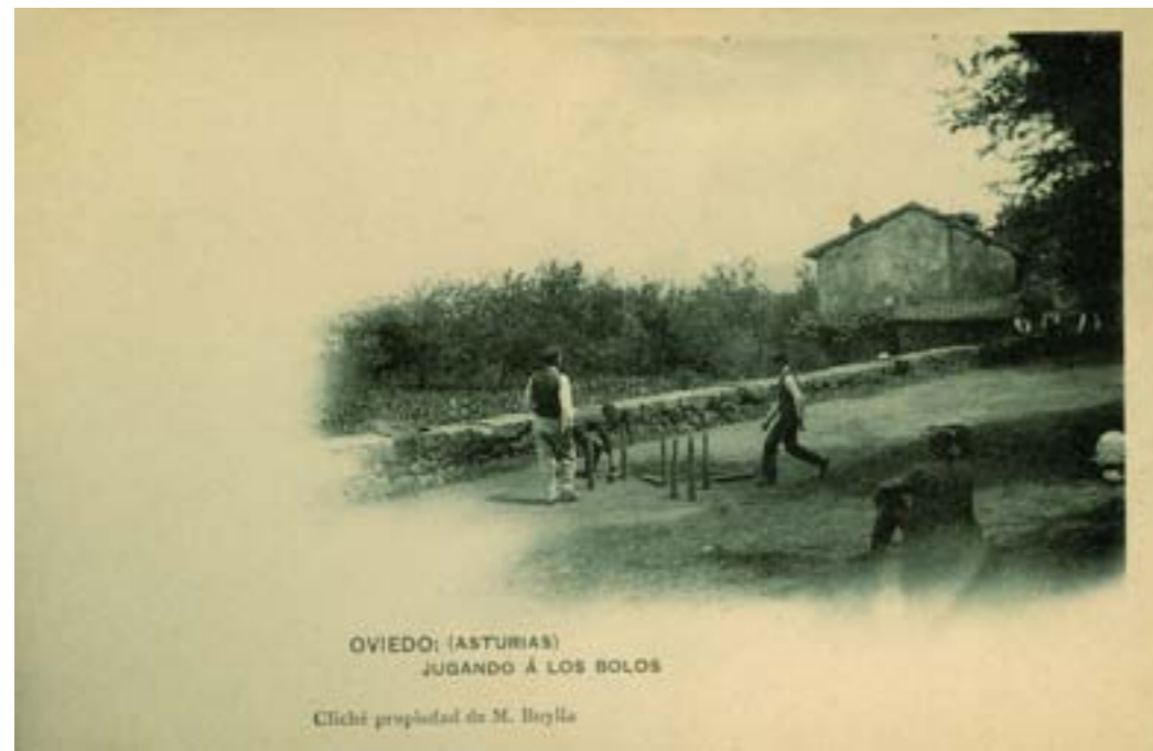
Dj8386. Oviedo (Asturias). Jugando a los bolos. Edición de M. Buylla. Impresión de Hauser y Menet, Madrid. 1908.