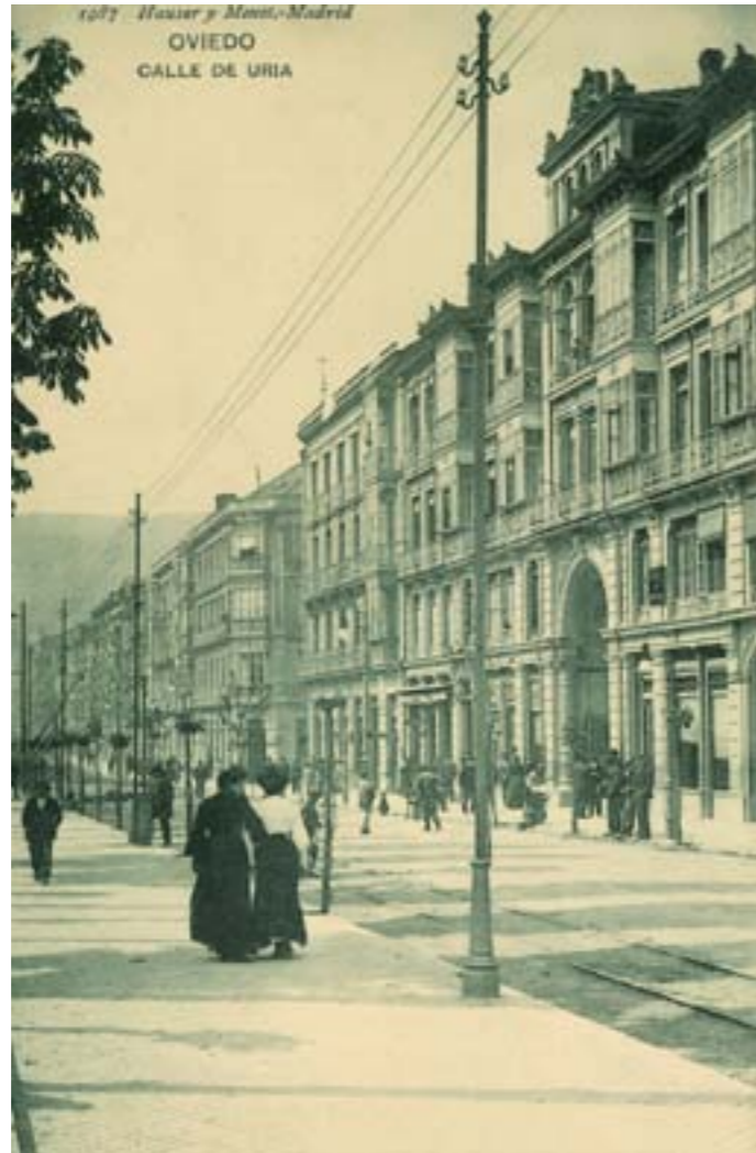
Dj8381. Calle de Uría. Oviedo. Número 1987 de la edición de Hauser y Menet, Madrid. 1912.