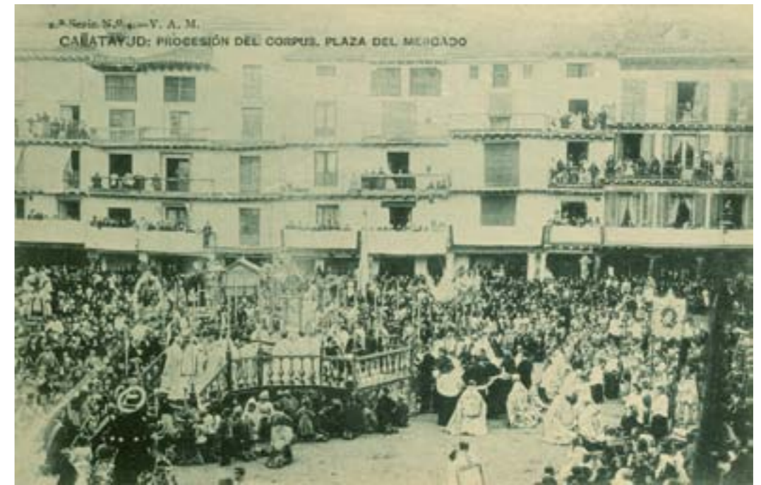
2. A. N. S. V. A. M. CALATAYUD: PROCESIÓN DEL CORPUS. PLAZA DEL MERCADO