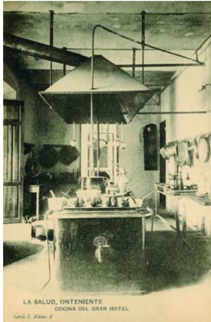
LA SALUD, ONTENIENTE COCINA DEL GRAN HOTEL