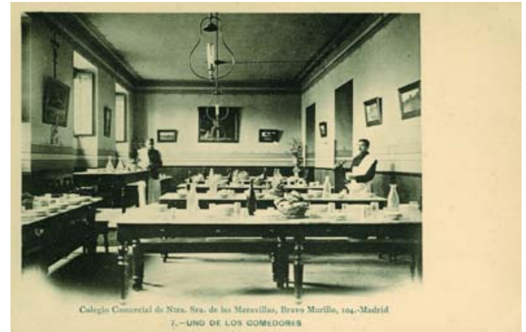
Colegio Comercial de Ntra. Sra. de las Maravillas, Bravo Murillo, 104.-Madrid 7.—UNO DE LOS COMEDORES