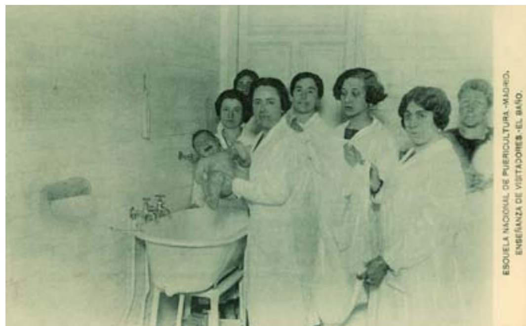
Dj10972. Escuela Nacional de Puericultura.-Madrid. Enseñanza de visitantes.-El baño. Edición de la Escuela. Impresión de Hauser y Menet, Madrid. 1918.