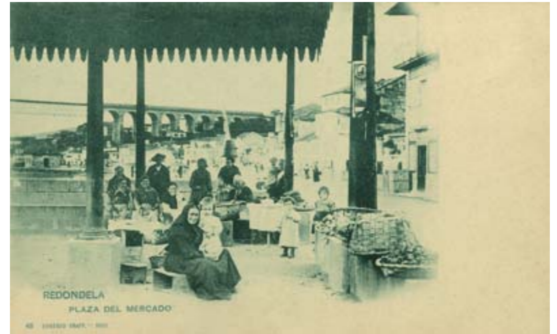
Dj10670. Redondela. Plaza del Mercado. Nº 48 de la edición de Eugenio Krapf, Vigo. Impresión de Hauser y Menet, Madrid. 1900.