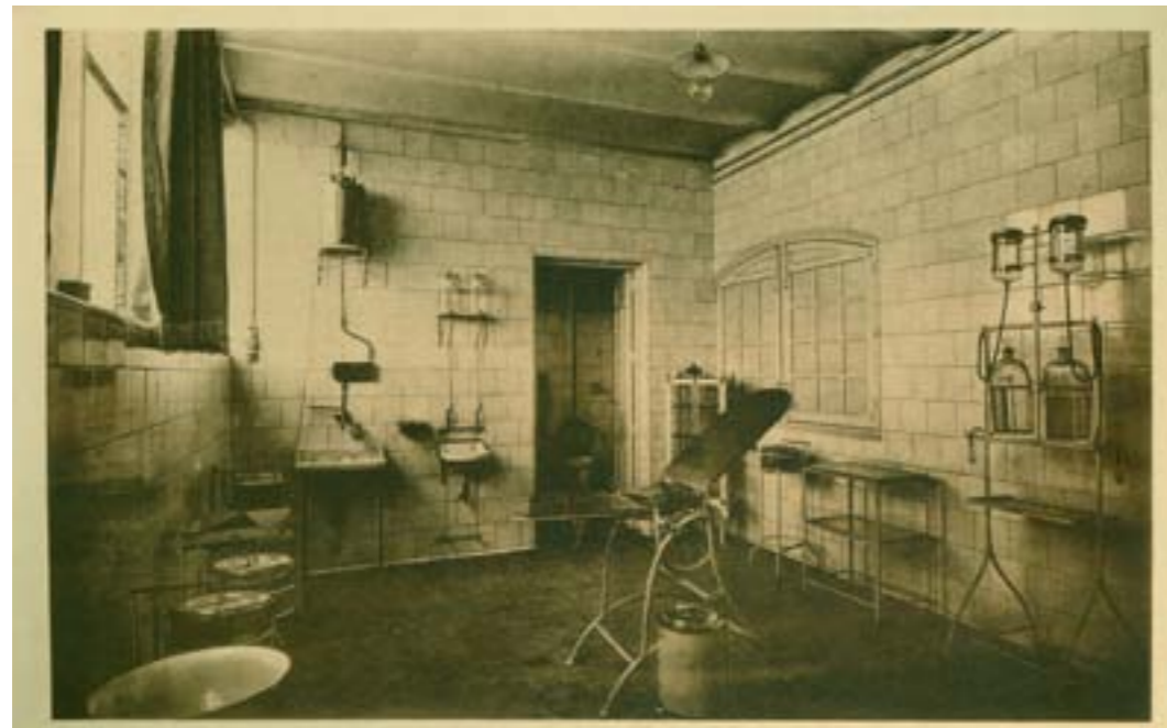
Dj12742. Taller central de Vía y Obras. Servicio Sanitario. Edición de la entidad. Impresión de Hauser y Menet. 1913.