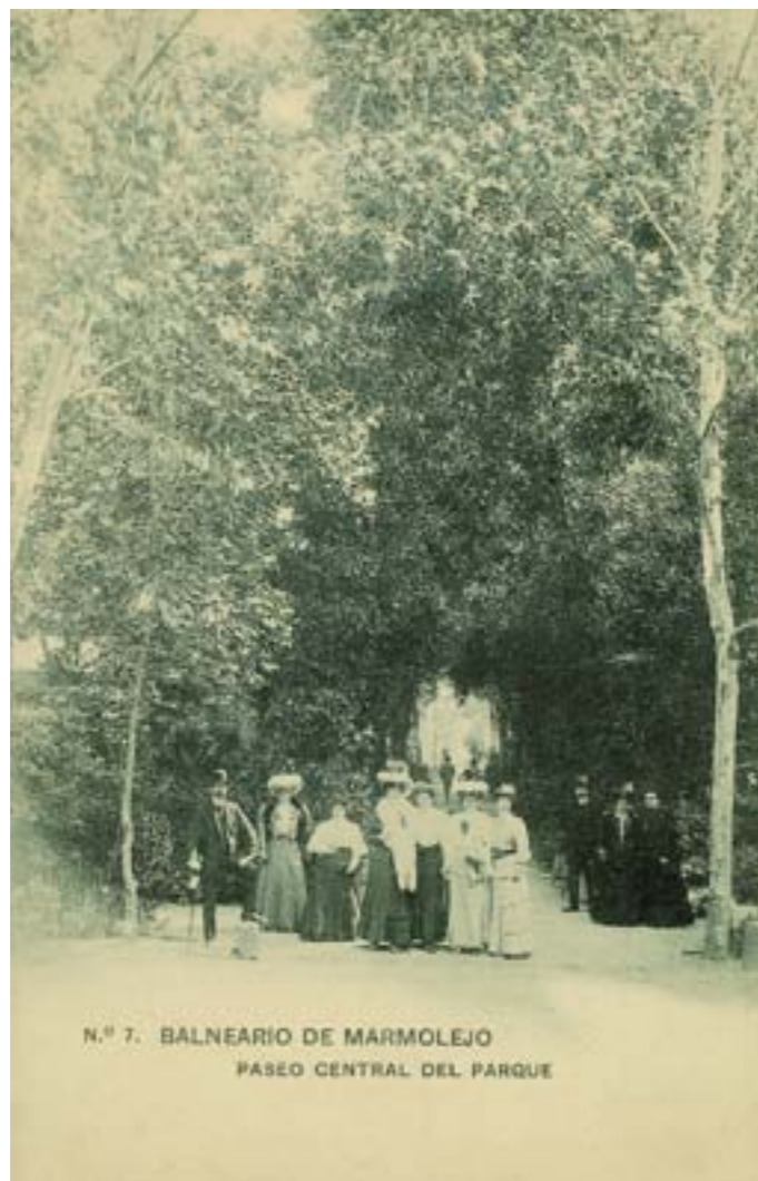
Dj7137. Balneario de Marmolejo. Paseo central del parque. N.º 7 de la edición del Balneario, Jaén. Impresión de Hauser y Menet, Madrid. 1907.