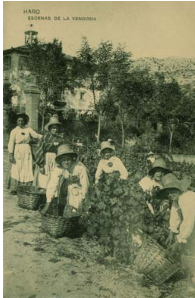
Dj12316. Escenas de la vendimia. Haro (La Rioja) . Editada por la imprenta y librería de Viela e Iturbe en Haro. Impresión de Hauser y Menet, Madrid. 1913.