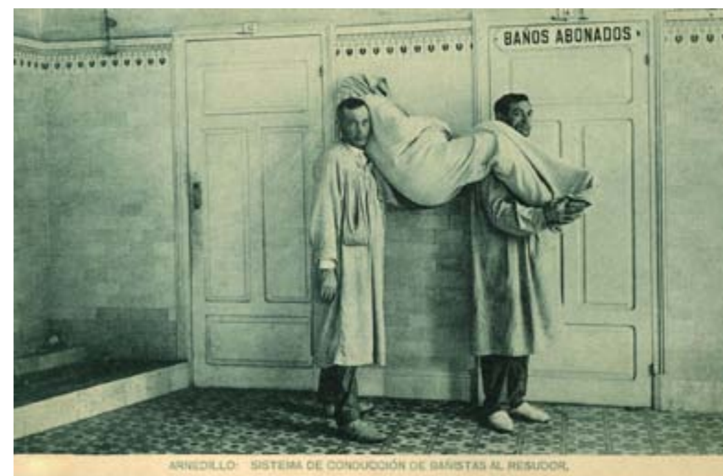
Dj12266. Sistema de conducción de bañistas al resudor. Balneario de Arnedillo. Posiblemente editada por el balneario. Impresión de Hauser y Menet, Madrid. 1913.