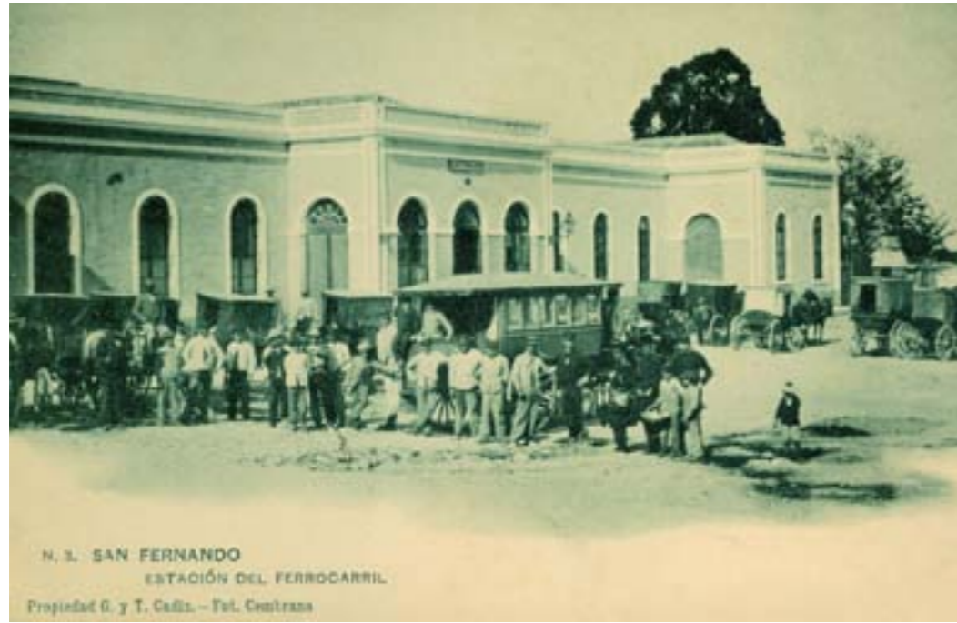
Dj7756. San Fernando. Estación del ferrocarril. Fotografía de Cebrano. Nº 3 de la edición de Giraldi y Torre. Impresión de Hauser y Menet, Madrid. 1902.