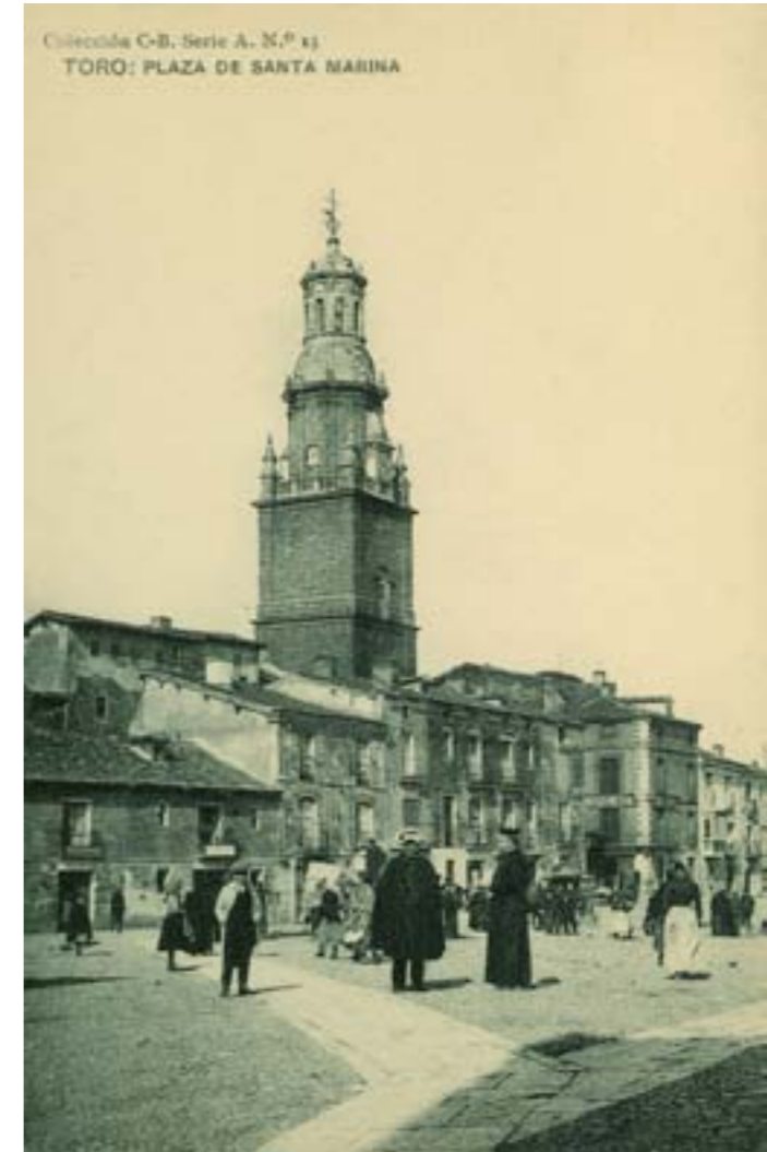
Colección C-B, Serie A, N.º 15 TORO: PLAZA DE SANTA MARINA

Dj8382. Oviedo (Asturias) - Mercado del Progreso . Editor e impresor desconocido. H. 1920.