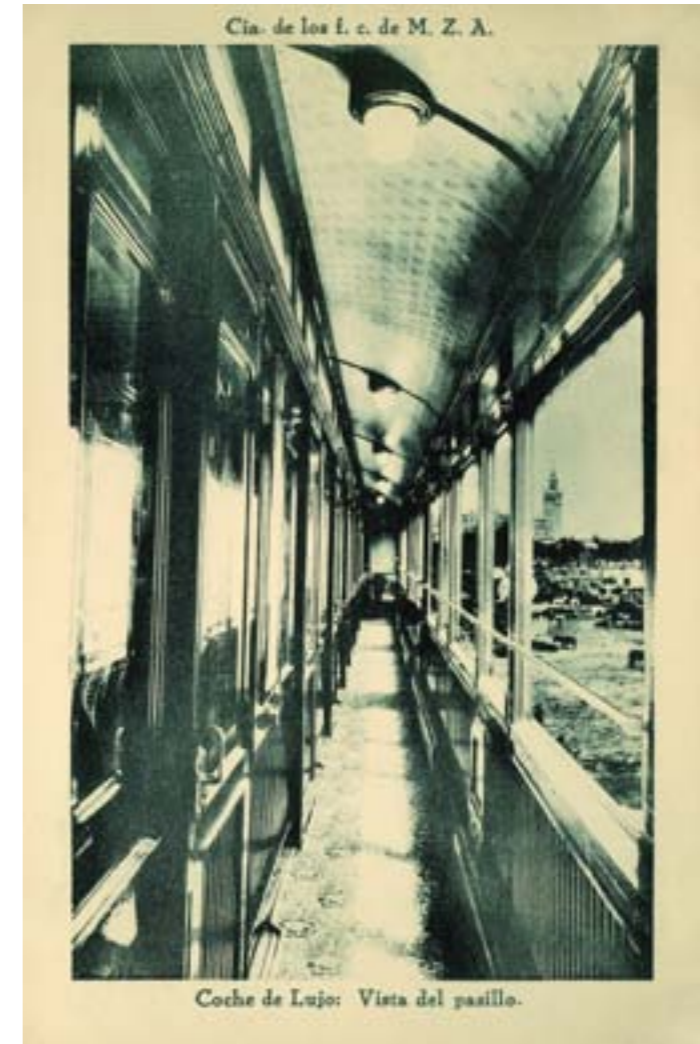
Cia. de los f. c. de M. Z. A. Coche de Lujo: Vista del pasillo.