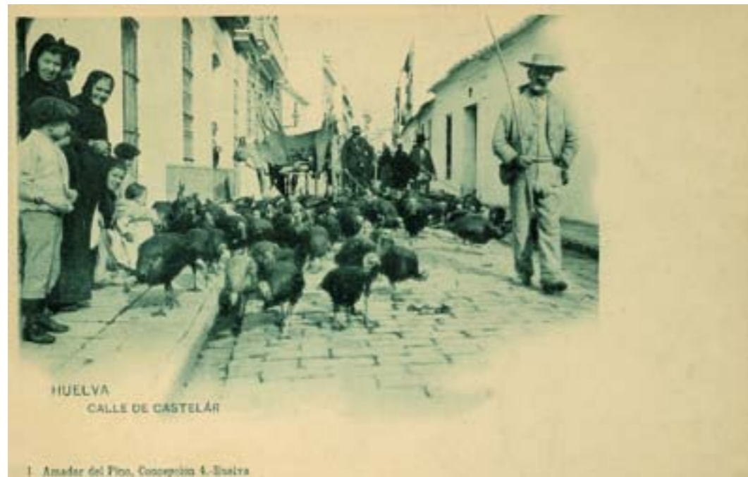
Dj7160. Calle de Castelar. Huelva. Nº 1 de la edición de Amador del Pino, Huelva. Impresión de Hauser y Menet, Madrid. 1901.