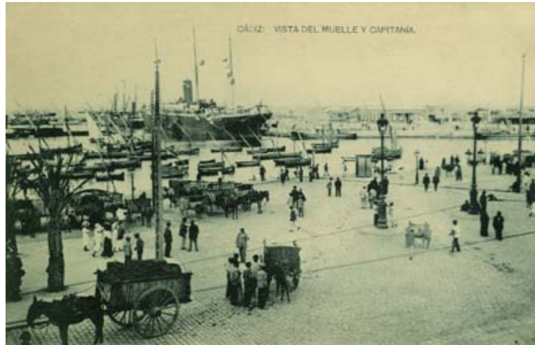
Dj7452. Cádiz: vista del muelle y capitanía. Impresión de Hauser y Menet, Madrid. 1918.