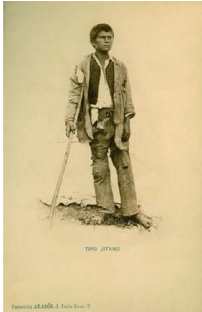
Dj12603. Tipo gitano . Colección Aragón. I. Serie número 9. Edición e impresión de Hauser y Menet, Madrid. 1903.