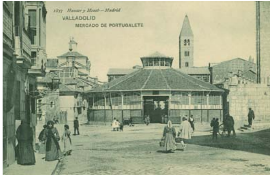
Dj10061. Valladolid. Mercado de Portugaleta . Nº 1837 del catálogo general de H.M. Edición de J. Montero, Valladolid. Impresión de Hauser y Menet, Madrid. 1908.