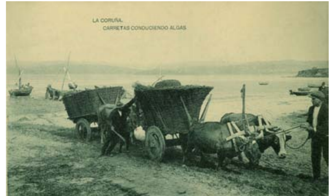
Dj12669. La Coruña. Carretas conduciendo algas. Impresión de Hauser y Menet, Madrid, 1918.