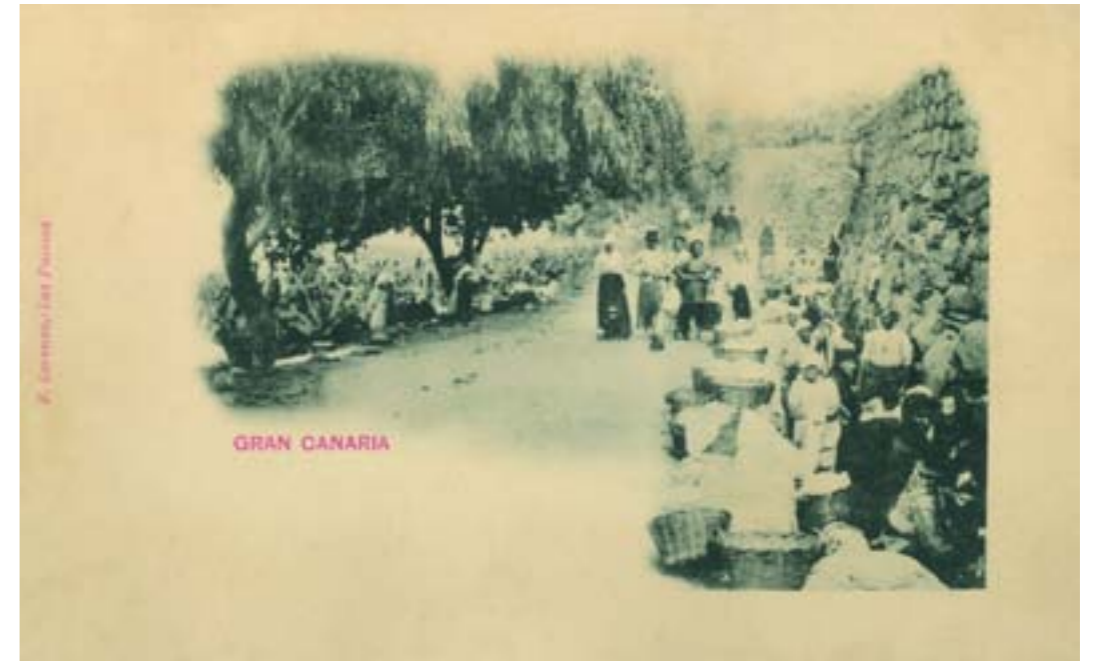
Dj8674. Gran Canaria . Edición de F. Lorenzo (Francisco Lorenzo Quesada), Las Palmas. Impresión Hauser y Menet, Madrid. 1898.