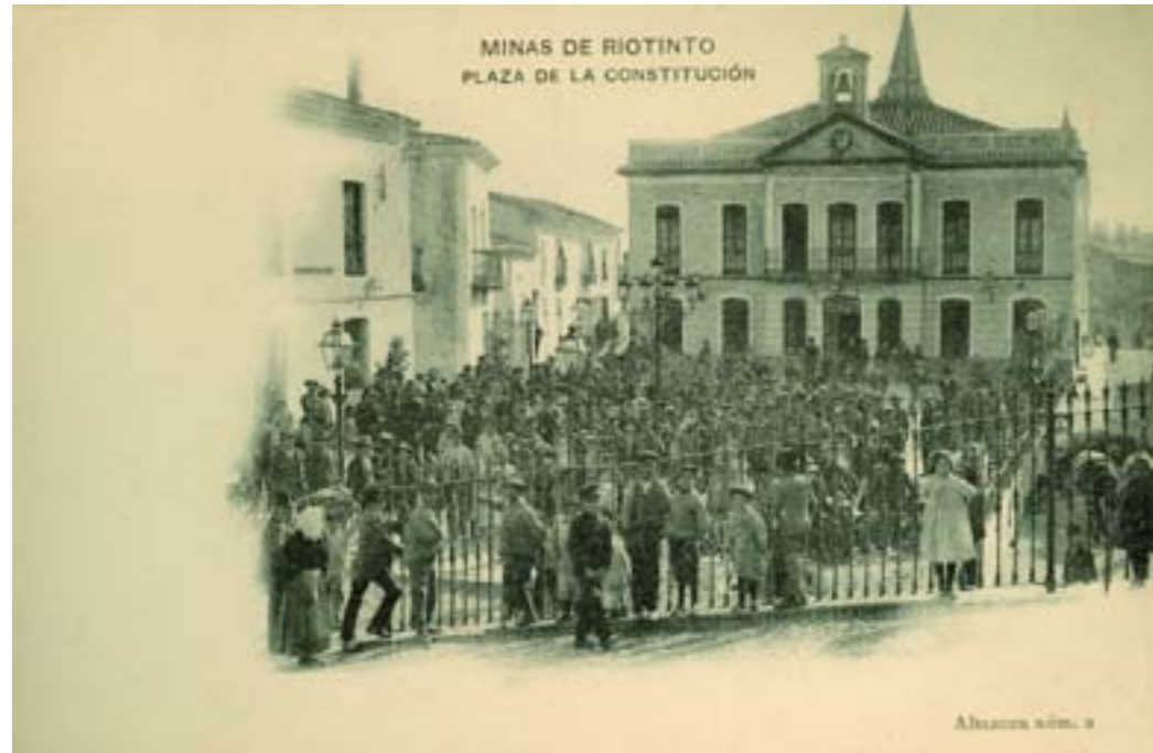
Dj7189. Plaza de la Constitución. Minas de Riotinto (Huelva). Edición de la compañía minera. Impresión de Hauser y Menet. 1905.