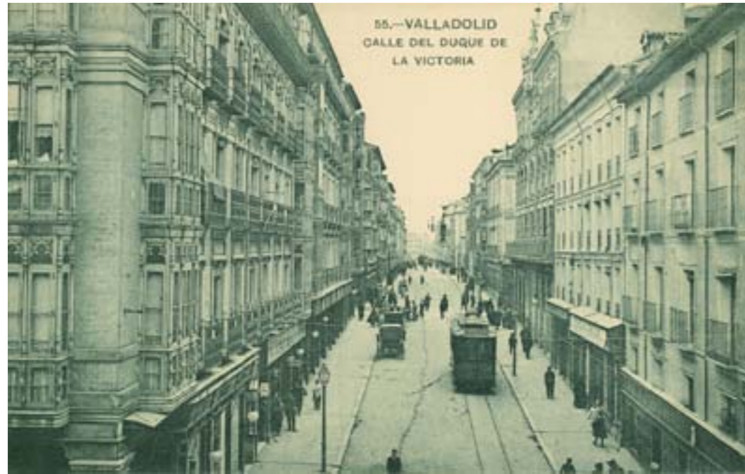
Dj10029. Valladolid. Calle del Duque de la Victoria. Nº 55 de la edición de L. J., Valladolid. Impresión de Hauser y Menet, Madrid. 1918.