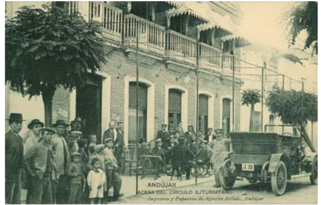
Dj6930. Andújar. Acera del círculo iliturgitano . Edición de la imprenta y papelería de Agustín Bellido, Andujar (Jaén). 1912.