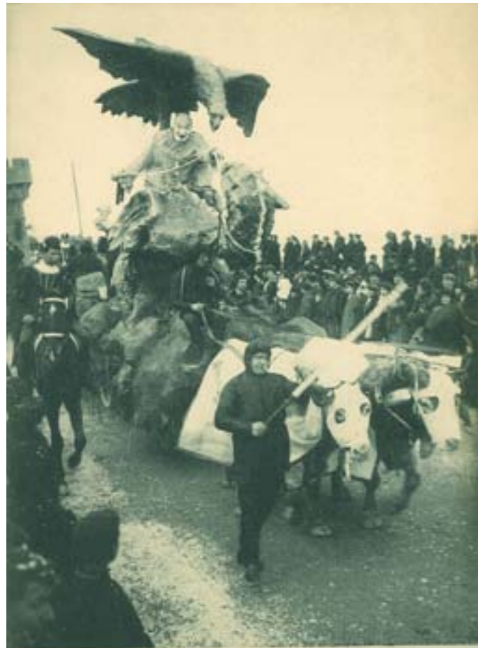
LA CUARESMA ARREBATANDO AL CARNAVAL. SAN SEBASTIÁN, CARNAVAL DE 1908 Cliché de Miguel Aguirre, fotógrafo, Alameda, 11

Dj11673. La Cuaresma arrebatando al Carnaval. San Sebastián, Carnaval de 1908. Cliché de Miguel Aguirre, San Sebastián. Impresión de Hauser y Menet, Madrid, 1908.