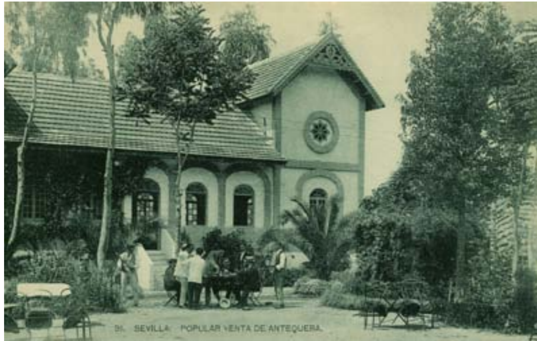
Dj6640. Sevilla: Popular Venta de Antequera . Nº 91 de la edición de M. Barreiro, Sevilla. Impresor desconocido. H. 1910.