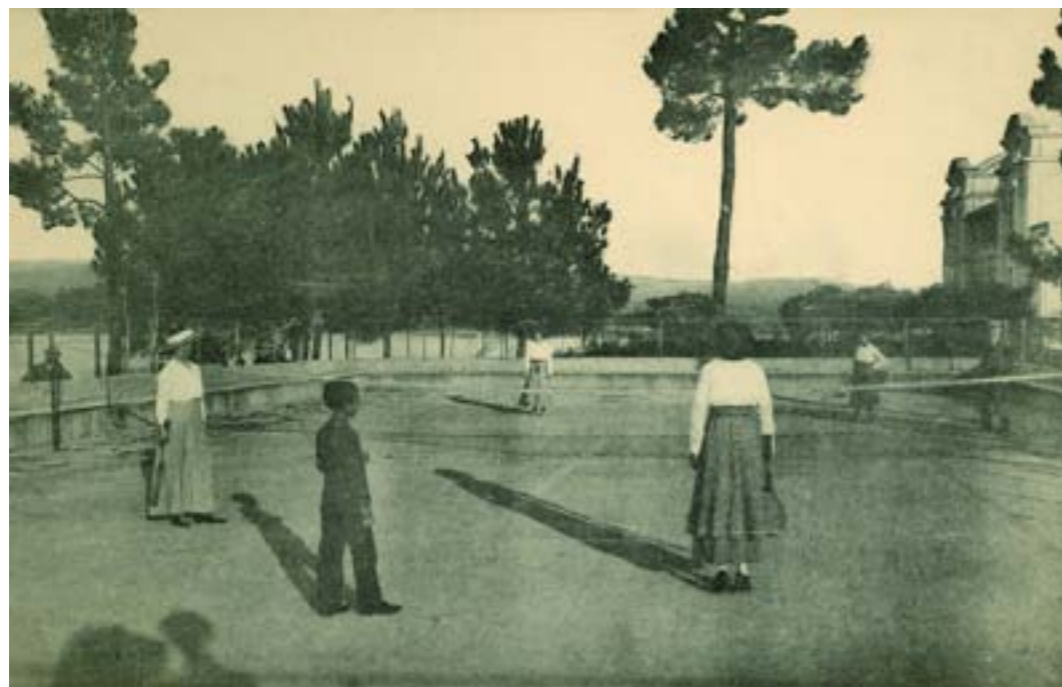
Dj10682. Balneario de la Toja (España). Campo de tenis. Edición e impresión de Eléxpuru y Cejudo, Madrid. H. 1913.