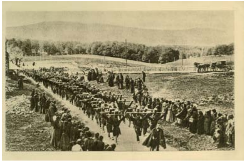
Dj11468. La procesión del Valle del Arce llegando a Roncesvalles . Impresión de Hauser y Menet, Madrid. 1913.