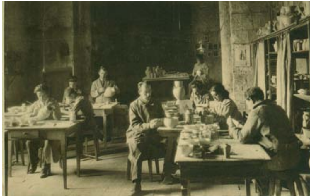
Dj9906. Cerámica artística. Viuda e hijos de Daniel Zuloaga, Segovia. Taller de esmaltación. Edición de la propia empresa. Impresión de Hauser y Menet, Madrid. 1917.