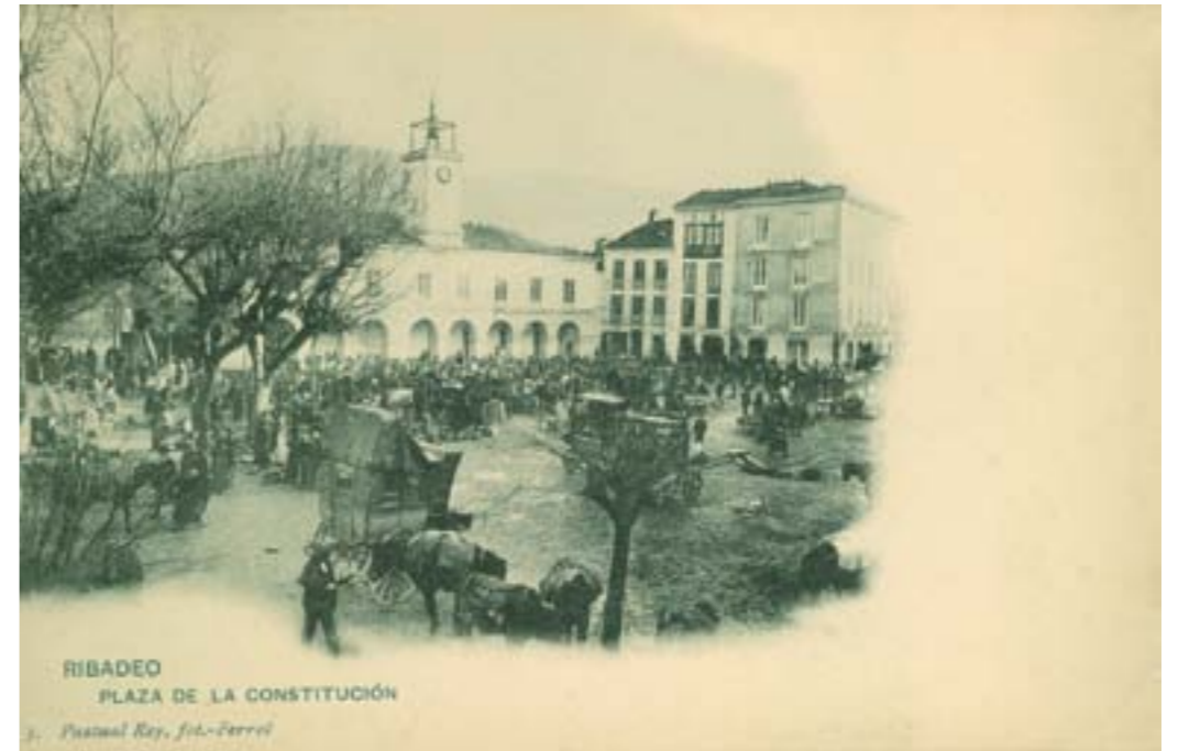
Dj8471. Ribadeo (Lugo), Plaza de la Constitución. Número 3 de la edición de Pascual Rey, fotógrafo, de Ferrol. Impresión de Hauser y Menet, Madrid. 1905.