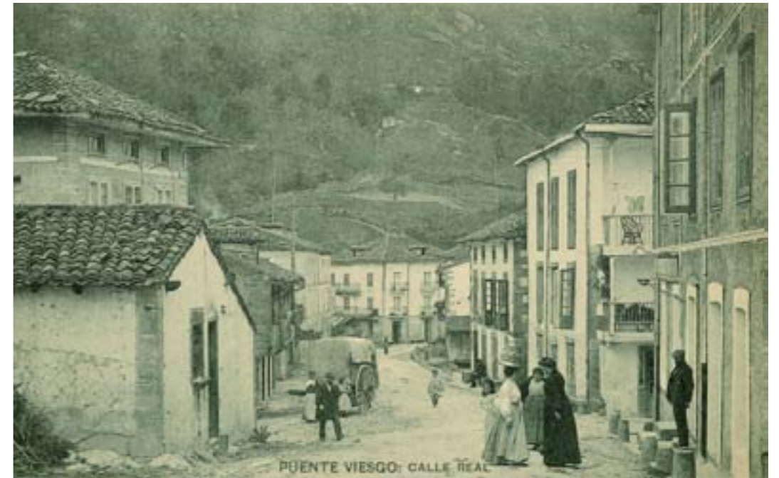
Dj8889. Puente Viego: Calle Real . Edición de Librería General, Santander. Impresión de Hauser y Menet, Madrid. 1906-1907.