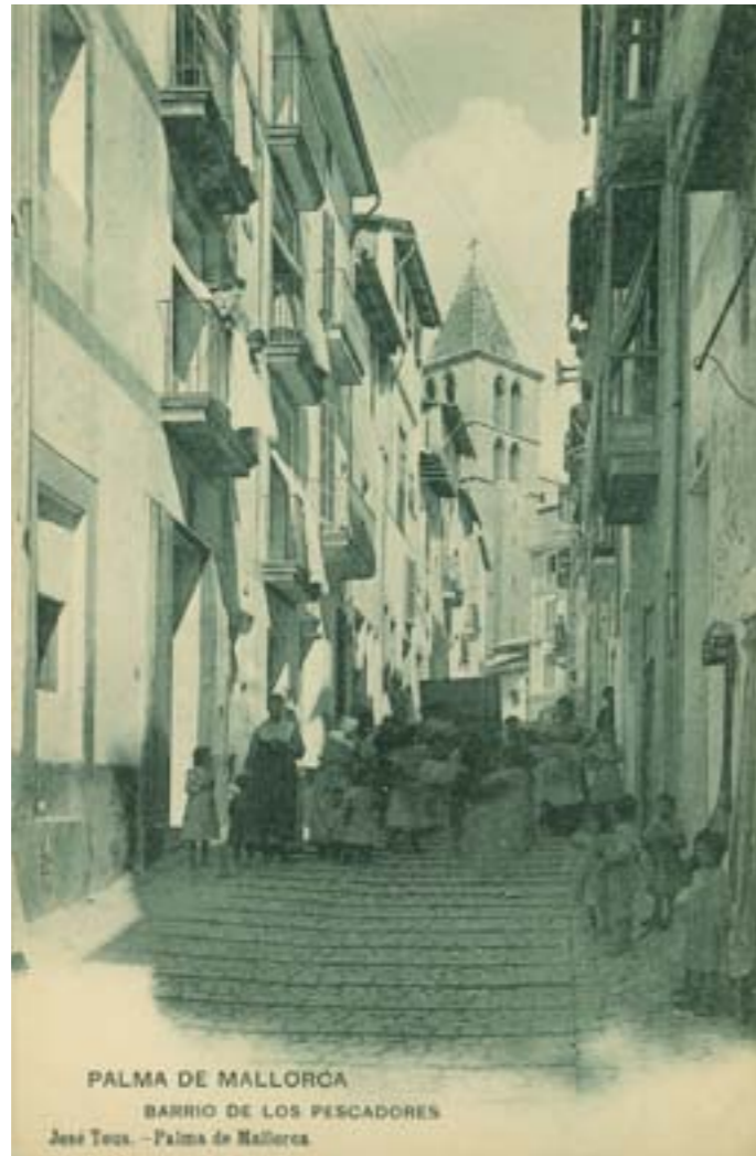
Dj8499. Barrio de los pescadores. Palma de Mallorca. Edición de José Tous, Palma de Mallorca. Posiblemente impresa por Hauser y Menet. 1905.