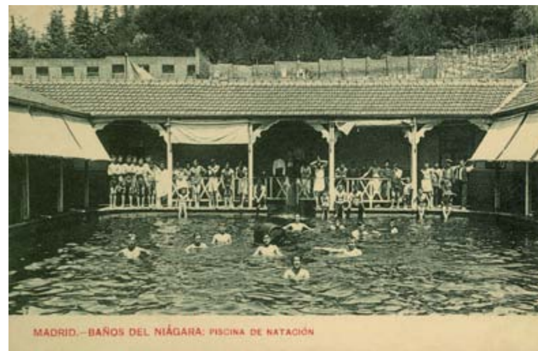
Dj10921. Madrid.-Baños del Niágara. Piscina de natación . Edición del establecimiento. Impresor desconocido. 1923.