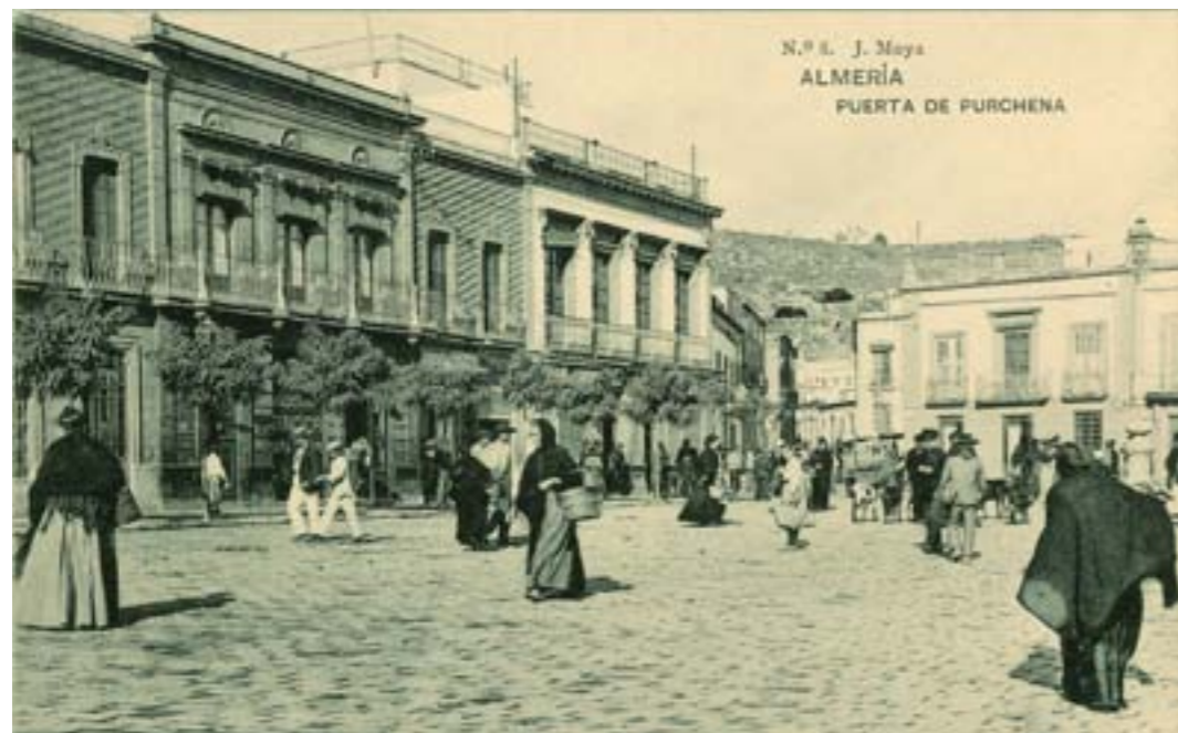
Dj7103. Almería. Puerta de Purchena. N.º 8 de la edición de J. Moya. Impresión de Hauser y Menet, Madrid. 1908.