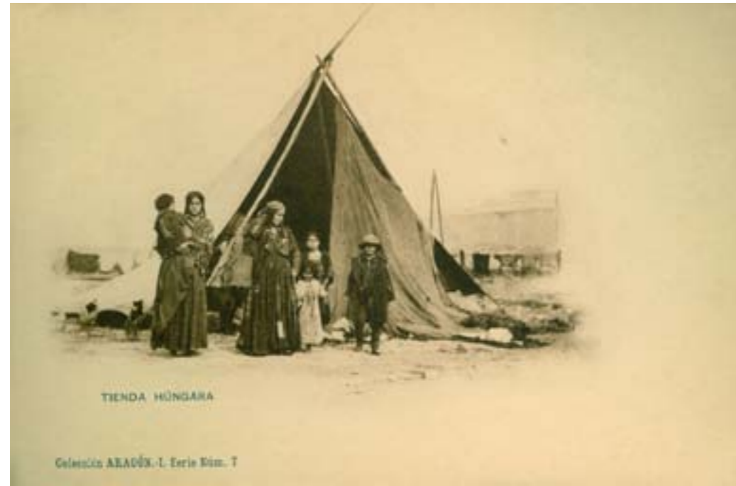
Dj12601. Tienda húngara . Colección Aragón. I. Serie Número 7. Edición e impresión de Hauser y Menet, Madrid. 1903.