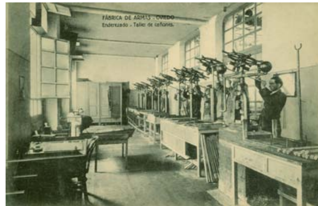
FÁBRICA DE ARMAS - OVIEDO Enderezado - Taller de cañones.