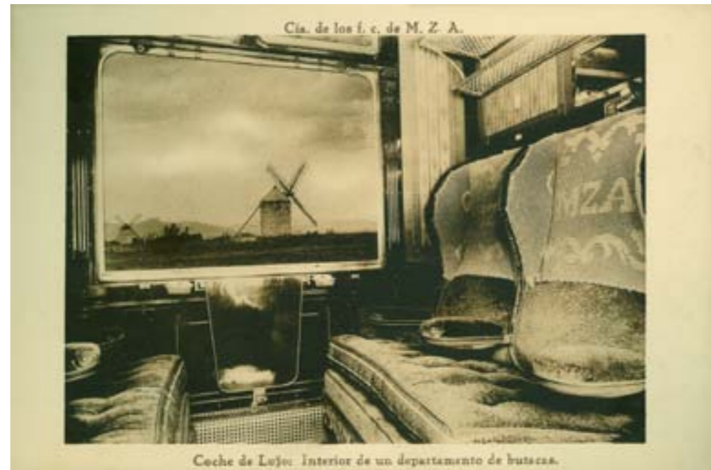
Dj12755. Coche de lujo: Interior de un departamento de butacas. Edición de la Compañía de los Ferrocarriles de M.Z.A. (Madrid, Zaragoza, Alicante). Impresión de Hauser y Menet. 1913.