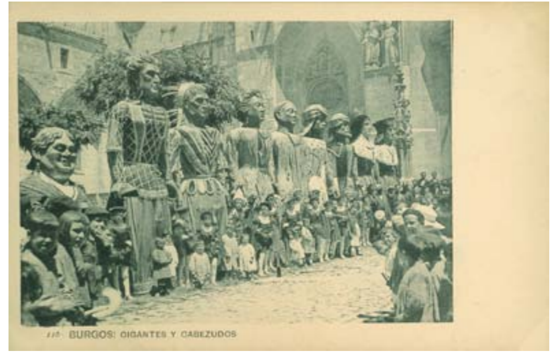
116. BURGOS: GIGANTES Y CABEZUDOS