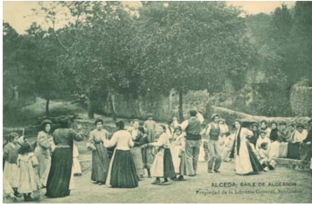
Dj8801. Alceda: Baile de aldeanos . Edición de Librería General, Santander. Impresión de Hauser y Menet, Madrid. 1904.