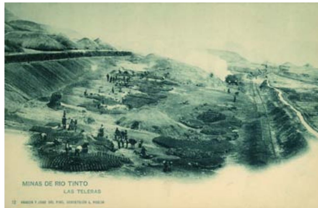
Dj7175. Minas de Riotinto . Las teleras . Nº 12 de la edición de Amador y Juan del Pino, Huelva. Impresión de Hauser y Menet, Madrid. 1901.