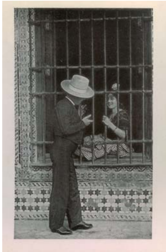
Dj6798. Sevilla. En la reja. Nº 10 de la edición de M. Barreiro. Impresión del editor. Sevilla. H. 1929.