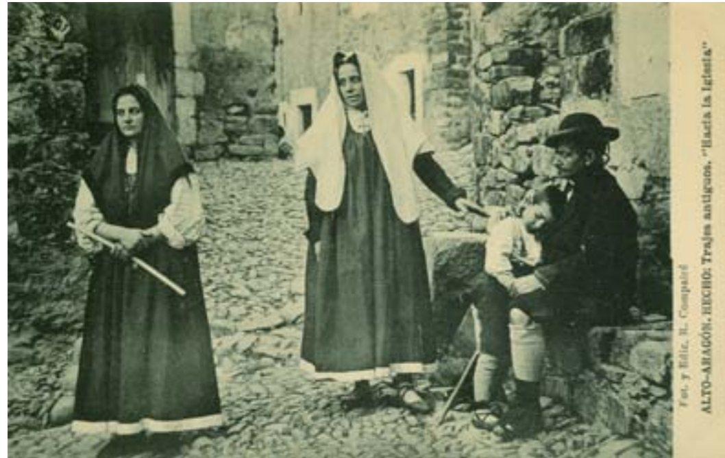
Dj7955. Hecho (Alto Aragón). Trajes antiguos «Hacia la iglesia» . Fotografía y edición de R. Comparé. Impresión de Hauser y Menet. H. 1920.