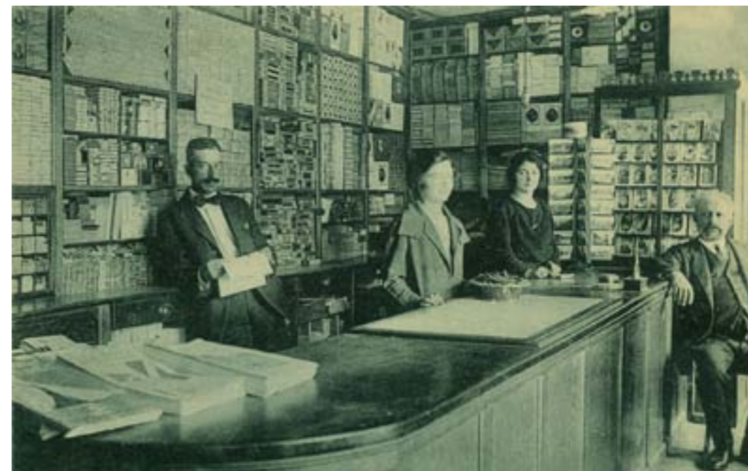
Dj10071. Librería y Estanco de L. de la Justicia Recio. Plaza Mayor, 11. Valladolid. Edición del establecimiento. Impresión de Hauser y Menet, Madrid. 1918.