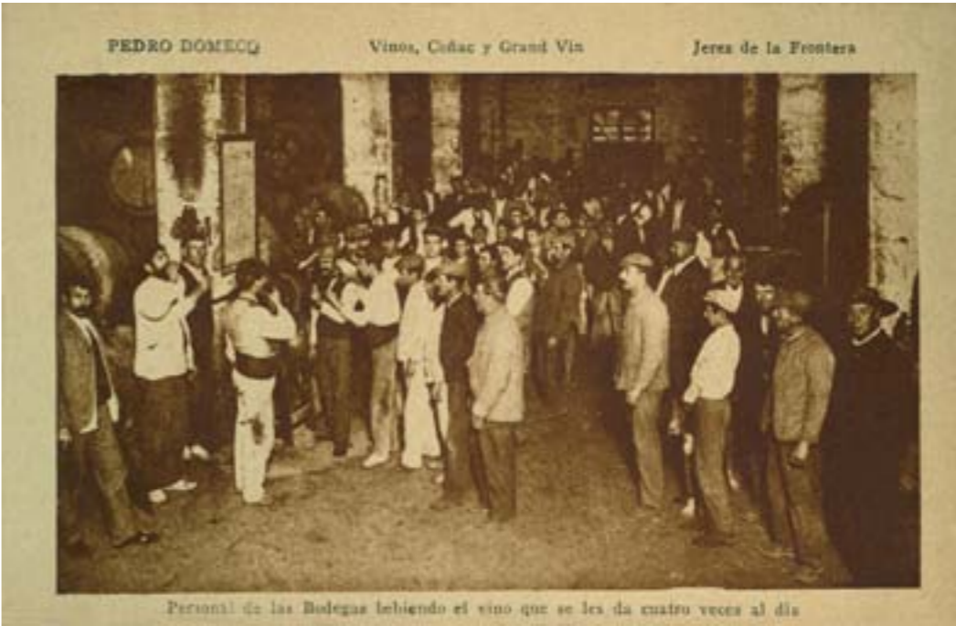
Dj7690. Personal de las bodegas bebiendo el vino que se les da cuatro veces al día. Editada por Pedro Domecq. Vinos, coñac y grand vin. Jerez de la Frontera. Impresión de Mateu, Madrid. H. 1910.