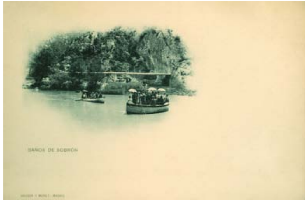
Dj11546. Baños de Sobrón . Edición e impresión de Hauser y Menet, Madrid. 1902.