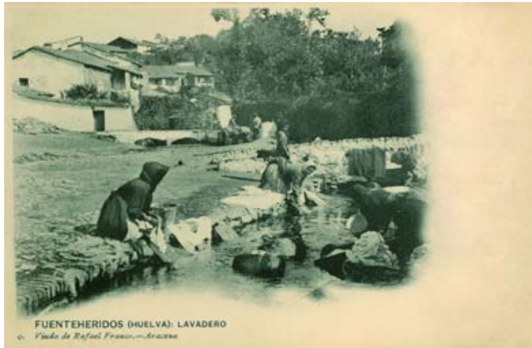
Dj7192. Lavadero. Fuenteheridos (Huelva) . Número 9 de la edición de la Viuda de Rafael Franco, Aracena. Impresión de Hauser y Menet, Madrid. 1903.