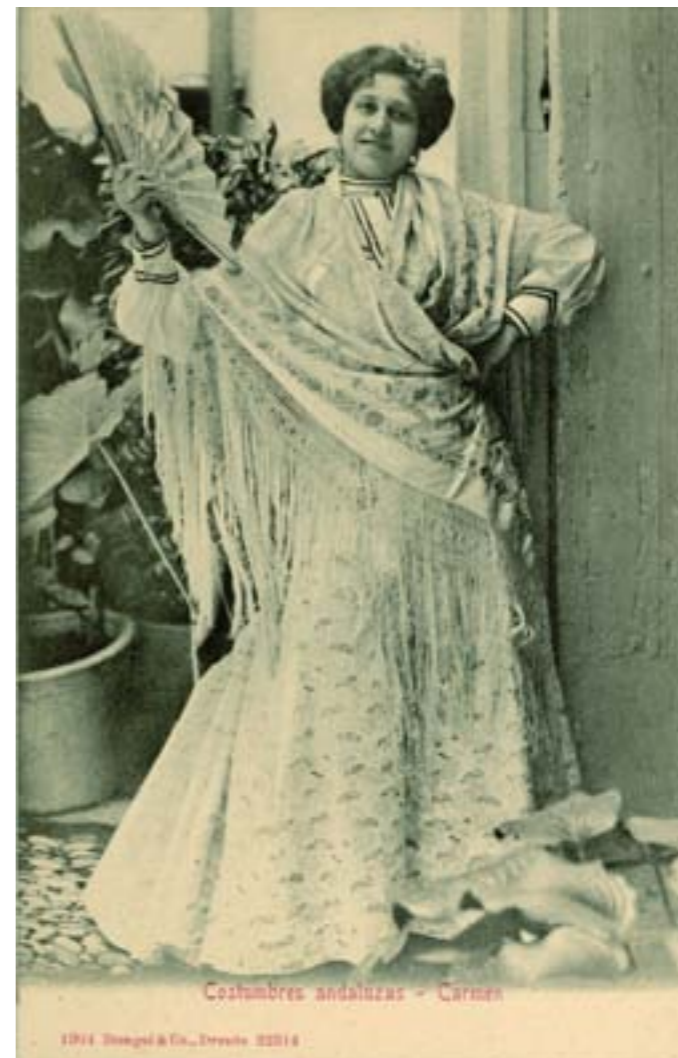
Costumbres andaluzas - Carmen

Dj6956. Gitanos dedicados al «chalaneo» . Edición e impresión de Hecograbado Fournier, Vitoria. H. 1925.