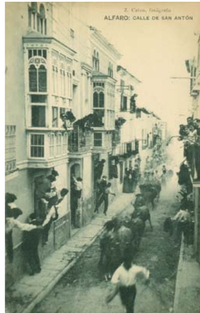
Dj12245. Alfaro: Calle de San Antón . Impresión de Hauser y Menet, Madrid. 1918.