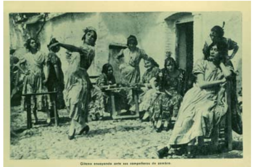
Gitana ensayando ante sus compañeras de zambra.