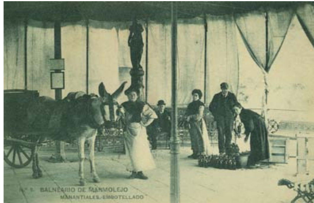
BALNEARIO DE MARMOLEJO MANANTIALES-EMBOTELLADO