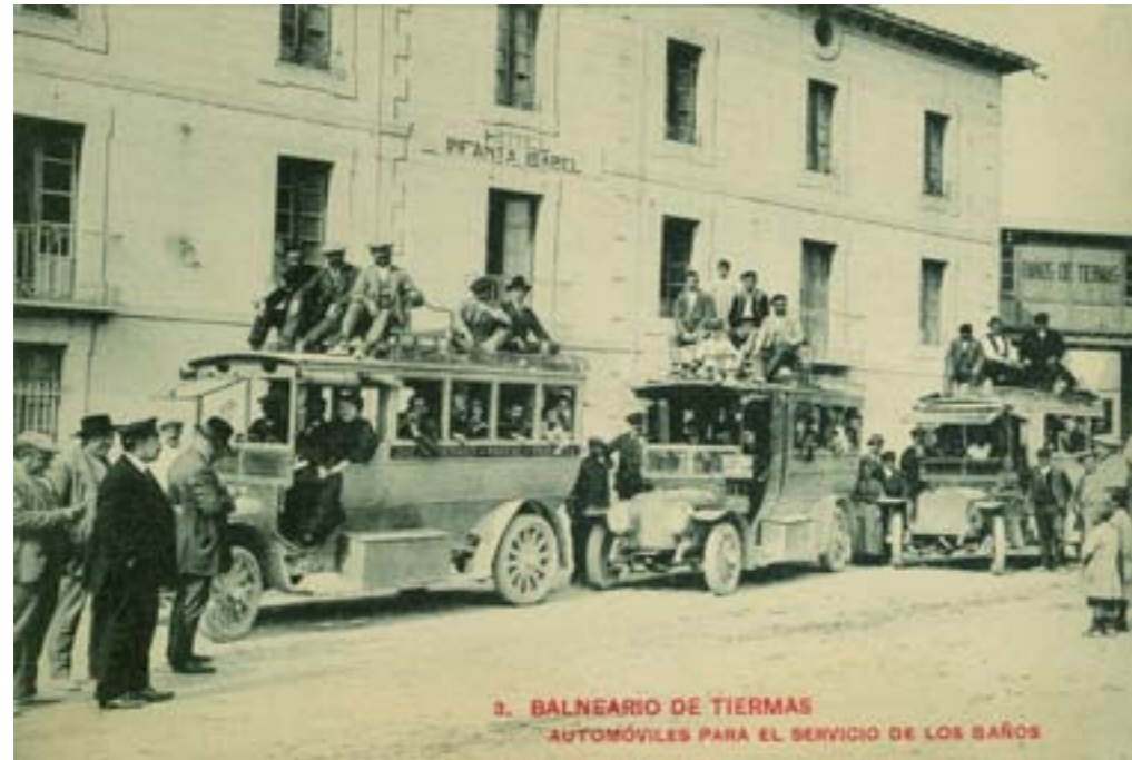
3. BALNEARIO DE TIERMAS AUTOMÓVILES PARA EL SERVICIO DE LOS BAÑOS