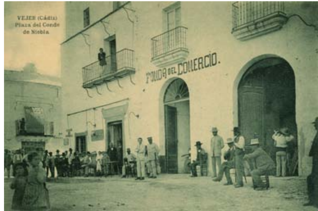
Dj7893. Vejer (Cádiz). Plaza del Conde de Niebla. Edición de Guillermo Uhl, Cádiz. Impresión de Hauser y Menet, Madrid. 1913.