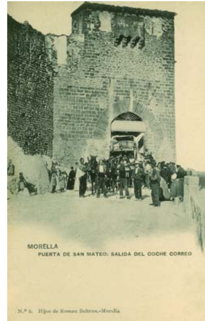
MORELLA PUERTA DE SAN MATEO: SALIDA DEL COCHE CORREO

Dj12604. De regreso del campo . Colección Aragón. -I Serie número 10. Edición e impresión de Hauser y Menet, Madrid. 1903.