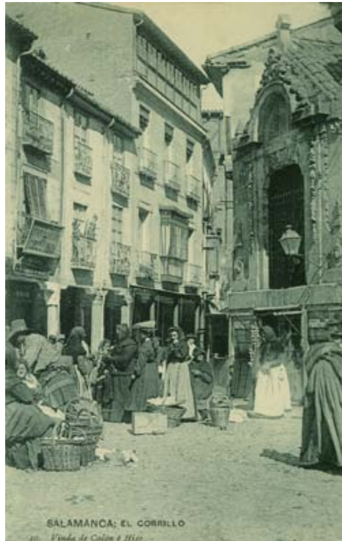
Dj9674. Salamanca: El corrillo . Nº 10 de la edición de Viuda de Calón e Hijo. Impresión de Hauser y Menet, Madrid. 1908.