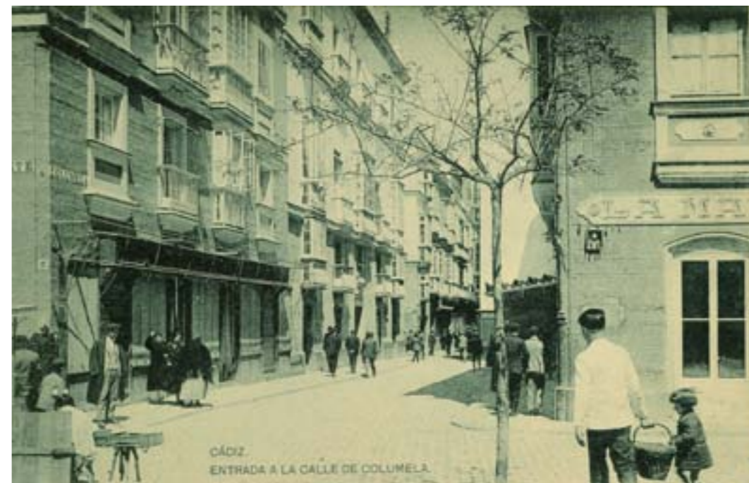
Dj7445. Cádiz. Entrada a la calle de Columela. Impresión de Hauser y Menet, Madrid. 1918.