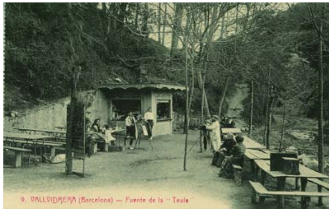
9. VALLVIDRERA (Barcelona) — Fuente de la «Teula»