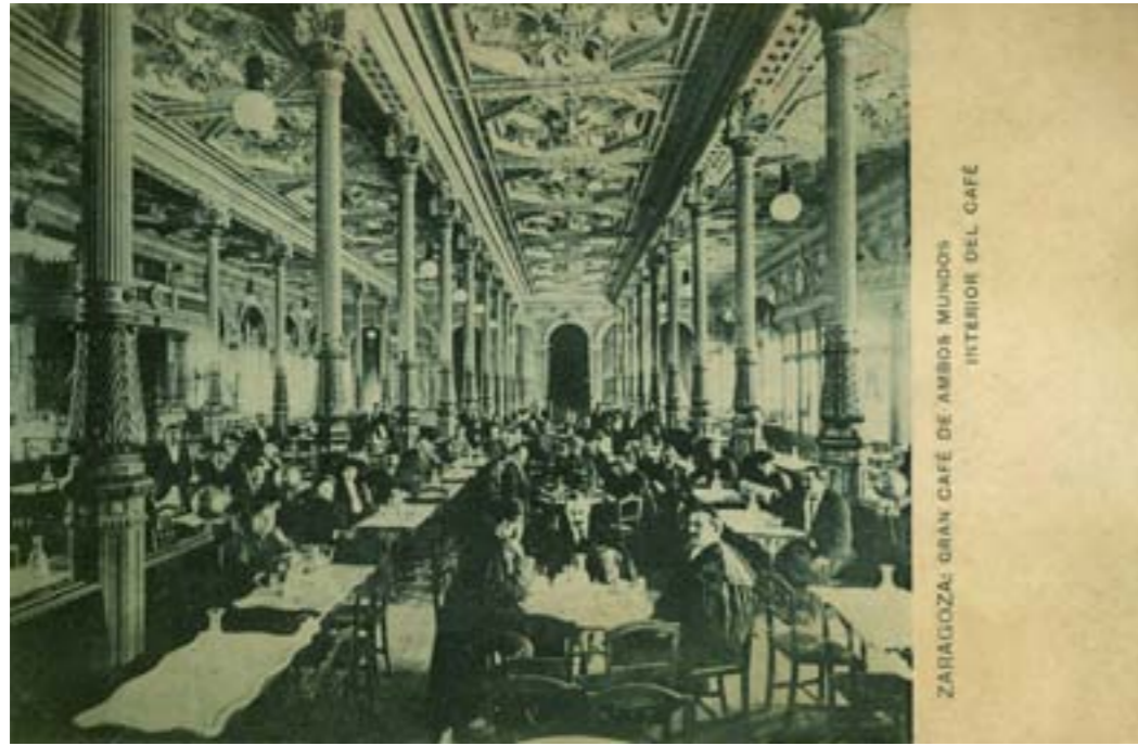
Dj8064. Zaragoza: Gran café de ambos mundos. Interior del café. Impresión de Hauser y Menet, Madrid. 1908.