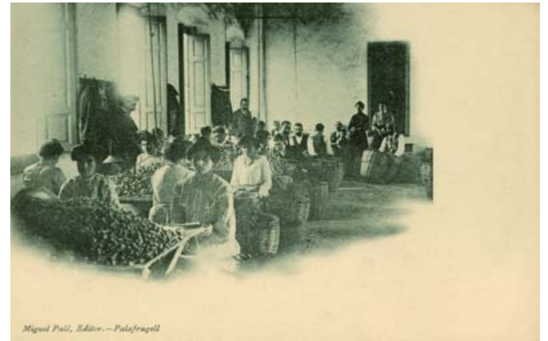
Dj12649. Palafrugell . Edición de Miguel Palé. Impresión de Hauser y Menet, Madrid. 1905.