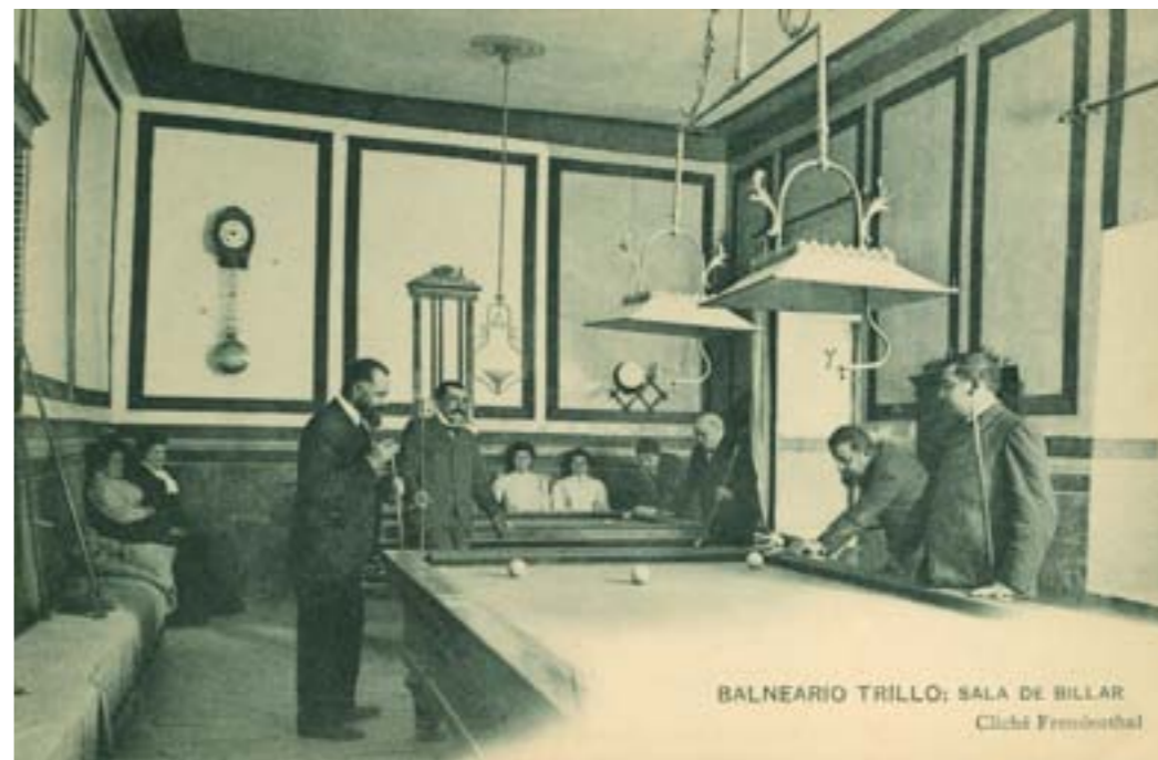
Dj10255. Balneario Trillo: Sala de billar. Impresión de Hauser y Menet, Madrid. 1905.