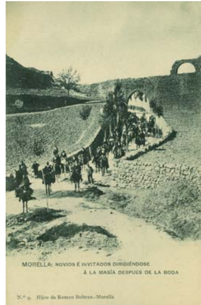
Dj12431. Morella: Novios e invitados dirigiéndose a la masía después de la boda. Edición de Hijos de Román Beltrán, Morella; n.º 9. Impresión de Hauser y Menet, Madrid. 1908.