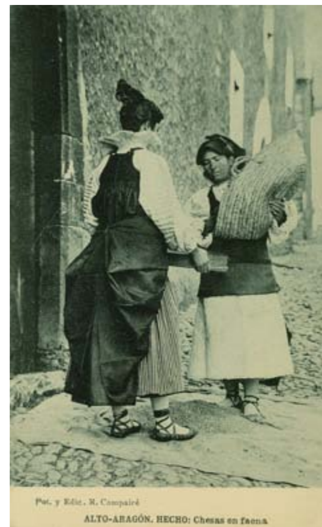
Dj7960. Hecho (Alto-Aragón): Chesas en faena. Fotografía y edición de R. Comparé. Impresión de Hauser y Menet, Madrid. H. 1920.