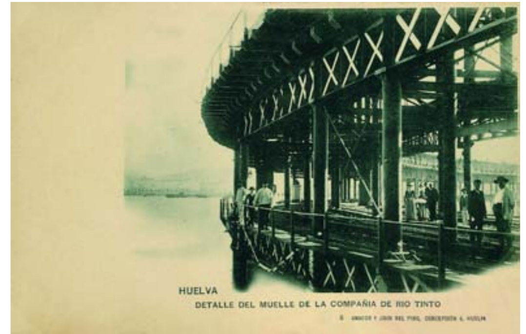
HUELVA DETALLE DEL MUELLE DE LA COMPAÑÍA DE RIO TINTO