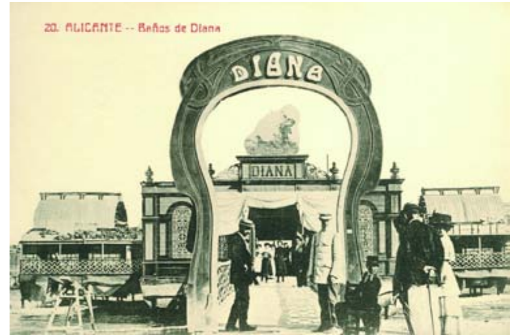
Dj12354. Alicante - Baños de Diana . Nº 20 de la edición, probablemente del balneario. Impresor desconocido. H.1910.