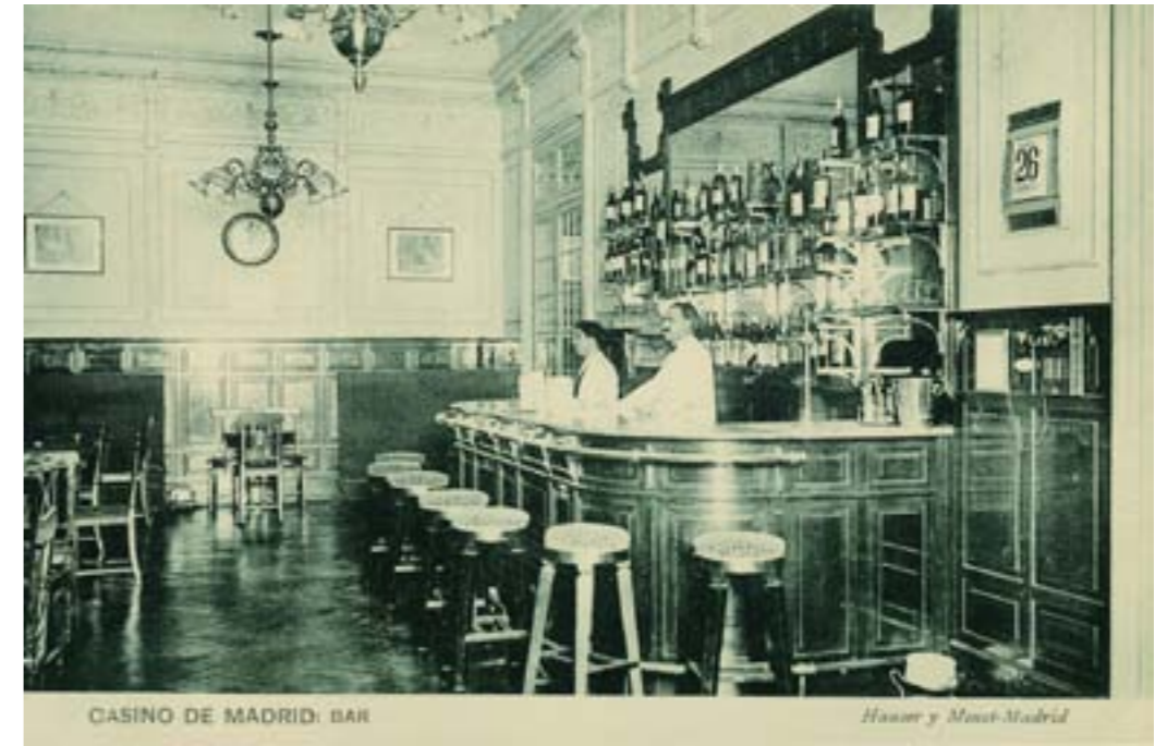
Dj10989. Casino de Madrid: Bar. Impresión de Hauser y Menet, Madrid. 1913.