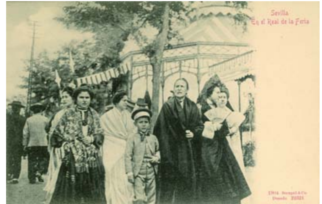
Dj12954. Sevilla. En el Real de la Feria . N° 22321 de la edición de Stenge & Co, Dresde (Alemania). 1904.