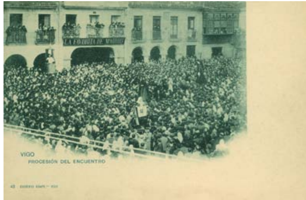
Dj10733. Vigo. Procesión del encuentro . Edición de Eugenio Krapf, Vigo; n° 48. Impresión de Hauser y Menet, Madrid. 1900.