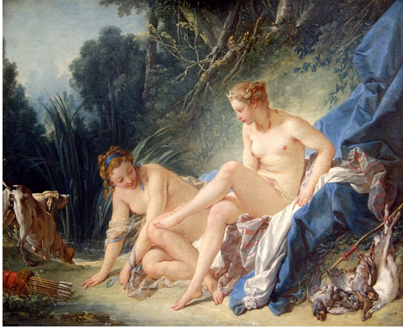
Diana saliendo del baño. François Boucher, 1742.