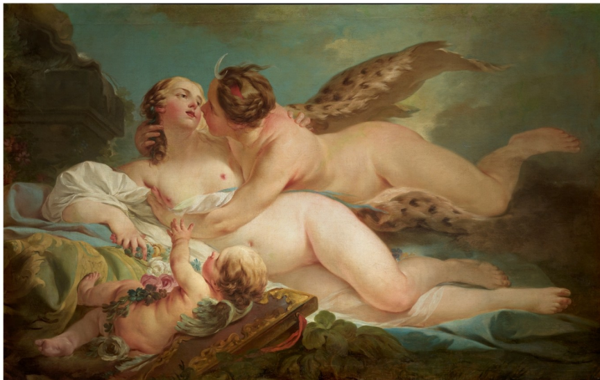
Diana y Calisto . Jean-Baptiste-Marie Pierre, 1745-1749. Museo Nacional del Prado (Madrid) Júpiter, metamorfoseado en Diana, seduce a Calisto.

En la historia del arte este mito está ampliamente representado en pinturas y esculturas en las que aparecen Calisto y Zeus, este bien con la forma de Apolo bien con la de Artemisa . Aquí se muestran algunos ejemplos: