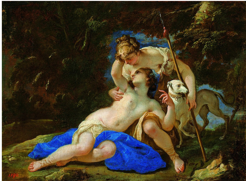
Diana y Calisto. Federico Cervelli, hacia 1670. Museo Nacional de Varsovia Los amores de Calisto y Júpiter (metamorfoseado en Diana).