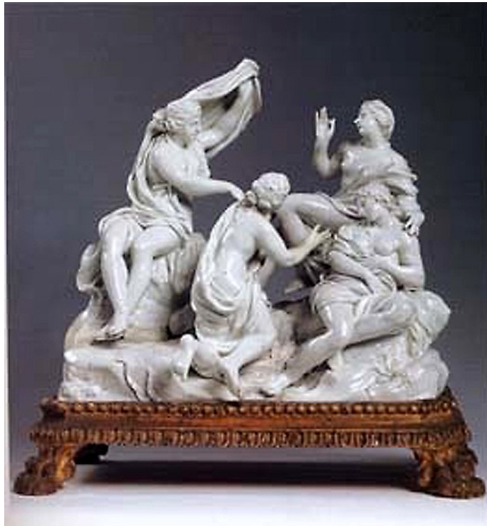
Diana y Calisto. Gaspero Bruschi, hacia 1750.

La diosa Diana, a la derecha, reconocible por la corona de perlas y la joya en forma de media luna, en compañía de la ninfa Calisto.