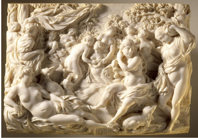
Diana y Calisto. Ignaz Elhafen, hacia 1690-1695. Los Angeles County Museum of Art Calisto es descubierta en su estado de embarazo por el séquito de Diana.