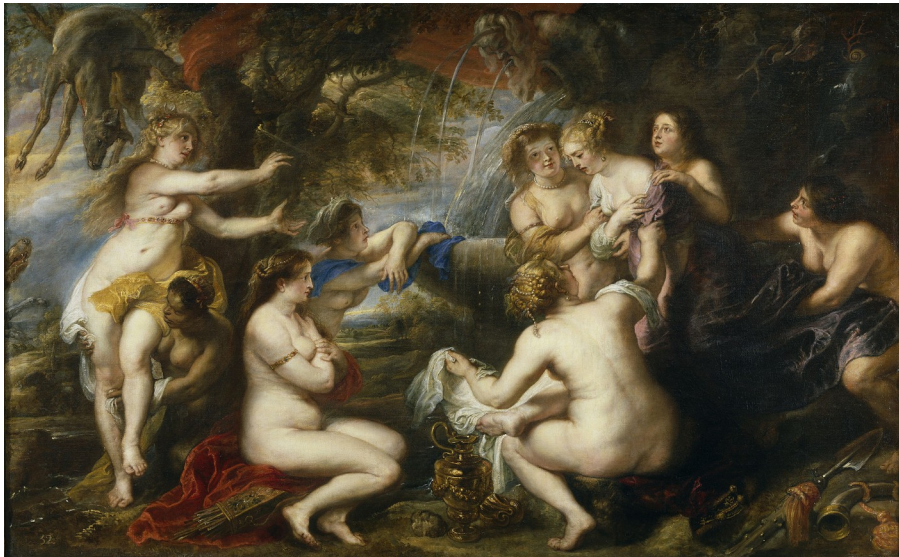
Diana y Calisto. Peter Paul Rubens, hacia 1635. Museo Nacional del Prado (Madrid) Las compañeras de Calisto le quitan la ropa para mostrarle a Diana el embarazo de la ninfa.