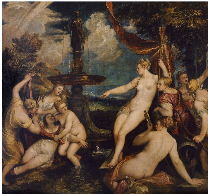
Diana y Calisto. Tiziano, hacia 1650. Kunsthistoriches Museum de Viena Calisto es forzada a quitarse la ropa por sus compañeras que le arrancan las prendas para mostrarle a Diana el vientre abultado por el embarazo.