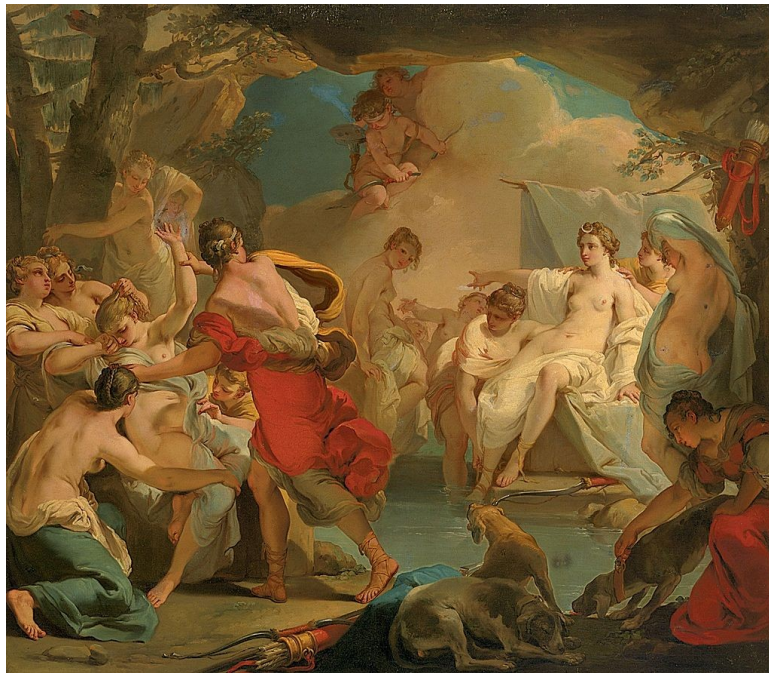
Diana y Calisto. Gaetano Gandolfi, hacia 1785-1789. Colección privada Diana descubre el embarazo de Calisto y señala su culpabilidad.