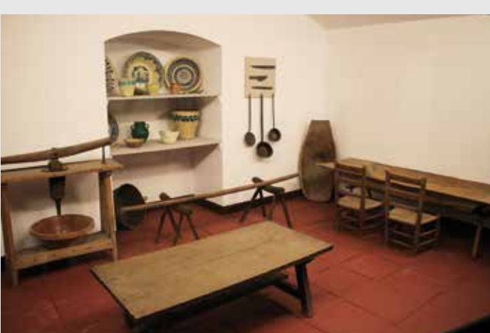
) Utensilios para la matanza y elaboración de chacinas

Destaca, dentro de esta temática, la instalación de una pequeña bodega junto a la sala 6, procedente de El Condado de Huelva, compuesta por 19 bocoyes y 6 medias botas que producen vino de El Condado del tipo oloroso seco, siguiendo el procedimiento artesanal de crianza, con un aroma tan potente que inunda el resto de las salas.