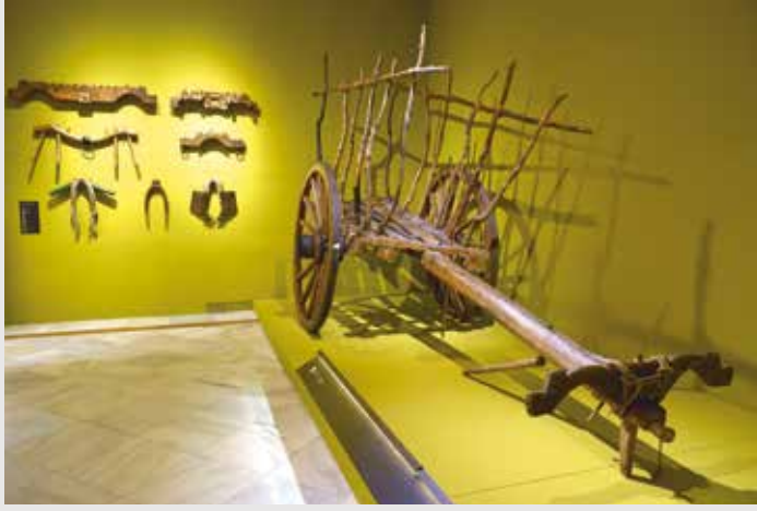
) Vista de la exposición

Esta exposición nos invita a reflexionar sobre la relación del ser humano con los animales, mostrando una gran cantidad de piezas de muy variada tipología y diversos materiales que se agrupan en cinco grandes unidades temáticas. En ellas se puede ver el aprovechamiento de los animales para la alimentación y otros recursos, su uso como fuerza de trabajo y transporte, la inclusión en el mundo del ritual festivo y del ocio o la dimensión simbólica que se les ha otorgado. Finalmente, se muestra cómo ha cambiado la concepción sobre algunos animales y nuestra relación con ellos debido a la concentración de la población en los entornos