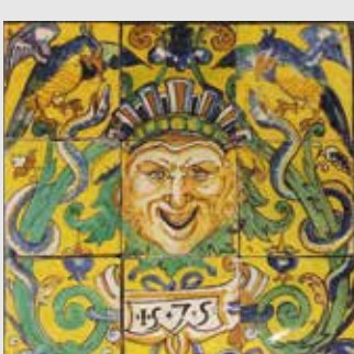
) Panel de azulejos pintados policromos con mascarón

Destaca, dentro de esta temática, la instalación de una pequeña bodega junto a la sala 6, procedente de El Condado de Huelva, compuesta por 19 bocoyes y 6 medias botas que producen vino de El Condado del tipo oloroso seco, siguiendo el procedimiento artesanal de crianza, con un aroma tan potente que inunda el resto de las salas.