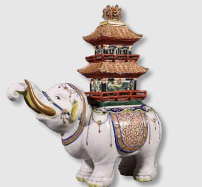
) Pebetero con forma de elefante

El primer montaje expositivo, realizado en 1994, presentaba dos núcleos temáticos diferenciados: por un lado las dependencias laborales y familiares, y por otro los encajes y bordados. Actualmente solo se exhibe el primer núcleo, pero el museo está trabajando en una nueva propuesta expositiva que integrará toda la colección para contribuir a su mejor lectura, resaltando el protagonismo de las mujeres en este negocio, algo excepcional a mediados del siglo XX. Esto nos ayudará a comprender la ideología y la visión del mundo de la sociedad de esta época y a reflexionar sobre nuestro presente.