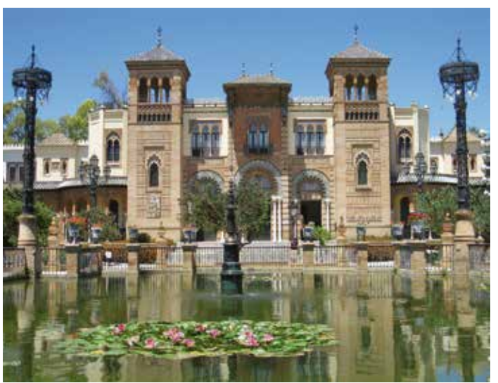
) Fachada principal del museo

Las instalaciones abiertas al público incluyen, además de las salas de exposición tanto permanente como temporales, una biblioteca especializada en antropología y museología, un salón de actos y varias áreas de descanso.