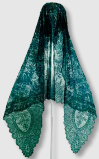
) Mantilla de encajes