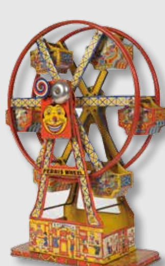
) Noria de juguete de hojalata

número de enseres, especialmente para el aseo personal y para la transformación y el consumo de alimentos. Por el contrario, se han abandonado muchos utensilios relacionados con el autoabastecimiento y el almacenamiento de productos.