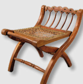
) Silla plegable con asiento de rejilla

Esta área analiza las funciones de la casa estrechamente relacionadas con las necesidades más elementales de los miembros de la familia: la alimentación, el descanso, la reproducción, la seguridad... También muestra los ajuares domésticos que el tiempo ha dejado en desuso para invitar a la reflexión sobre esas transformaciones. Los cambios más importantes en el mobiliario y el ajuar doméstico tradicional están relacionados con la especialización, de manera que hoy en día consideramos necesarios un mayor