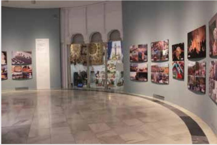
) Vista de la exposición

Este es el contexto en el que nace esta exposición, a través de la que pretendemos invitar al público a conocer la gran diversidad cultural existente en Andalucía y reivindicar la importancia de nuestro patrimonio inmaterial puesto que, lejos de ser el recuerdo de un pasado