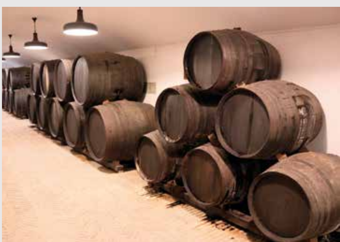
) Bodega del museo