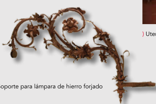
) Soporte para lámpara de hierro forjado