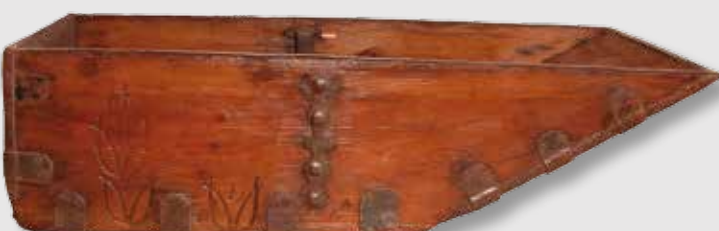
) Media fanega para medir el grano

La necesidad y el anhelo del ser humano por comprender y controlar su entorno es universal. Para ello ha creado grandes explicaciones, ya sean mitológicas, científicas o religiosas, y conceptos como las unidades de medida. Entre ellas se encuentran las temporales (años, meses, días, horas...), las espaciales o de longitud (kilómetros, millas, pulgadas...) y las medidas tradicionales de peso y capacidad para áridos y líquidos, de las que se expone en esta sala una variada muestra.