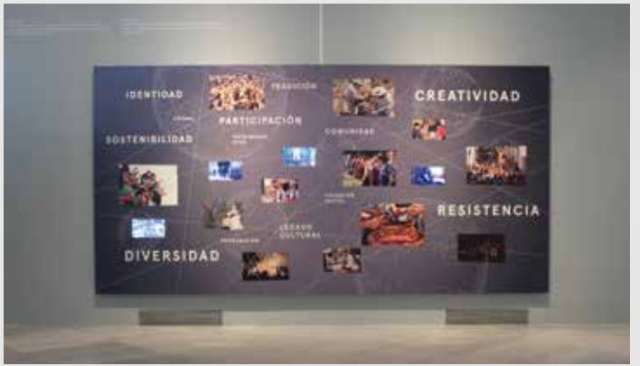
) Mural conceptual del patrimonio inmaterial de Andalucía

Nuestro mundo actual está atravesado por la lógica globalizadora del mercado que pretende imponer un único modelo cultural. Este proceso homogeneizador desplaza los conocimientos tradicionales, poniendo en peligro infinidad de actividades rituales, productivas y expresivas, y los sistemas bioculturales que las articulan. No obstante, esta no es la única dinámica que caracteriza nuestra contemporaneidad. Como respuesta han surgido otras fuerzas en sentido opuesto que, desde lo local, reafirman y reproducen identidades colectivas específicas.