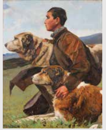
) Zagal con mastines, Andrés Parladé, conde de Aguiar

Esta exposición nos invita a reflexionar sobre la relación del ser humano con los animales, mostrando una gran cantidad de piezas de muy variada tipología y diversos materiales que se agrupan en cinco grandes unidades temáticas. En ellas se puede ver el aprovechamiento de los animales para la alimentación y otros recursos, su uso como fuerza de trabajo y transporte, la inclusión en el mundo del ritual festivo y del ocio o la dimensión simbólica que se les ha otorgado. Finalmente, se muestra cómo ha cambiado la concepción sobre algunos animales y nuestra relación con ellos debido a la concentración de la población en los entornos