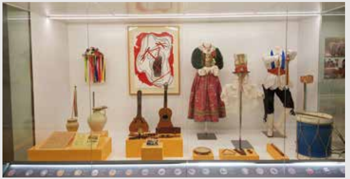
) Vitrina dedicada a los modos de expresión

Este es el contexto en el que nace esta exposición, a través de la que pretendemos invitar al público a conocer la gran diversidad cultural existente en Andalucía y reivindicar la importancia de nuestro patrimonio inmaterial puesto que, lejos de ser el recuerdo de un pasado