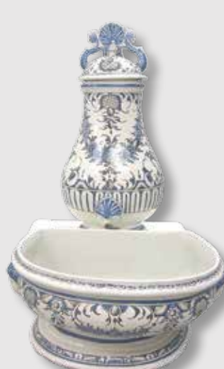
) Vasija-filtro para agua