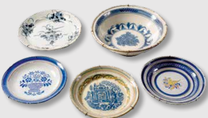
) Cerámica popular