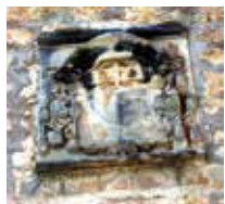
) Escudo de Sandoval y Rojas. Detalle de la puerta norte

entre las tropas musulmanas y castellanas. También es mencionado después de la conquista cristiana, en época de Sandoval y Rojas, cuando se intervino en la puerta norte (principios del siglo XVII). Esta puerta está situada sobre la roca viva, tiene un primer arco túmido (de herradura apuntado) de ladrillos y, sobre él, un segundo arco de descarga de medio punto. Sobre ella se sitúa el escudo de Sandoval y Rojas con la fecha de 1606.