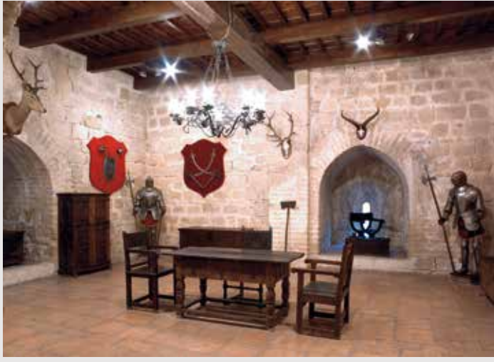
) Sala de armas

La tercera planta alberga la «sala noble». Arquitectónicamente es la más relevante, por su terminación en una bóveda de crucería gótica y sus ventanales de arcos apuntados con parteluz. Es conocida también como «sala de tapices», pues en sus paredes se exponen tres tapices flamencos de los siglos XVI y XVII, con temas como la vejez, Rómulo o los amores de Venus, junto a una alfombra india.