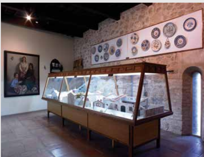
) Sala de maquetas

en la que se insertan elementos metálicos afilados, y otro con rulos de cuchillas de hierro, entramado de madera y sillete. Completan la colección varios arados, uno de los elementos imprescindibles en las labores agrícolas.