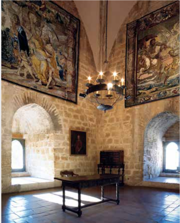
) Sala noble