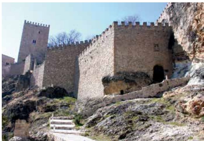
) Puerta norte del castillo