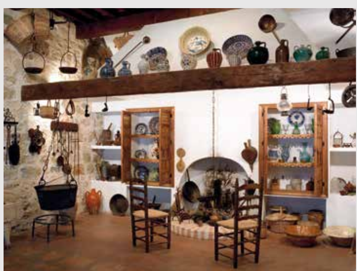
) Cocina cazorleña

Por último, la tercera sala ha sido adaptada para montar una típica y amplia cocina cazorleña con todo su ajuar y los utensilios propios de esta estancia: una colección de elementos para cocinar y para servir. Tampoco faltan instrumentos curiosos como una jeringa para postres, moldes para dulces, molinillos de café, diversos recipientes de vidrio para agua y licor y un conjunto de garrafas y jarras relacionadas con el almacenamiento y medición del aceite. El planchado era una actividad que se solía realizar en la cocina, por lo que también encontramos una colección de planchas y soportes para estas. Se completa esta estancia con las maquetas de dos cortijos, uno de campiña y otro típico de la sierra, así como con dos paneles con una amplia vajilla de cerámica granadina (de Fajalauza).