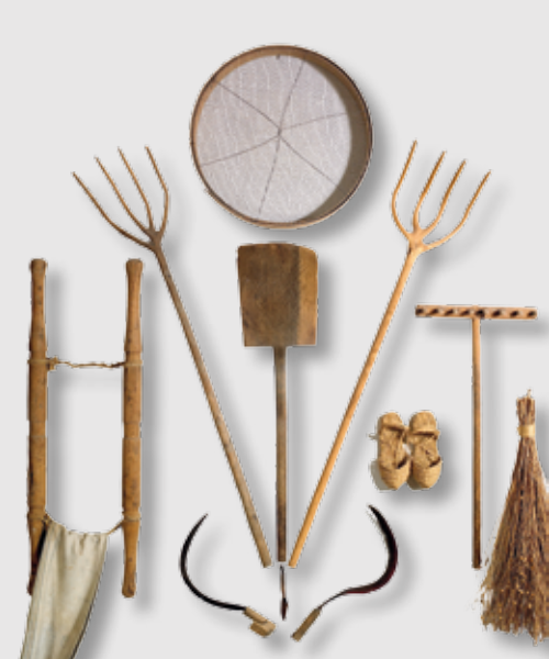
) Utensilios agrícolas

Está instalada en un edificio anexo a la torre del homenaje y consta también de tres salas. La estancia de entrada al museo exhibe tres paneles con útiles y utensilios agrícolas como trillos, arados, ubios, etc. En esta sala se exponen diversos aperos agrícolas empleados en la siembra, el cultivo y la recolección, así como maquetas de los trabajos del campo en las que se escenifica la recolección de cereales y de la aceituna. Junto a ellas se muestran varias medidas para cereales, así como un trillo y varias cestas y espuelas. En el patio también contamos con varios trillos: uno más arcaico, consistente en una tabla