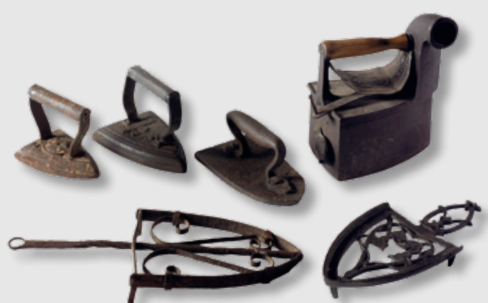
) Planchas y soportes

Por último, la tercera sala ha sido adaptada para montar una típica y amplia cocina cazorleña con todo su ajuar y los utensilios propios de esta estancia: una colección de elementos para cocinar y para servir. Tampoco faltan instrumentos curiosos como una jeringa para postres, moldes para dulces, molinillos de café, diversos recipientes de vidrio para agua y licor y un conjunto de garrafas y jarras relacionadas con el almacenamiento y medición del aceite. El planchado era una actividad que se solía realizar en la cocina, por lo que también encontramos una colección de planchas y soportes para estas. Se completa esta estancia con las maquetas de dos cortijos, uno de campiña y otro típico de la sierra, así como con dos paneles con una amplia vajilla de cerámica granadina (de Fajalauza).