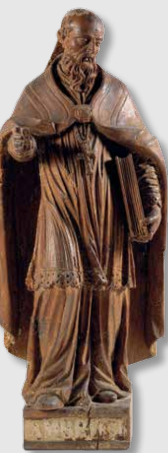
) San Ambrosio

Encontramos esta sección en la torre del homenaje, que está situada en la zona más noble de la fortaleza, la más meticulosamente edificada y con mayor riqueza de materiales. Su construcción fue concebida exclusivamente para uso militar, y no como palacio de un señor feudal o una pequeña corte de monarca medieval. La torre del homenaje, mandada construir a finales del siglo XIV por Pedro Tenorio, tiene planta cuadrada y es de mampostería regular. Consta de tres estancias, en tres niveles de altura, iluminadas por medio de troneras y ventanales con parteluces, destacando especialmente la bóveda de crucería de la última planta, y se remata con la terraza superior, rodeada de almenas.