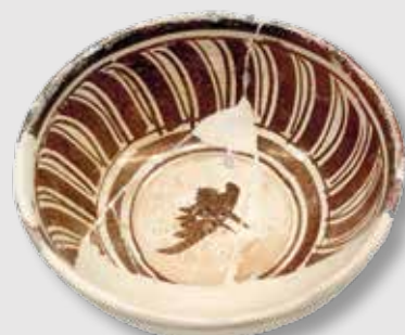
) Cuenco de loza dorada

En la segunda sala se encuentran tres maquetas de molinos de aceite o almazaras de distintas épocas, por lo que se denomina «sala de maquetas», así como capachos de esparto y romanas, todo relacionado con la elaboración del aceite. Por otra parte, se exponen en una vitrina restos de cerámica de diversa época encontrada en el recinto del castillo, entre la que destaca