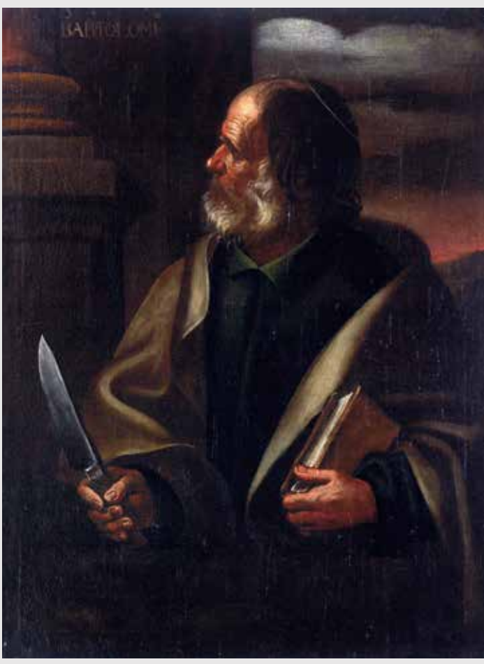
) Apostolado barroco: San Bartolomé

En la primera planta podemos ver una capilla, presidida por un Cristo de estilo románico de gran tamaño, rodeado por un apostolado barroco que, aun teniendo un valor artístico irregular, pues parecen obras de distinta mano, se trata de un conjunto completo ya que agrupa a los doce apóstoles. Además de estar escrito sobre el óleo el nombre del apóstol correspondiente, los atributos iconográficos (normalmente los instrumentos con los que fueron martirizados) nos indican la identidad de cada uno de ellos. Destaca, además, una escultura de San Ambrosio de época barroca, tallada en madera. Por otra parte, en el suelo de esta capilla encontramos la entrada a una mazmorra que se asocia con la leyenda de la Tragantía. En la segunda planta se ha instalado