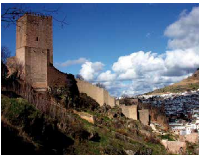
) Vista general del castillo

No existen datos seguros sobre su construcción, si bien los estudiosos parecen coincidir en que los árabes debieron de edificarlo sobre los restos de una primitiva fortaleza romana. El castillo actual procede de la época del arzobispo Pedro Tenorio, que en 1394 lo restauró y amplió al ver amenazada la frontera por el apogeo del reino nazarí de Granada durante el reinado de Muhammad V, y está probada documentalmente la importancia de este en las guerras y escaramuzas