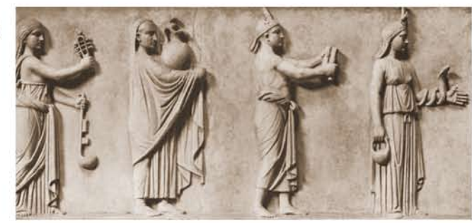
Procesión isíaca. Museos Vaticanos (Roma)