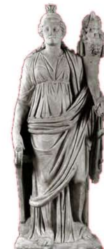
Isis Fortuna. Musei Capitolini (Roma)