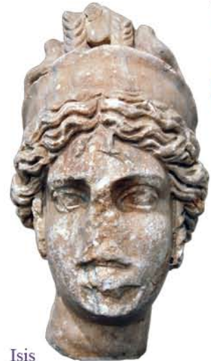
Isis Museo Arqueológico de Sevilla

Para complicar aún más las cosas, no existen otros testimonios del culto a Isis en la ciudad. Ilipa, como muchas ciudades portuarias del Imperio Romano, pudo haber tenido un santuario en honor de la famosa diosa egipcia, que entre otras muchas cosas era protectora de la navegación.