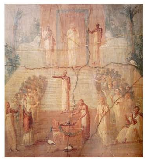
Sacrificio Isíaco, Templo de Isis en Pompeya. Museo Arqueológico Nacional de Nápoles

El reinado del emperador Adriano supuso un decidido impulso para los cultos nilóticos y para la difusión de una serie de divinidades que, como Isis y Serapis, se habían convertido en parte del lenguaje del poder imperial y en expresión cultural favorita de las élites de todo el Imperio.