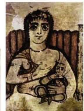
Fresco de Isis con Horus. Karanis (Egipto)

La pieza se fecha además en el siglo II d.C. y muestra la creciente popularidad de la cultura egipcia en el Mediterráneo romano.