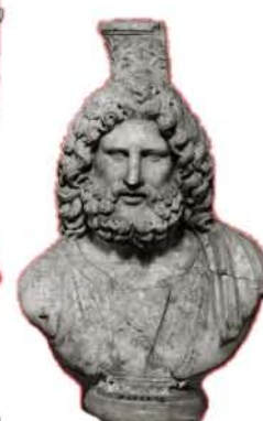
Busto de Serapis. Musei Capitolini (Roma)