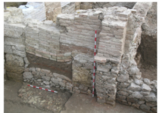
Imagen del aprovechamiento de ladrillos romanos a lo largo de 1000 años. (Plaza de la Encarnación, Sevilla)