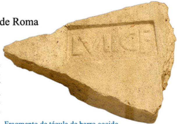
Fragmento de tégula de barro cocido. Encontrado en Itálica. Siglo II

Ante la gran cantidad de obras de arte de primer nivel que se custodian en el Museo, resulta cuanto menos curioso que nos centremos en un trozo de ladrillo, o tégula mejor dicho. Sin embargo, la humildad del material y la abundancia de estos restos en las excavaciones no debe restar importancia a un objeto que nos transmite una serie de valores e ideas de la civilización romana.