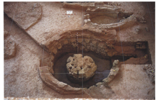
Hornos de ladrillo y tégula descubiertos en el Hospital de las Cinco Llagas (Sevilla) (Tabales, 2003)

Pero además en sí mismo, el ladrillo romano y su hermana la tégula han significado en la historia de Sevilla el material de construcción fundamental durante al menos 1200 años, incluso mucho después de que dejara de fabricarse.