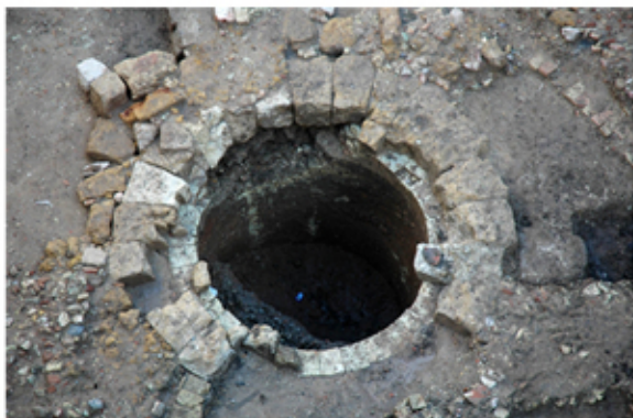
Pozo hallado en la plaza de la Pescadería (Sevilla) construido con ladrillos con forma adaptada a la curvatura del mismo.

Pero además en sí mismo, el ladrillo romano y su hermana la tégula han significado en la historia de Sevilla el material de construcción fundamental durante al menos 1200 años, incluso mucho después de que dejara de fabricarse.