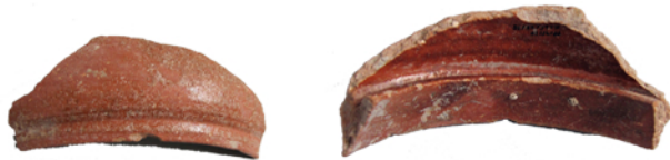
Fragmento de matraz y fragmentos de condensador

El alambique es un artefacto utilizado para destilar líquidos y extraer su esencia, consta de un recipiente inferior denominado vaso, cuerpo o matraz, en el que se calienta el líquido hasta el punto de ebullición, de una pieza superior, denominado condensador, enfriador o tapa, donde se recogen y enfrían los vapores pasando de nuevo al estado líquido, y de un tubo que conduce el producto final hacia un recipiente donde se deposita.