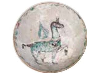
) Ataifor con representación zoomorfa en verde y manganeso