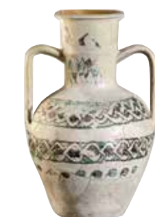
) Jarra con decoración vidriada en verde y manganeso