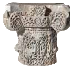
) Capitel compuesto con decoración tallada a trépano o "de avispero"