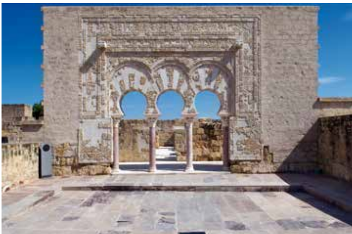
) Portada de la casa de Ya'far