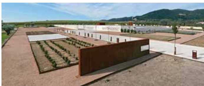
) Vista general del museo

Tiempo estimado de visita al museo: 45' - 1h 15'.