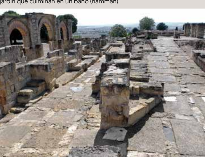
) Calle en rampa de acceso al pórtico

principal de un conjunto integrado por un extenso jardín alto en crucero, un pabellón central, completamente desaparecido, rodeado por cuatro albercas, y una serie de ricas estancias abiertas sobre el andén norte del jardín que culminan en un baño (hamman).