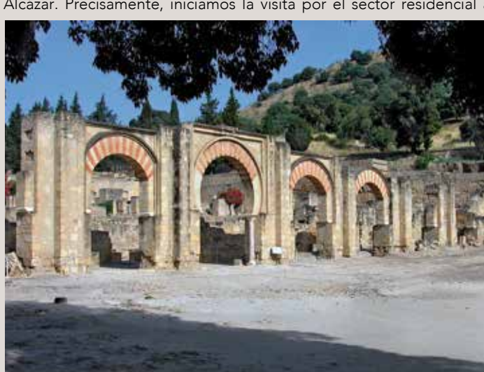
) Pórtico frente a la plaza de Armas

Volviendo a la plaza que se extiende a los pies del Edificio Basical Superior, continuamos nuestro recorrido hacia las Caballerizas (5), situadas entre la zona administrativa y la parte más privada del Alcázar. Precisamente, iniciamos la visita por el sector residencial a