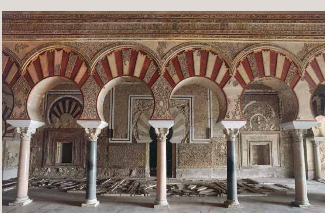
) Interior del salón de Abd al-Rahman III o salón Rico

través de la llamada Casa de Ya'far (6), un buen ejemplo de residencia de un alto cargo de la administración califal. Separadas de esta gran vivienda por un corredor o callejón, se encuentran las Viviendas de Servicio (7), donde hay un horno para la preparación de alimentos. Otras grandes residencias son la Vivienda de la Alberca y el Patio de los Pilares, ambas actualmente en proceso de consolidación y no abiertas al público. Al norte de las Viviendas de Servicio se sitúa el Cuerpo de Guardia (8), controlando el acceso hacia las grandes residencias privadas califales, y comunicado con los Edificios