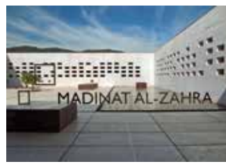
) Patio visto desde el vestíbulo