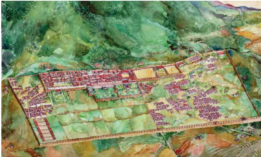
) Reconstrucción de la ciudad de Madinat al-Zahra. Hipótesis de su estructura urbana

La nueva ciudad, denominada Madinat al-Zahra (La ciudad brillante), se ubica en un enclave paisajístico privilegiado, en sucesivas terrazas que se adaptan a la topografía del terreno, con amplias perspectivas sobre el valle del Guadalquivir y la campiña. Una muralla de planta rectangular, con un perímetro de cerca de 4.500 metros, delimitó la ciudad, que se organizó internamente en dos partes bien diferenciadas: