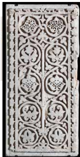
) Tablero decorativo de mármol