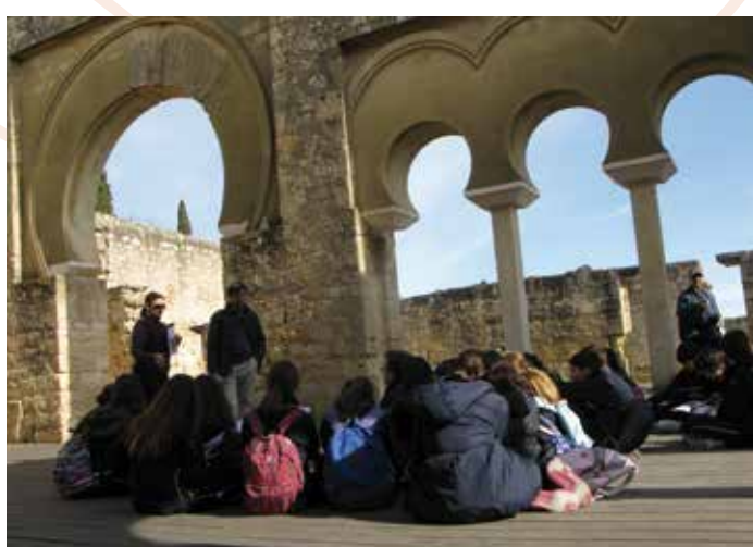
© Ilustración: Pilar del Pino. D.L.: SE 778-2018

Recuerde Para el buen uso de estas instalaciones y para el disfrute de todos, es necesario cumplir las normas establecidas por el centro y atender las indicaciones del personal de vigilancia.