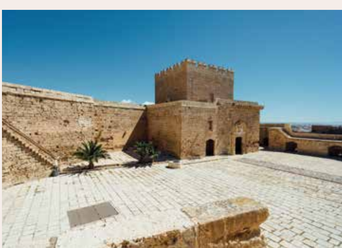
) Torre del Homenaje

Almería pasa a manos cristianas en 1489 y sobre la estructura del ámbito palacial los Reyes Católicos construirán un nuevo castillo, de planta triangular, con un triple objetivo: solucionar los problemas defensivos, dado el pésimo estado en que se encontraba la antigua fortaleza tras el fuerte terremoto sufrido en 1487; responder a las nuevas exigencias militares surgidas del desarrollo de la artillería; y crear una imagen emblemática y representativa del nuevo poder instaurado. Para ello se empleará un nuevo lenguaje constructivo a base de sillares bien tallados, torres semicirculares y troneras con forma de "bola y cruz", dispuestas a ras del suelo para el emplazamiento de las piezas de artillería. Destaca la denominada plaza de Armas (22) y la torre del Homenaje (23), que sería la residencia del alcaide. En este tercer recinto también se encuentran la torre de la Noria (24), en cuyo interior existía una noria para subir el agua, y la torre de la Pólvora (25).