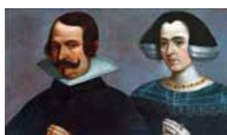
Retrato de dama y caballero orantes. Francisco Pacheco

Se muestran los comienzos del Naturalismo en la pintura sevillana con autores como Francisco Pacheco y sus discípulos Diego Velázquez y Alonso Cano. La obra de Juan de Roelas supone un acercamiento a una expresividad más popular que da cabida al sentimiento, a lo inmediato y lo anecdótico.