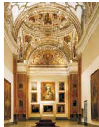
Antigua iglesia del Convento de la Merced

Esta sala, antigua iglesia del Convento, sirve de gran escenografía para exponer el núcleo de la Escuela Sevillana de pintura del siglo XVII. Partiendo de fórmulas manieristas y de un naturalismo incipiente, que se inicia con Roelas, evoluciona hasta llegar a Murillo, máximo exponente del Barroco sevillano. Alonso Vázquez y Roelas comienzan a realizar grandes cuadros para retablos. Herrera el Viejo, Zurbarán y Juan del Castillo continúan en el segundo tercio del siglo. El periodo culmina con las pinturas de Murillo para el convento de Capuchinos, entre las que se encuentra la famosa Virgen de la Servilleta .