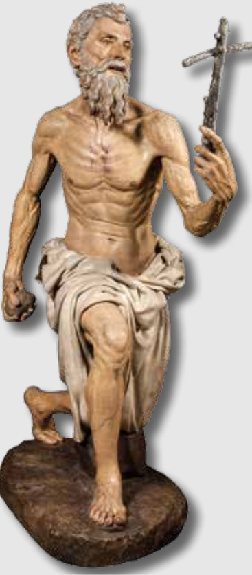
) Pietro Torrigiano, San Jerónimo penitente

La trayectoria de la pintura sevillana, y de la escultura en menor medida, desde el siglo XV hasta mediados del XX, se muestra repartida en catorce salas ordenadas cronológicamente, aunque el museo cuenta con colecciones muy diversas (cerámica, orfebrería, mobiliario, textil, etc.).