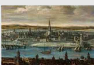
) Louis de Caullery, atribuido, Vista de Sevilla