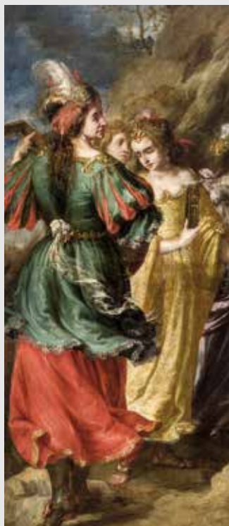
) Juan de Valdés Leal, Las tentaciones de san Jerónimo (detalle)

En su contemporeo Murillo tuvo en las pinturas que se muestran en esta selección que reúne la obra de menor formato del pintor junto con la de sus discípulos más próximos como Juan Simón Gutiérrez, Meneses Osorio o Núñez de Villavicencio.