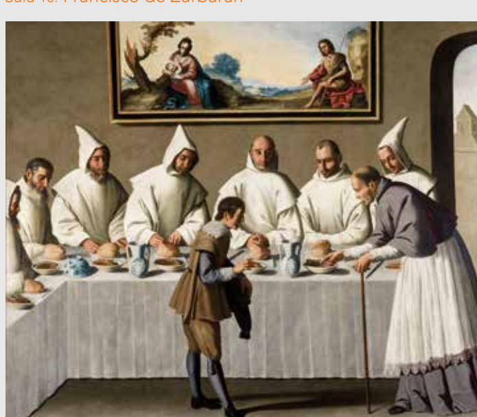
) Francisco de Zurbarán, San Hugo en el refectorio