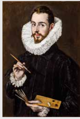
) El Greco, Retrato de Jorge Manuel

Durante el siglo XVI, la pujanza económica de la ciudad como puerto de Indias supone la llegada de obras y artistas de Flandes y de Italia y, con ello, la introducción del Renacimiento en Sevilla. La pintura va a estar dominada por artistas extranjeros, como es el caso de Alejo Fernández. Su pintura renueva de forma decisiva los conceptos artísticos anteriores, creando una escuela que tuvo gran repercusión y en la que se formaron la mayor parte de los artistas locales. Estos pintores de origen nórdico, como sucede también con el flamenco Pedro de Campaña, además de aportar las ideas artísticas de su país, traen influencias de la pintura italiana, especialmente de Rafael y su escuela. En escultura destacamos a Pietro Torrigiano con su magnífico San Jerónimo . También están presentes en esta sala dos importantísimas obras: el Retrato de su hijo Jorge Manuel Theotocópuli de El Greco o el Calvario de Lucas Cranach.