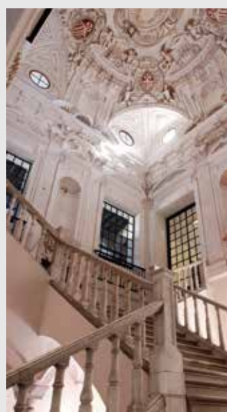
) Escalera imperial

El claustro Mayor, el más majestuoso, fue trazado siguiendo modelos italianos, como atestigua la doble columna sobre plinto elevado de su planta inferior. Estaba decorado con el ciclo pictórico encargado a Francisco Pacheco y Alonso Vázquez en el que se narraba la historia de la Orden Mercedaria, cuatro de cuyas obras se exponen hoy en la sala III.