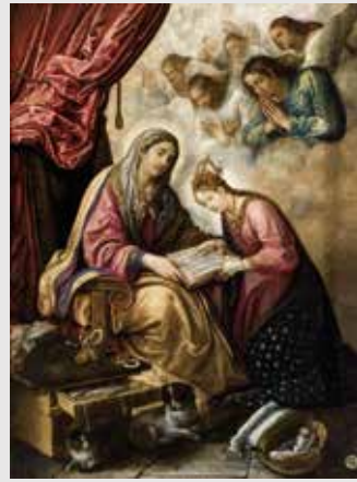
) Juan de Roelas, Santa Ana enseñando a leer a la Virgen

En este panorama debemos destacar las figuras de dos grandes maestros del Barroco español que se formaron en el taller de Francisco Pacheco: Diego Velázquez y Alonso Cano. Ambos supieron introducir en el arte sevillano importantes innovaciones.