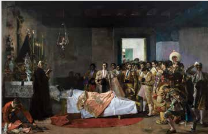
) José Villegas, La muerte del maestro