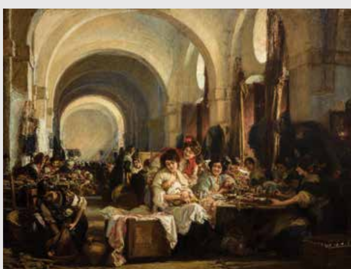
) Gonzalo Bilbao, Las cigarreras

La sala dedica gran parte de su espacio a la obra de Gonzalo Bilbao, el artista más importante del momento, si bien su obra principal, Las cigarreras , se expone en la sala 12. Acompañan al artista otros nombres como Winthuysen o Grosso, que nos conducen hasta mediados de siglo. En escultura destaca la obra de Joaquín Bilbao.