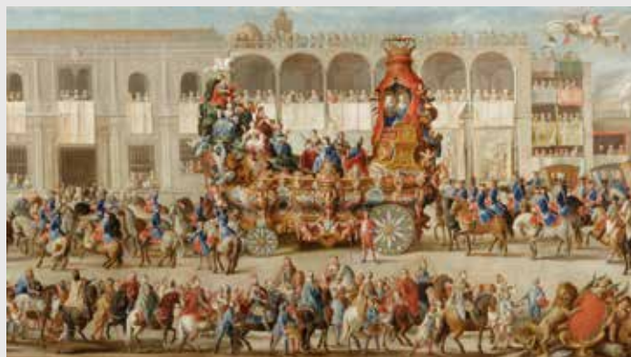
) Domingo Martínez, Carro del Parnaso (detalle)

En el siglo XVIII la impronta de Murillo y Valdés Leal, además de una economía deprimida, retrasan la evolución de la pintura sevillana. El nuevo gusto estético de la dinastía borbónica, la estancia del rey Felipe V en la ciudad y los viajes de los pintores sevillanos a Madrid provocarán una apertura a las modernas corrientes europeas. Fuera del ámbito local destaca la figura de Goya en el tránsito al siglo XIX.