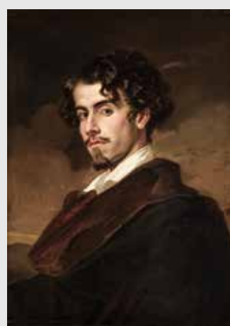
) Valeriano Domínguez Bécquer, Retrato de Gustavo Adolfo Bécquer

La Iglesia deja de ser el cliente principal del arte. El ascenso de la nueva clase burguesa trae consigo una revalorización de nuevos géneros como la pintura de historia, el paisaje y, sobre todo, el retrato. La pintura sevillana se revaloriza a través del Romanticismo y, más concretamente, del costumbrismo, que estará presente hasta bien entrado el siglo XX. Al finalizar el siglo, el paisaje realista y artistas como José García Ramos o José Villegas, con su obra La muerte del maestro , marcarán el arte sevillano.