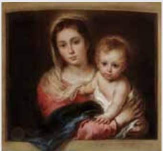
) Bartolomé Esteban Murillo, Virgen con el Niño o Virgen de la Servilleta