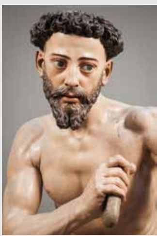
) Juan Martínez Montañés, Santo Domingo de Guzmán (detalle)

Junto con Velázquez, Murillo y Valdés Leal, Zurbarán es uno de los pintores imprescindibles del Barroco sevillano. Aporta una profunda espiritualidad, como puede verse en el conjunto pintado para la cartuja de Santa María de las Cuevas y en las figuras para el convento de San Pablo. La sala se completa con las esculturas en madera policromada de los dos escultores más importantes del siglo XVII sevillano: Martínez Montañés y Juan de Mesa, maestro y discípulo.