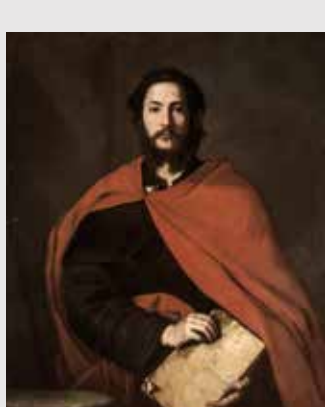
) José Ribera, Santiago el Mayor

Ofrece un conjunto de obras barrocas europeas, fundamentalmente italianas y flamencas, en las que se pueden apreciar otros géneros pictóricos como el bodegón, el paisaje, la pintura de batallas y el retrato. Destaca especialmente el Santiago el Mayor de Ribera, artista español que desarrolló su carrera en Nápoles, así como la única pieza de orfebrería expuesta, El carro de Neptuno .