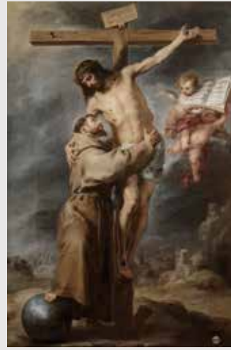
) Bartolomé Esteban Murillo, San Francisco abrazado a Cristo

Se exponen en ella los grandes cuadros de altar de los más importantes pintores del Barroco sevillano como Juan del Castillo, Herrero de Vieja, Roelas y Zurbarán; y las pinturas que Murillo realizó para uno de sus mejores conjuntos, el que pintó para el convento de Capuchinos de Sevilla.