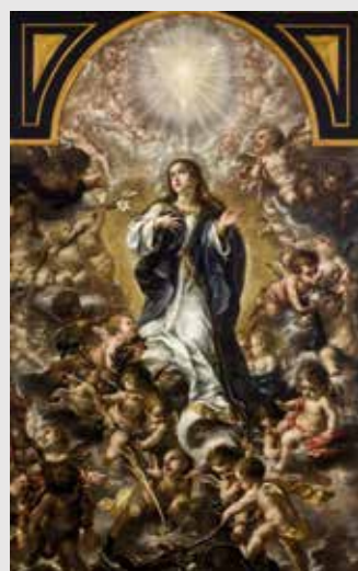
) Juan de Valdés Leal, Inmaculada Concepción

Dedicada a la obra de Juan de Valdés Leal, artista que manifiesta una concepción más dramática y expresiva en su pintura. Se caracteriza por composiciones dinámicas y abiertas, con una pincelada más energética y grandes contrastes cromáticos. Contemplamos dos de sus grandes series: la que pintó para el monasterio de Buenavista y la de los jesuitas de Sevilla.