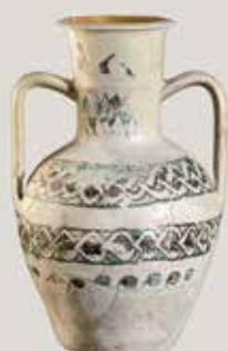
) Jarra con decoración vidriada en verde y manganeso