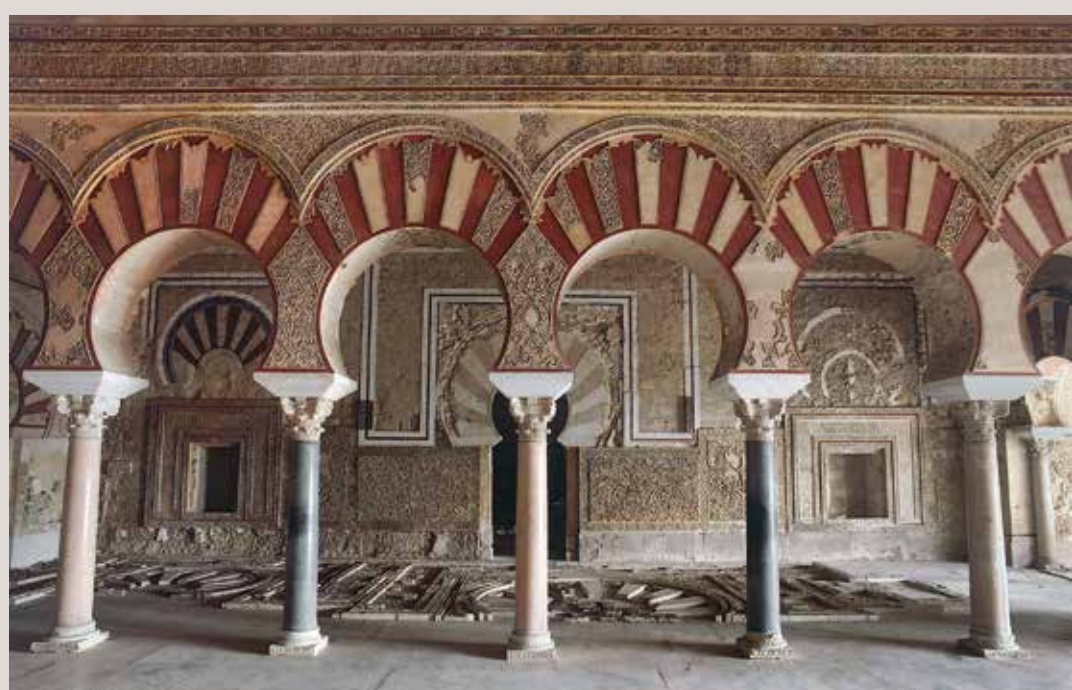
) Interior del salón de Abd al-Rahman III o salón Rico

Desde el camino de bajada a la siguiente terraza puede contemplarse la mezquita aljama (11), emplazada en el nivel inferior de la ciudad y correctamente orientada hacia el sureste. Frente a ella existen varias viviendas que pueden ser relacionadas con el personal al servicio de la mezquita (12). El recorrido por el sector oficial del alcázar culmina en la terraza presidida por el salón de Abd al-Rahman III (13), uno de los majestuosos salones destinados a las recepciones políticas celebradas en la ciudad. Constituye el núcleo principal de un conjunto integrado por