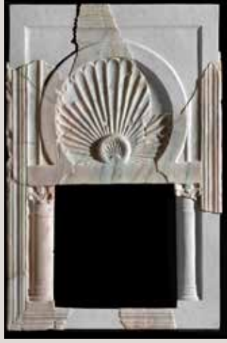
) Arquito decorativo en mármol blanco de una letrina