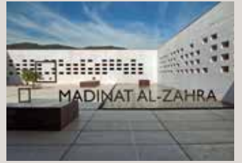
) Patio visto desde el vestíbulo