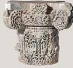
) Capitel compuesto con decoración tallada a trépano o "de avispero"