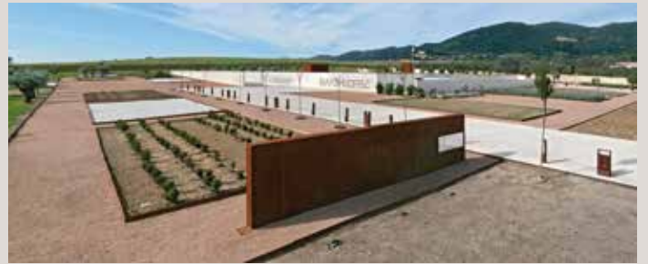
) Vista general del museo

Tiempo estimado de visita al museo: 45' - 1h 15'.