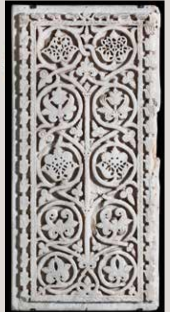
) Tablero decorativo de mármol