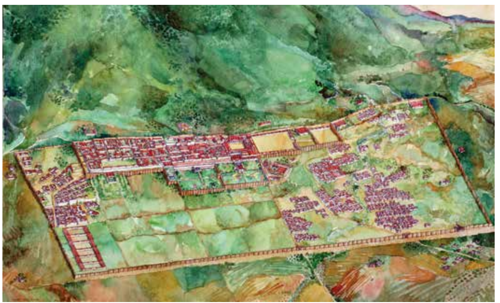
) Reconstrucción de la ciudad de Madinat al-Zahra. Hipótesis de su estructura urbana

La nueva ciudad, denominada Madinat al-Zahra (La ciudad brillante), se ubica en la terraza superior privilegiada, en sucesivas terrazas que se adaptan a la topografía del terreno, con amplias perspectivas sobre el valle del Guadalquivir y la campiña. Una muralla de planta rectangular, con un perímetro de cerca de 4.500 metros, delimitó la ciudad, que se organizó internamente en dos partes bien diferenciadas: