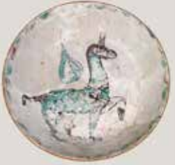
) Ataífor con representación zoomorfa en verde y manganeso