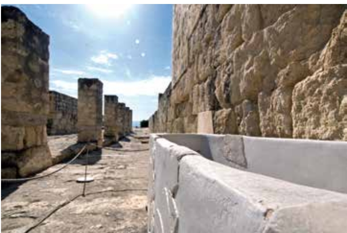
) Pila de las caballerizas