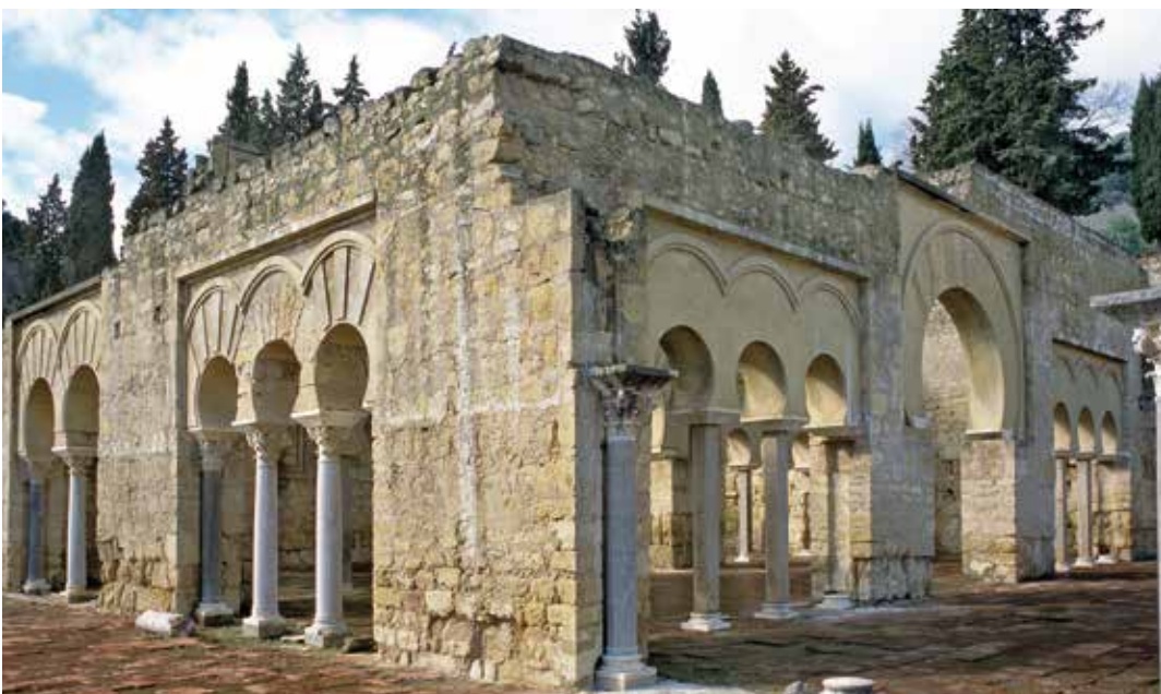
) Edificio basilical superior

corredor o callejón, se encuentran las viviendas de servicio (6), donde hay un horno para la preparación de alimentos. Otras grandes residencias son la casa de la Alberca (7) y el patio de los Pilares (8), ambas actualmente en proceso de consolidación y no abiertas al público. Volviendo al Cuerpo de Guardia y en dirección este, iniciamos el recorrido por el sector administrativo del alcázar. Encontramos en primer lugar el gran edificio basilical (9), que consta de cinco naves paralelas y una transversal, muy austero en su decoración.