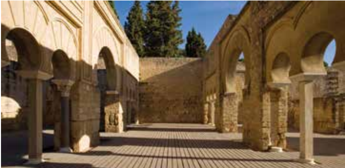
) Nave central del edificio basilical superior

Es el sector de la ciudad donde se desarrolla la vida del califa y su corte, incluyendo tanto edificios de carácter administrativo y oficial, como las residencias y espacios de servicio asociados. El alcázar se ubica en las terrazas superiores de la ciudad y se separa de la medina mediante su propia muralla.