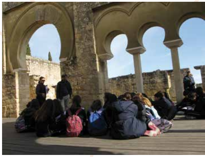
© ilustración: Pilar del Pino. D.L.: SE 778-2018

Para el buen uso de estas instalaciones y para el disfrute de todos, es necesario cumplir las normas establecidas por el centro y atender las indicaciones del personal de vigilancia.