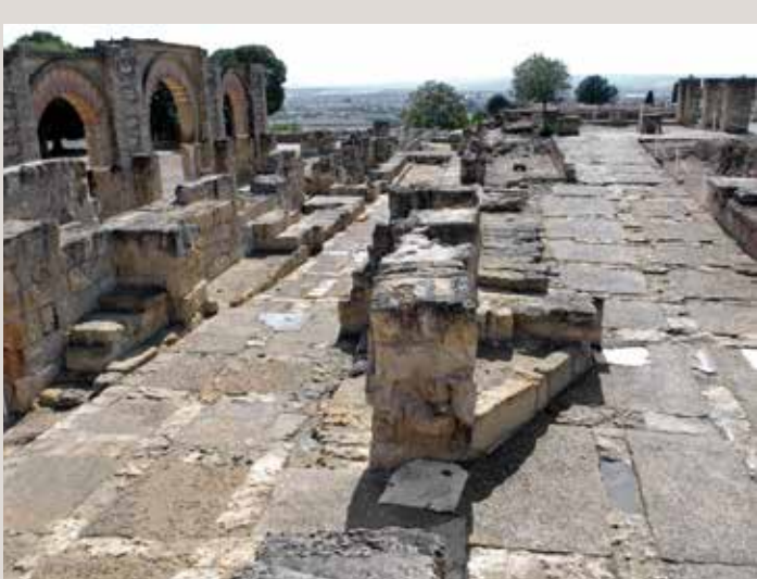
) Calle en rampa de acceso al pórtico

tectónica, organizada como fachada de la plaza de Armas del palacio, donde, entre otros muchos actos, probablemente se celebraban las paradas militares.