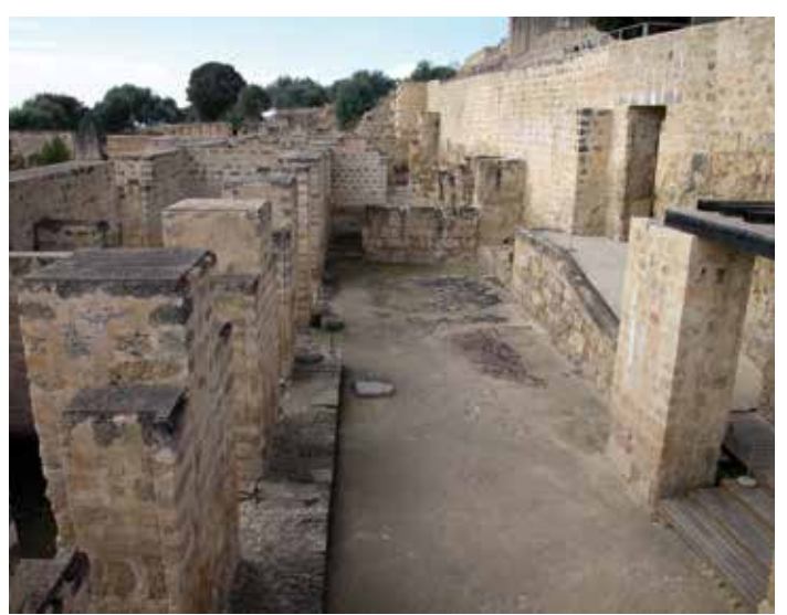
) Espacio trapezoidal conocido como Cuerpo de Guardia

Desde esta puerta se accede al sector residencial del alcázar, a través de una calle paralela a la muralla que conduce a las viviendas superiores (2). Estos espacios organizan sus habitaciones en torno a amplios patios cuadrados. Una calle de separación entre las mismas desemboca en el Cuerpo de Guardia (3), controlando el acceso entre la zona administrativa y la parte más privada del alcázar. Entre ambas zonas se encuentran las caballerizas (4), por las que se accede a la llamada casa de Ya'far (5), un buen ejemplo de residencia de un alto cargo de la administración califal. Separadas de esta gran vivienda por un