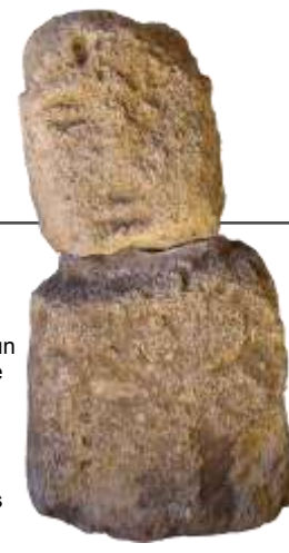
Figure anthropomorphe ou betillo , découverte dans la nécropole de Baelo Claudia