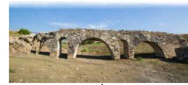
▲ Aqueduc de Punta Paloma. Arcade qui enjambe le court d'eau de Chorrera.

Il existe aussi une autre nécropole importante qui correspond avec la période de décadence de Baelo Claudia et qui se situe le à côté de la muraille orientale de la cité, d'un côté et de l'autre du ruisseau contigu.